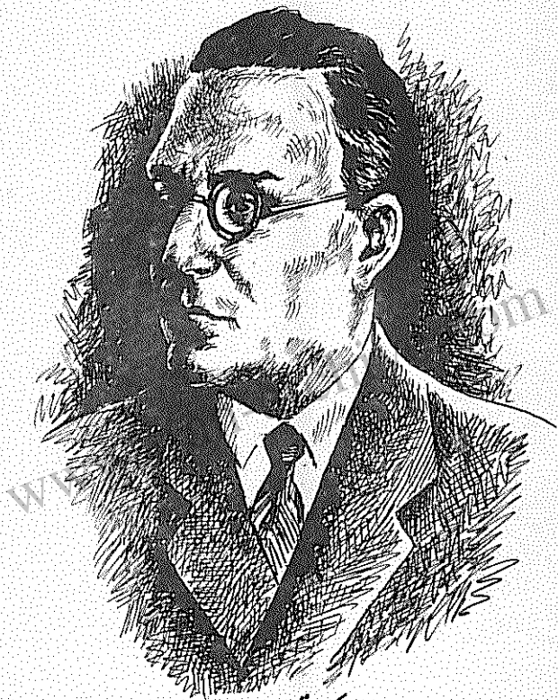
دکتر تقی ارانی