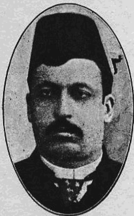
میرزا آقا خان کرمانی