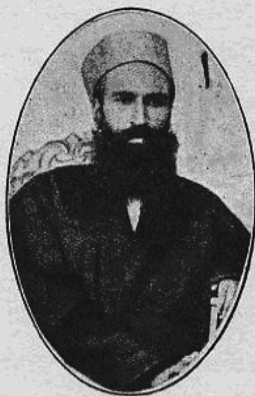
شیخ احمد روسی کرمانی