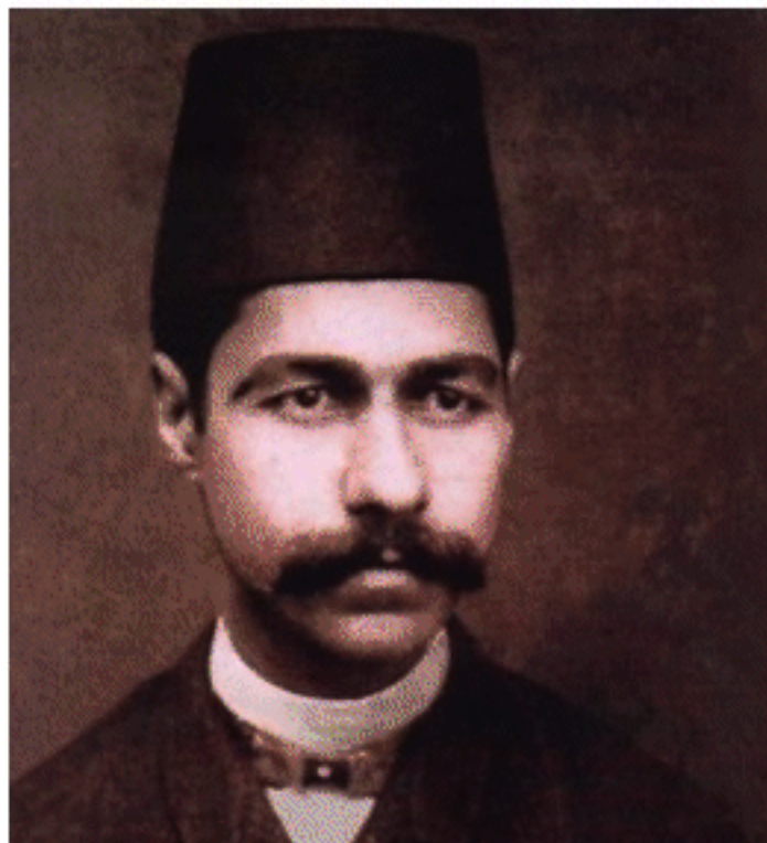
میرزا آقاخان کرمانی