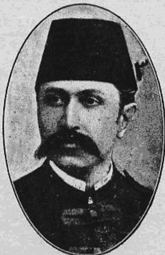
حاجی میرزا حسن خان خیر الملک