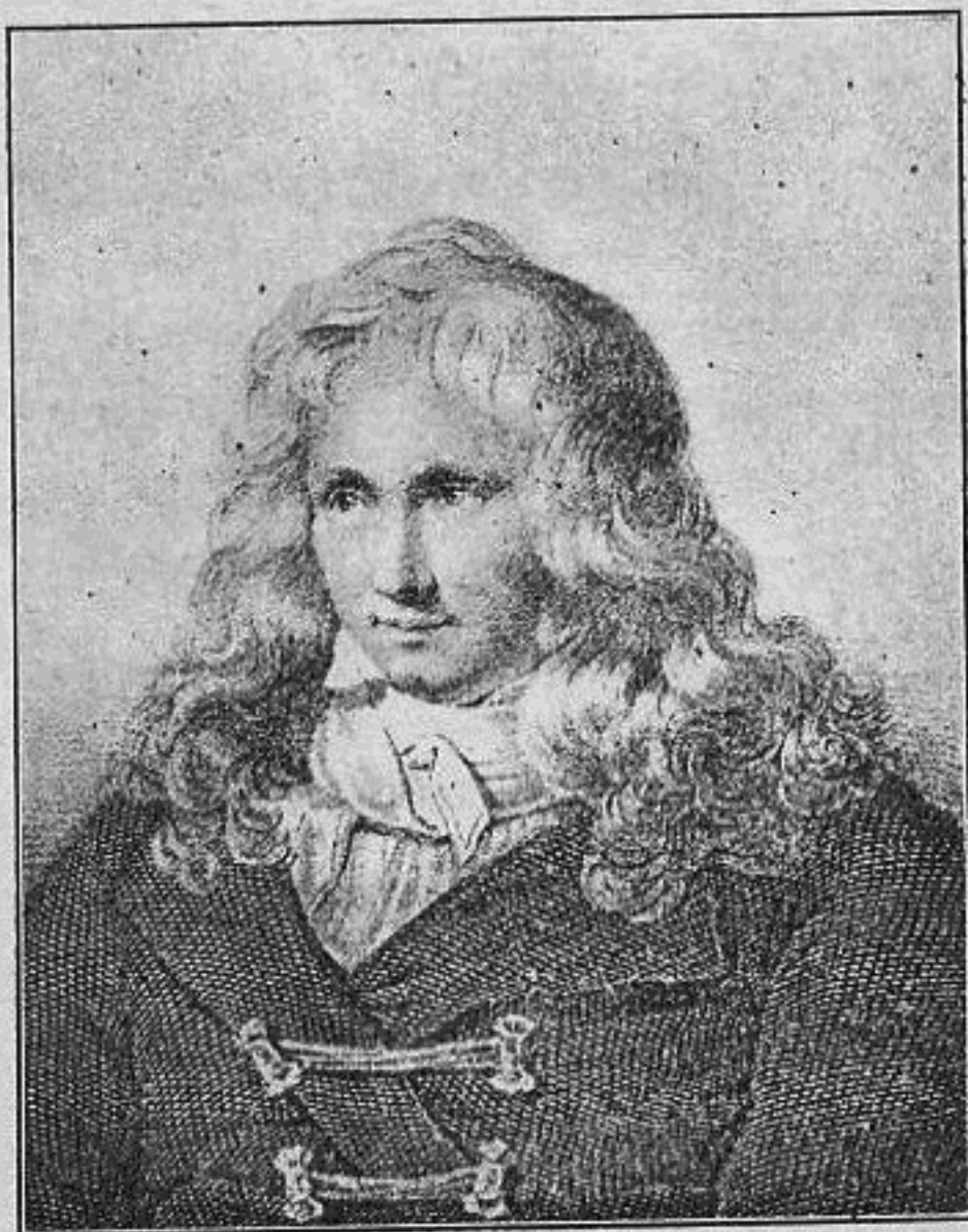
برناردین دی سن پیر مؤلف اصلی کتاب قهوه‌خانه سورت

گونه شادکامی و خرمی محرومش ساخت و کسی را نمیدید که در آن بدبختی دستی بمساعدت او دراز کند و ویرا از تنگنای بلیه نجات دهد و گره از کار فروبسته او بکشاید — هیچ صاحب‌دلی را نیافت که در باره او مهربانی و مردی کند، و بنا بر این