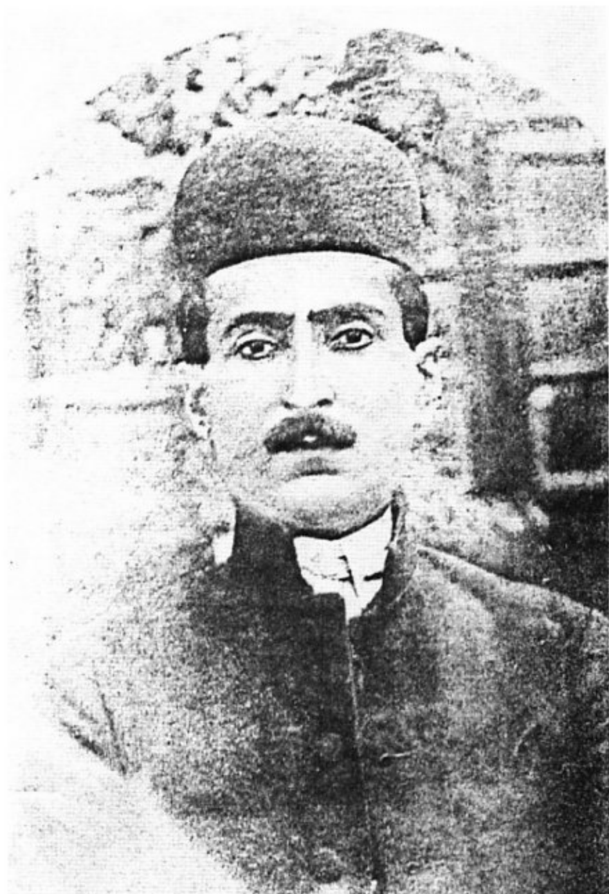
علی مردان خان بختیاری (برگرفته از کتاب آنزان)