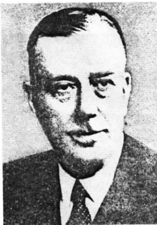
سر جان کدمن