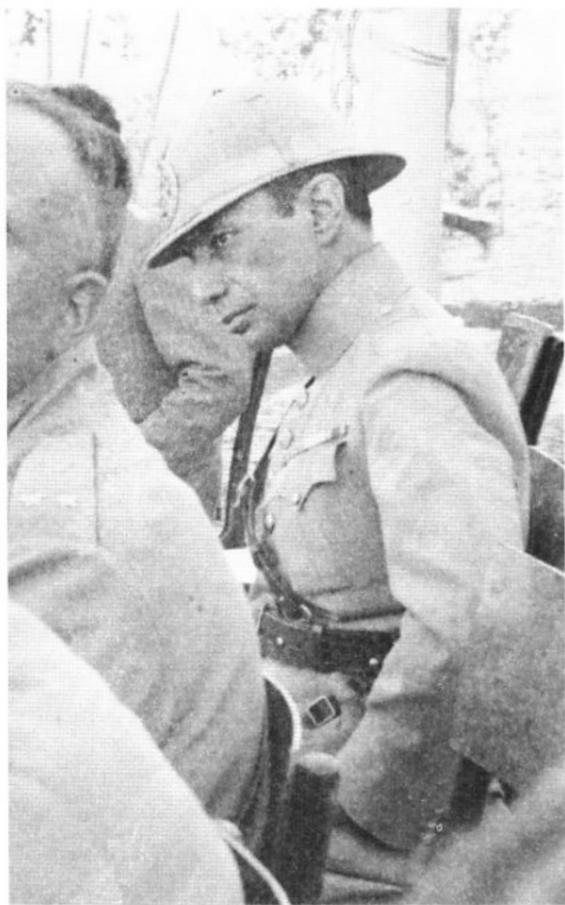
سرپاس مختاری رئیس شهربانی