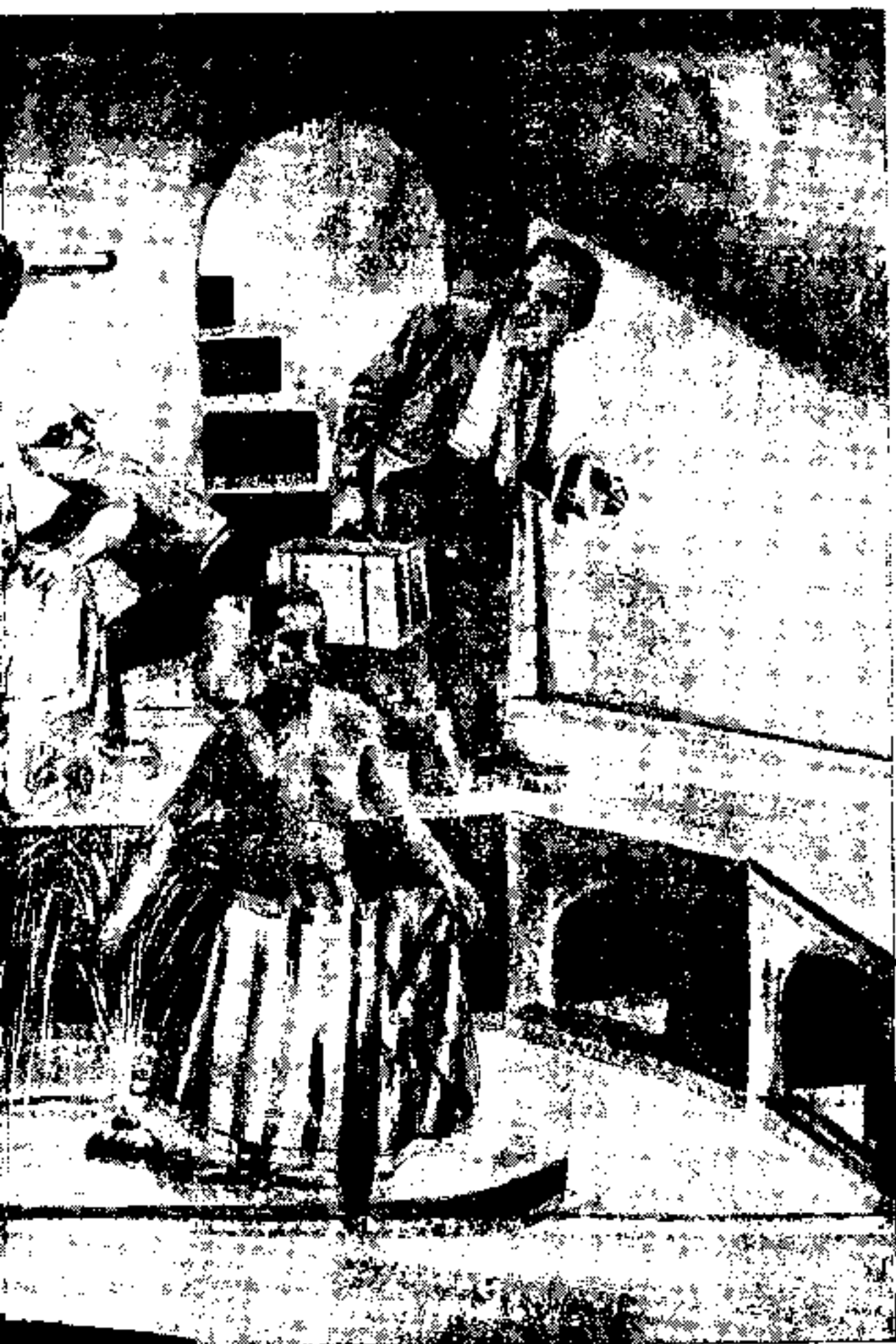
تدین سهیلی : تا حمام گرم است و حمامی ها از خودمان هستند به رفقا بگو خود