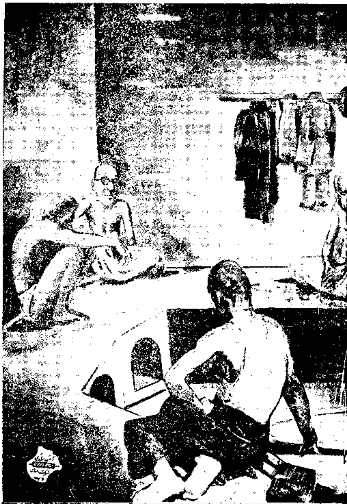
دشان را پاك كند استاد جهان شاهي خوب چرك مرا گرفت | نقل از شماره ۱۰۹ مرد امروز