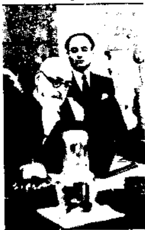
آقای جهانناهی رئیس دیوان کشور در هماینگه رای برائت سهیلی قرار میگردید

و با توجه به مدافعاتی که از طرف متهم و وکلای مدافع بعمل آمده دلایل موجوده برای ثبوت اعمال انتسابی از روی سوء نیت کافی نبوده و معلوم نیست که اقدامات متهم بسبب انتخاب یا عدم انتخاب اشخاص معینی شده باشد - راجع بمورد مذکور در فقره پنجم کیفرخواست عمومی تقاضای تعیین مجازات (تفسیر قانون حکومت نظامی) که با استناد ماده ۲۸۰ قانون مجازات متهم شده است عمل انتسابی این است که آقای سهیلی بر طبق تصویب نامه هیئت وزیران مورخ ۲۷ فروردین ۱۳۲۲ با استناد ماده پنجم قانون حکومت نظامی مصوب ۲۷ سرطان ۱۳۲۹ اختیارات دولت را در امور راجع به امنیت و آسایش عمومی به وزارت جنگ معول نموده و ضمناً اموری راجع به امنیت و آسایش عمومی را که میبایست مشمول مقررات حکومت نظامی گردد توضیح نموده چون ماده يك قانون حکومت نظامی به هیئت وزیران اجازه داده که امور مربوط به امنیت و آسایش عمومی را بوزارت جنگ معول نماید و لازمه