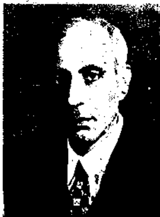
آقای ظلی مدیرکل بازرسی دارائی (مربوط به صفحه ۳۳۵)