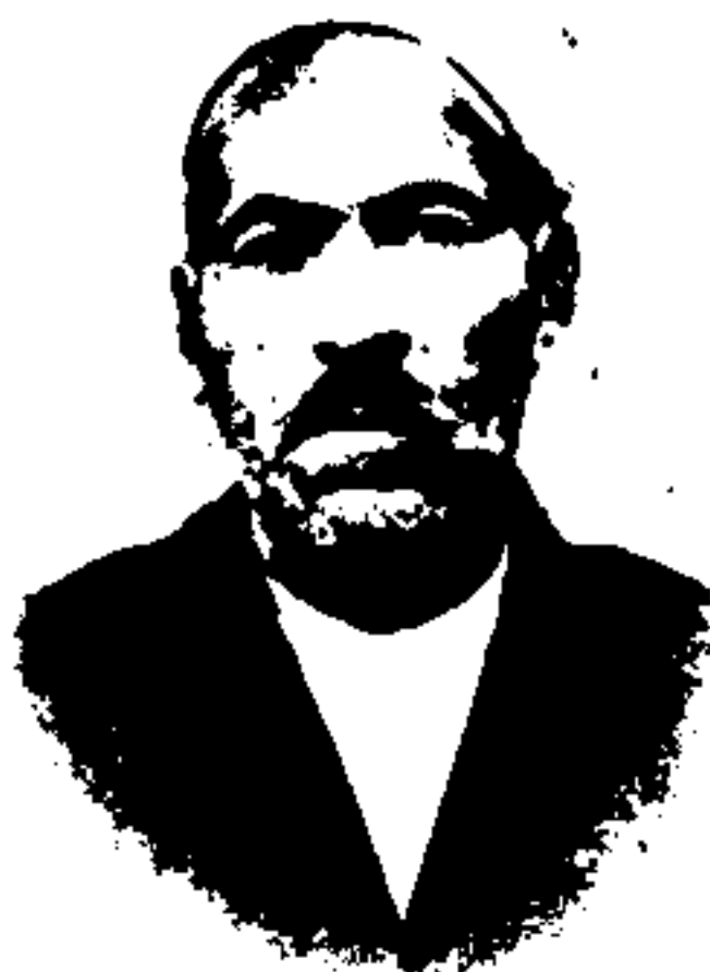
شادروان میرزا اسمعیل لوبری فرزند مرحوم حاج محسن آقا تاجر تبریزی، نماینده شجاع آذربایجان در دوره دوم مجلس شورای ملی و ازدموکراتهای معروف آن زمان (رجوع نمود به ص ۶۴)