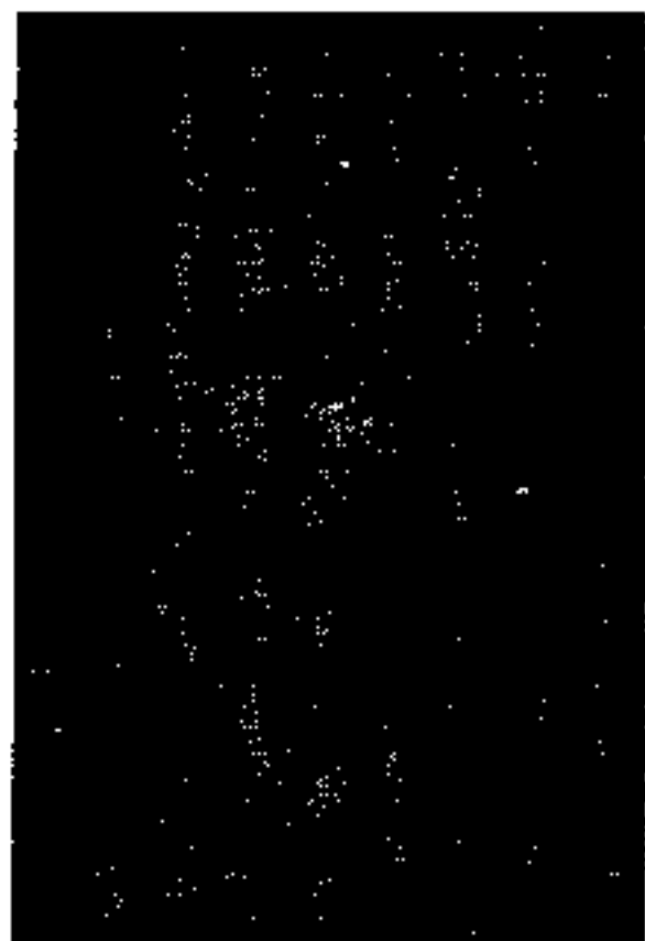
دکتر میلیسپو رئیس سابق کل دارائی

بود عیببایست معلوم شود جدیتی که دولت در این باب بخرج داد از طرفی و از طرف دیگر بواسطه تشکیل کابینه که از ابتدا اختلاف نظری حاصل شده بود سبب شد که از همان روزهای نخست بعضی از موافقین اولیه از من روی گردان شدند این پیش آمده نمیتوانست دولت را از انجام وظیفه منحرف سازد زیرا قضیه رئیس کل دارائی جنبه عادی را از دست داده و بصورت نامطلوبی درآمد بود بطوریکه حیثیت ملت و دولت تصفیه سریع این امر را ایجاب مینمود. من کار تمام باینکه موافقین دکتر میلیسپو چه دلایل خصوصی و عمومی برای موافقت خود اقامه میکردند یاد دلد داشتند ولی یک دلیل بود که از ذکرش خودداری نمیشد و برنده ترین دلایل آنها بشمار میرفت