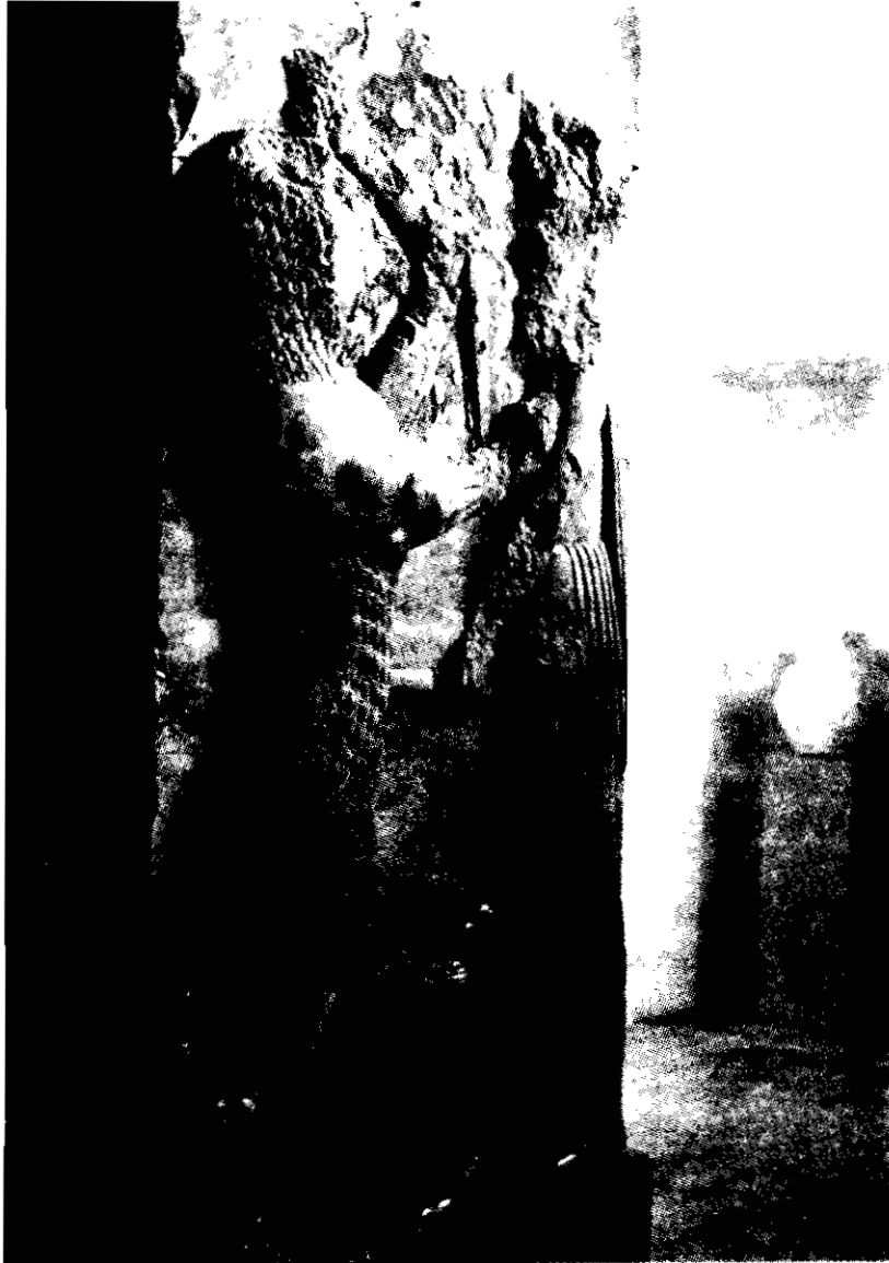
شکل ۳. قهرمان سلطنتی در حال کشتن شیر با خنجر، از درگاهی در تخت جمشید