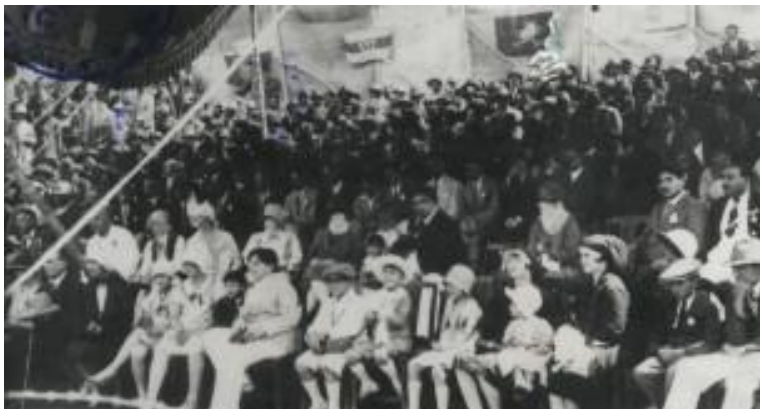
در لوی جرگه ۱۳۰۷ ملکه ثریا همسر شاه امان الله خان نیز در جرگه حضور داشت

۱- باید در شکل این جرگه، جرگه استحضاری را داشته باشد. کمیت و ترکیب اتنیکی اشتراک کننده گان نباید موضوع عمده را تشکیل بدهد. زیرا در چنین شرایطی که افغانستان به زون های تحت نفوذ و سلطه غارتگران "جهادی"، "طالبی" و شرکای داخلی و بین المللی جنایات ایشان قرار دارد