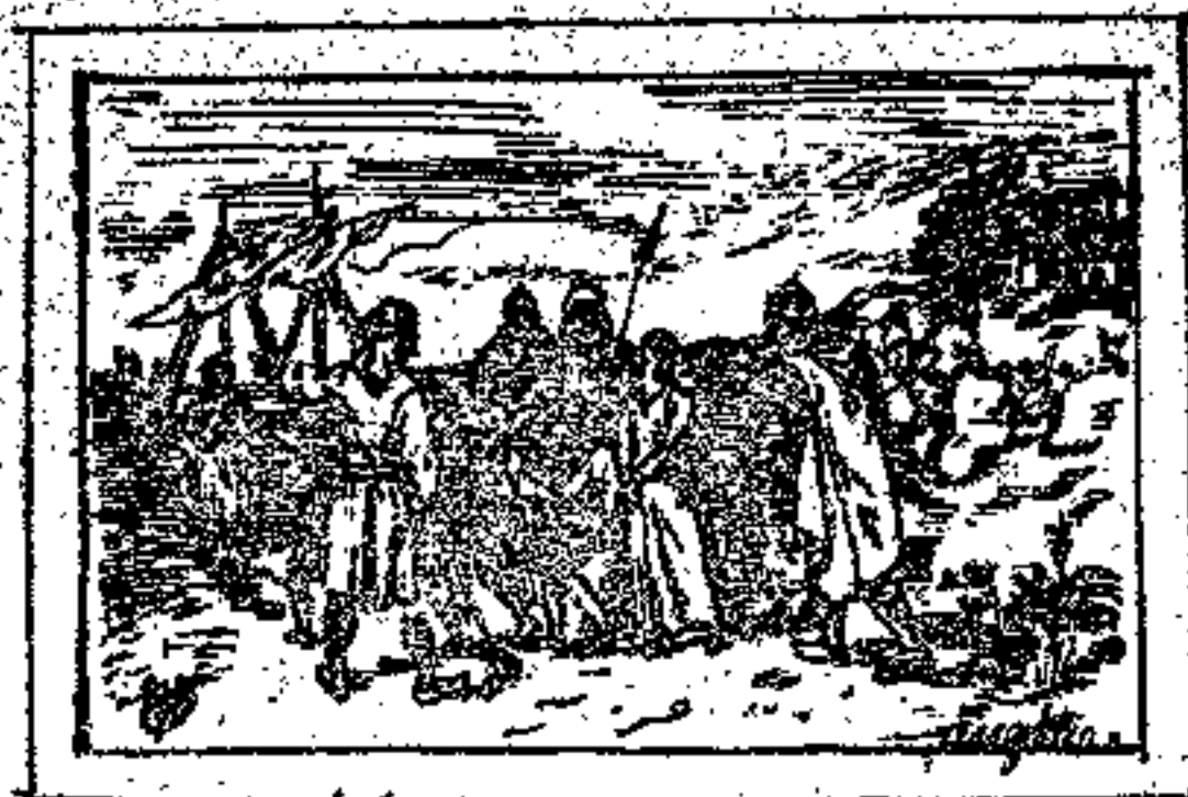
مردمان با در جزیره سیر میگردند

بعضی از مسلمانها در هندوستان در روی دریا بغارت و کسب غنیمت اشتغال داشتند و در تمام دریای مدیترانه با کشتیهای خودشان سیر میکردند و چون عیسویان را میدیدند آنها را اسیر نموده غلام و کنیز خود قرار میدادند غالباً در سواحل ایتالیایی و فرانسه را برای غارت ممالک ترکستانی خود آمده زمان اطفال را اسیر میکردند