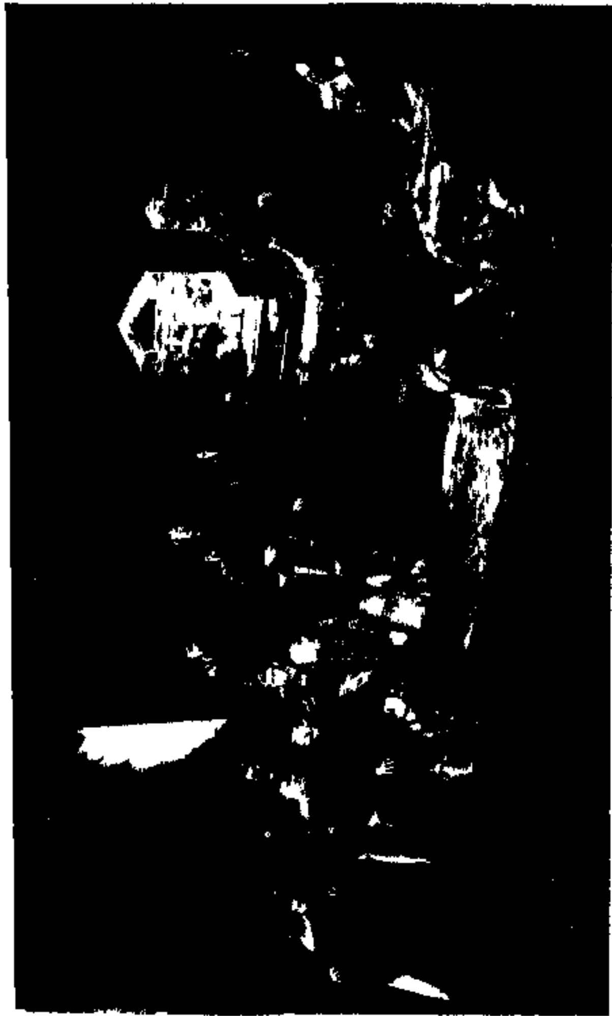
..... مردگان با پیست زشم کاری بود سر ، باز از جای میخیزد و مارا از جایگاهان میراند