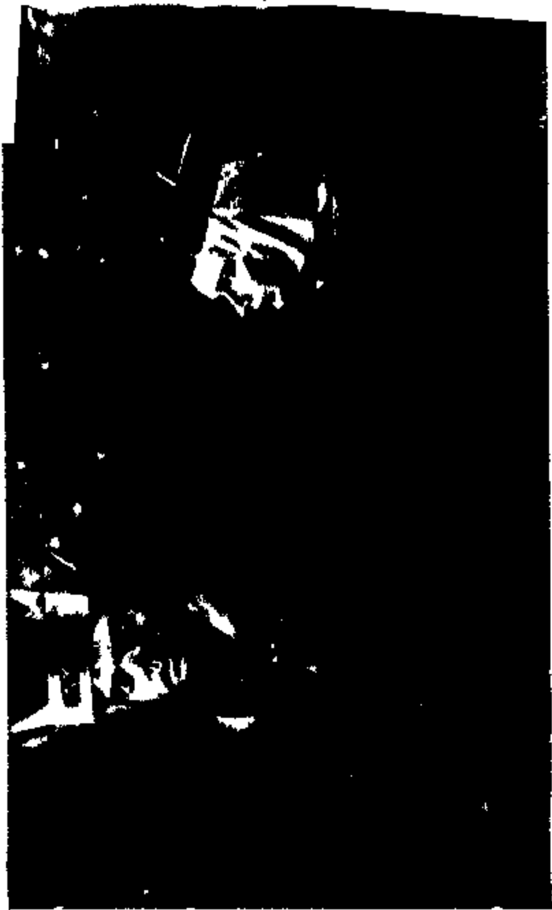
.... گروه از ابروان پرچاق، پکنایه، امشب میان مهملان خود خندان و سوزشور باشید