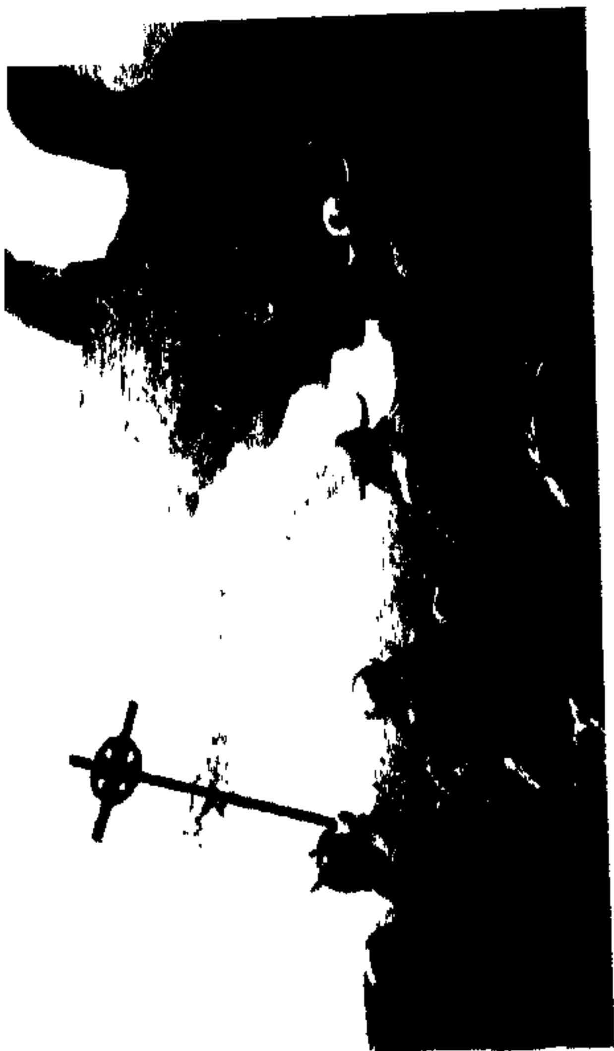
سپت مېرید از راه :