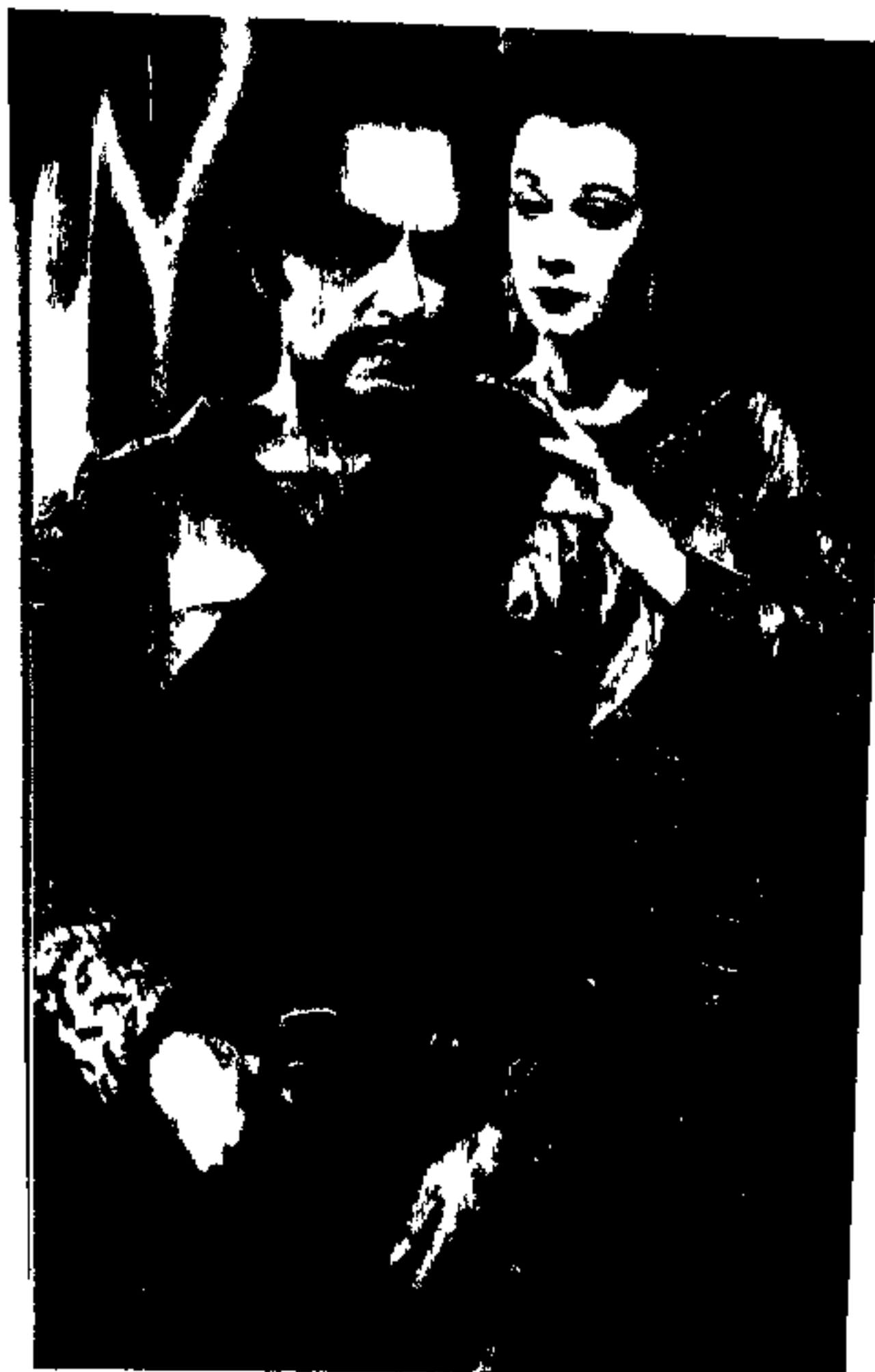
. برای هر بختن روزگار مردزگار مانده شوید . تغییر چهره شامه ترس است . . ص ۲۴