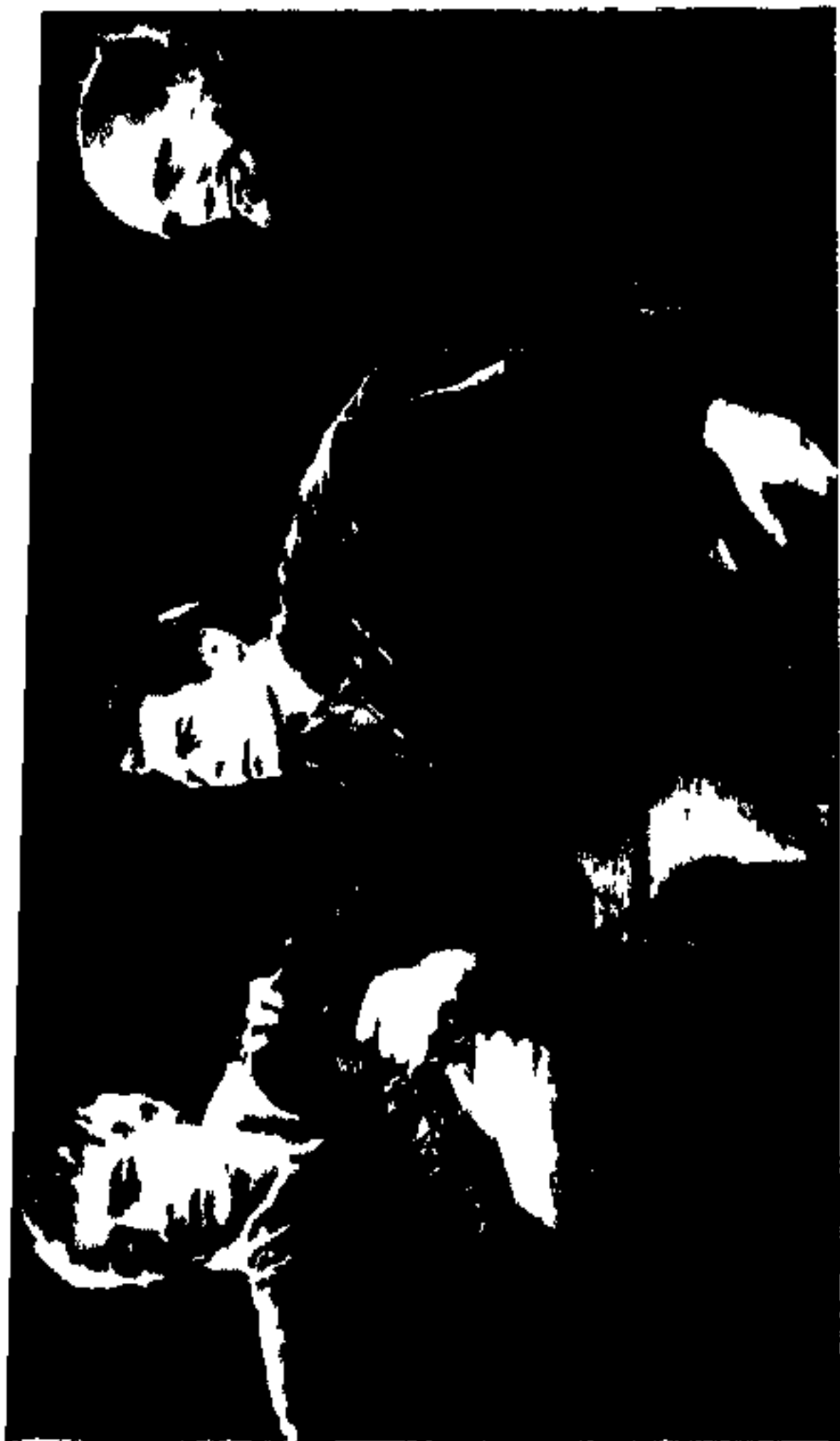
چه می‌شوم ، همه کودکان زیبایم و مادرشان با یک جمله نابود شده‌اند .