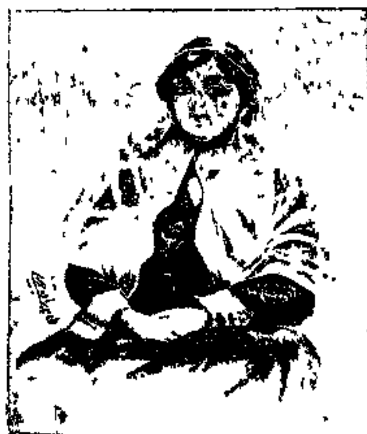
۵۰ شهربان درسی شادمانه سالگی

این سفر طولانی را نکند اما چون در خصوص بالاردن درجه نظامی او محل ایراد شده است که رعایت نسبت را نموده نخواهد در این مورد سخنی گفته باشد با او هم یکی دو مرتبه اظهار نموده که صحیح نیست تازه عروس را تنها بگذارد و برود اما نتیجه نگرفته و هوشنگ رفتنی شده است بهر صورت هوشنگ شهرناز و خانواده او را وداع گفته محل مأموریت خود روانه میگردد یا از زندان رها شده در فضای وسیع آزادی و بی قیدی نفس راحتی میکشد و کی میداند که هوشنگ خود اسباب تحصیل این مأموریت را فراهم نیاورده بلکه از دادن رشوت هم برای رسیدن مقصود دریغ ننموده باشد عجباً شهرناز هم از دور شدن همسر خود چندان دلتنگ نیست بلکه شاید وسیله خوشحالی هم در باطن برای او شده باشد چونکه پس از