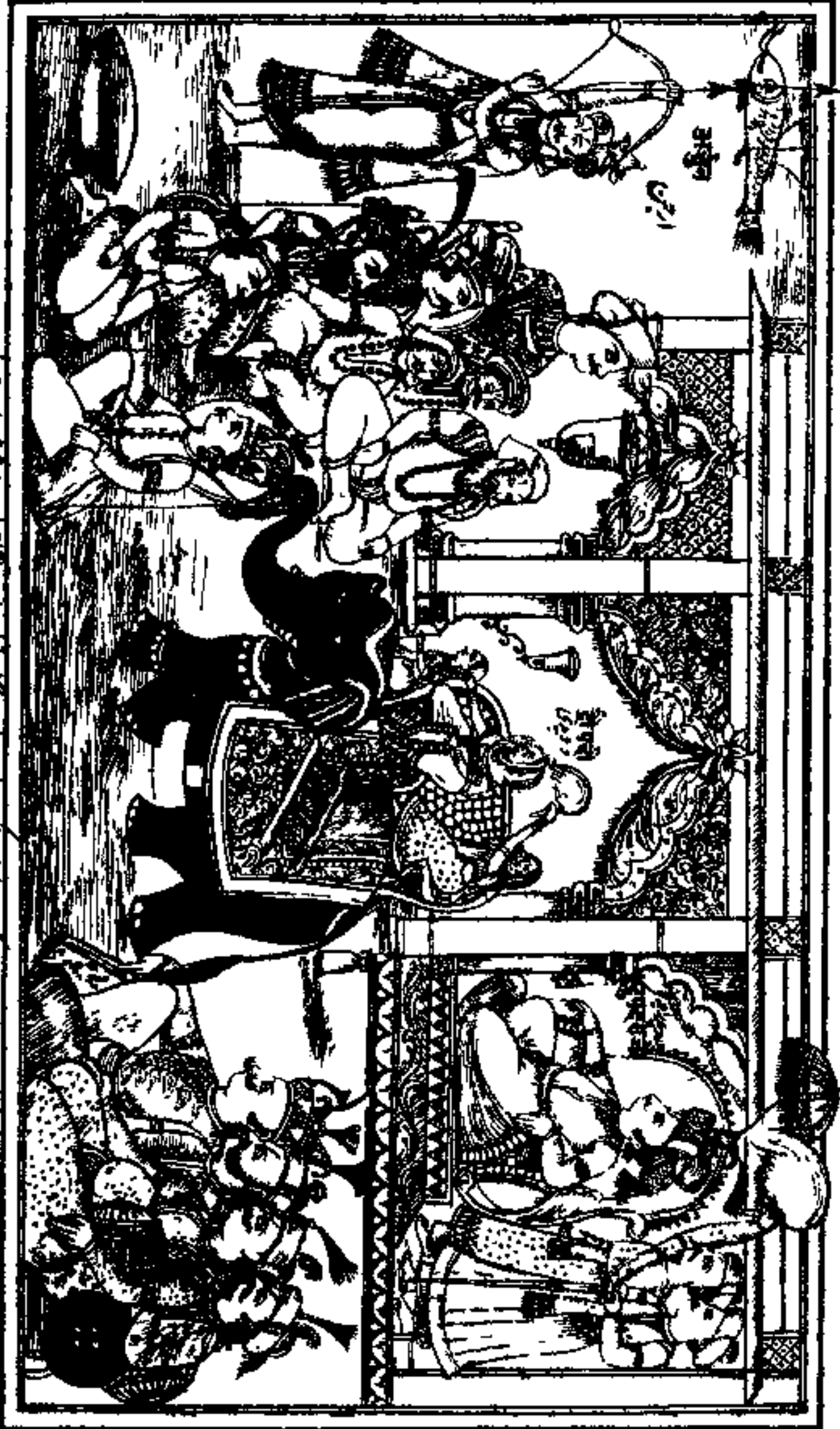
بھکر لال نے ہاں دے دھتورے ساکسن چو پتیاں لکھنوی ملازم ہاں جہ دریا کاپے شاہ رسا صاحب شاکھلا دار اور چو پتیاں سنہ ۱۸۷۰