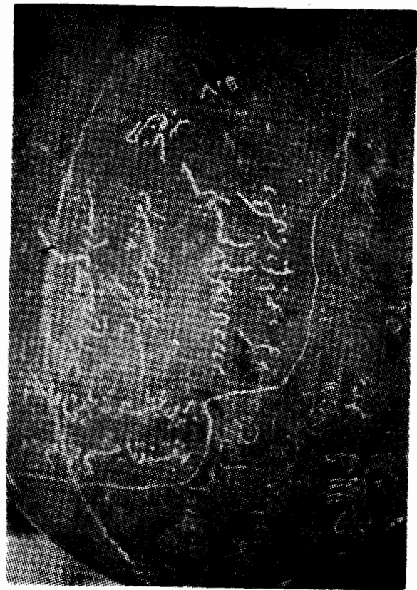
این سنگ نبشته بخط بابر در حدود سه صد متری جنوب غربی قریه آب بردن هزار بین فلغر و متجه تاجکستان نزدیک چشمه سار سرخ از زیر زمین بدست آمده است .

و این طو رزانو زدن و تقدیم کو رنش را منافی شان و کرامت فردی خود میدانند، ولی بابر این وضع آزادی رانمی پسندد و گوید که یکی از ملوک زادگان افغانی ایستاده بود و دیگران که در مرتبه از او پایین تر بودند می نشستند، و بنا برین این افغانان بسیار روستائی و بیهوش مردمند (۱) در حالیکه طرز تفکر بابر حاکی از محیط ارستو کراسی ، و روش افغانان ناشی از آزاده منشی و مساوات دوستی ایشان است . در سوکب بابر همواره توق و تقاره بوده (۲) توق و یا توغ بمعنی بیرق و نشان است که برای شکوه سلطنت دونوع بیرق داشت: اول چتر توق که بالای چتر تخت شاهی افراخته میشد دوم تمن توق که دراز تر از چتر توق و در پایه والا تر از آن بود، و موی دم قوتاس - قطاس یعنی غز گاورا بالای آن می بستند (۳) و این اعلام و تقاره گاهی بطور امتیاز خاص به امرای بزرگ هم داده میشد (۴) و به شهزادگان ، حق استعمال علم و تقاره در سواران نوازش آنها اعطا میگردد (۵) خود بابر مرد سوار کار شایق هر نوع شکار و بسیا ر جلد و تازنده قوی بود ابو الفضل گوید « که بعضی از خصوصیات احوال این پادشاه از غرائب امور است از جمله یکی آنکه بموزه دو پاشنه برکنگرهای قلعه جسته جسته می دویند، و گاه گاه دو آدمی در بغل گرفته از کنگر به کنگر می جستند.» (۶) بابر شخصاً شناور ماهری بود ، و با آب بازی از دریای گنگسی گذشت و از یک کنار دریا تا کنار دیگری سه بار دست می زد (۷) وی با کشتی گیری Wrestling-match هم شوقی داشت و همواره کشتی گیران ماهر را تماشا مینمود (۸) و از کشتی گیران دربار او پهلوان صادق و اودهی oudhi و کلال ود و ست