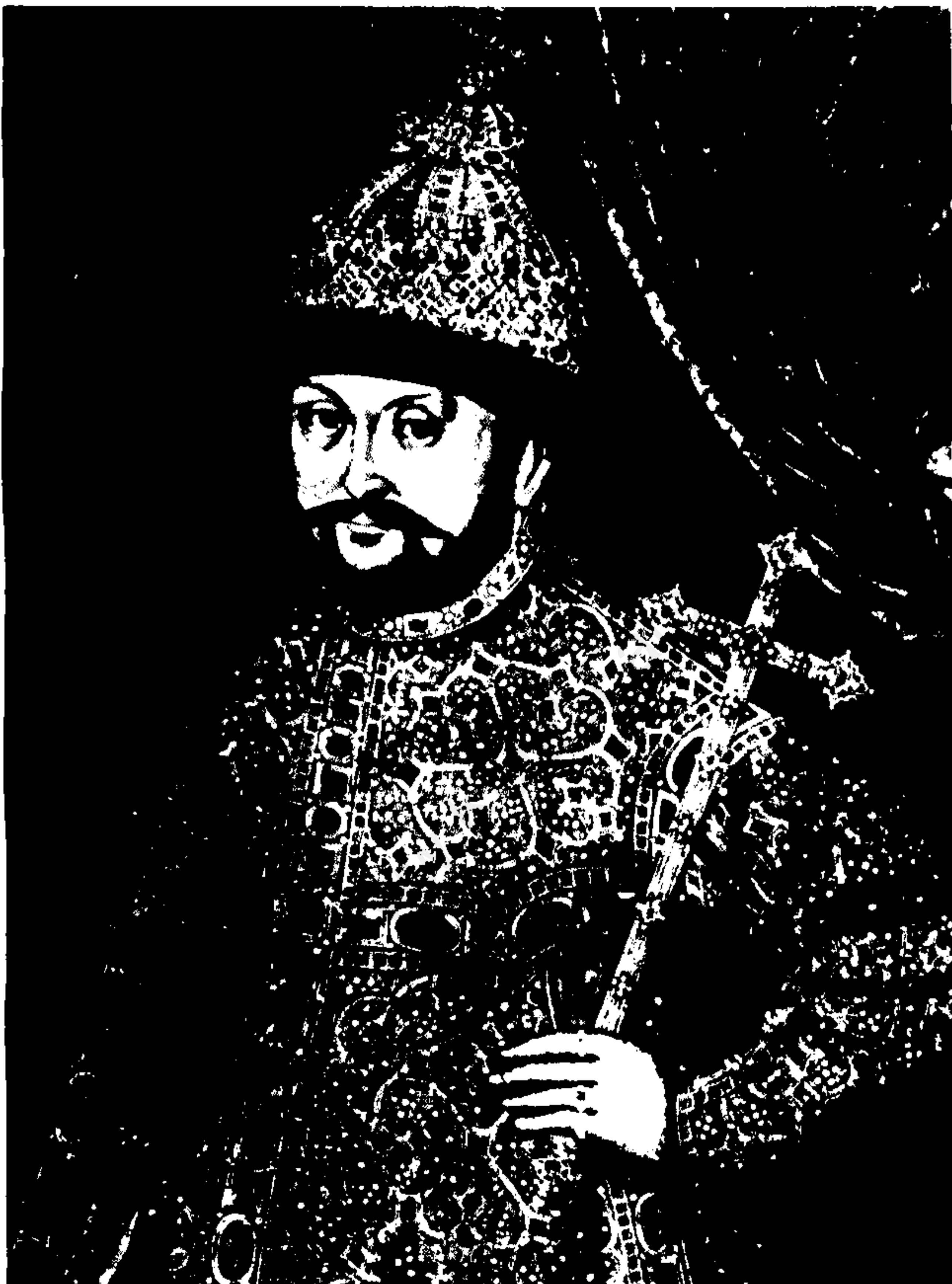
ظاهر و چهره و لباس و تاج یک تزار روسیه در قرن ۱۶