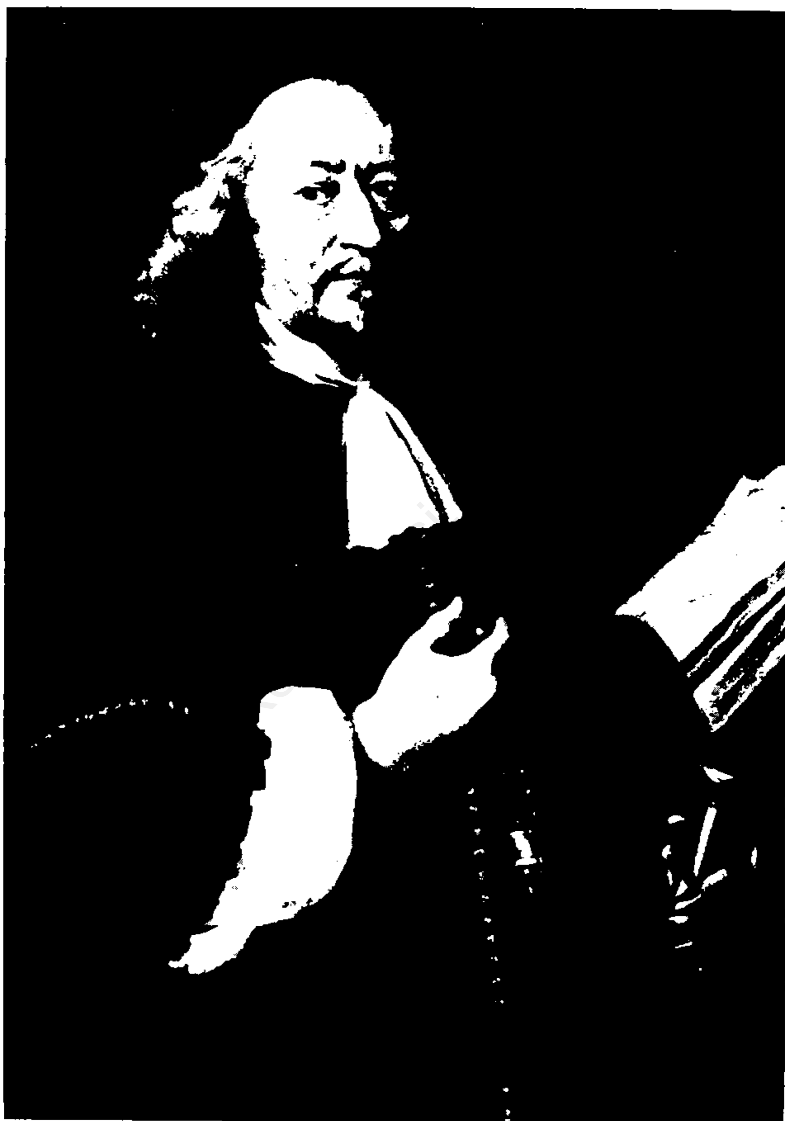
چهره واقعی آدام اولتاریوس در سالخوردگی نقل از کتاب قلب آسیا، چاپ لندن ۱۹۷۳ از مجموعه آلدوس