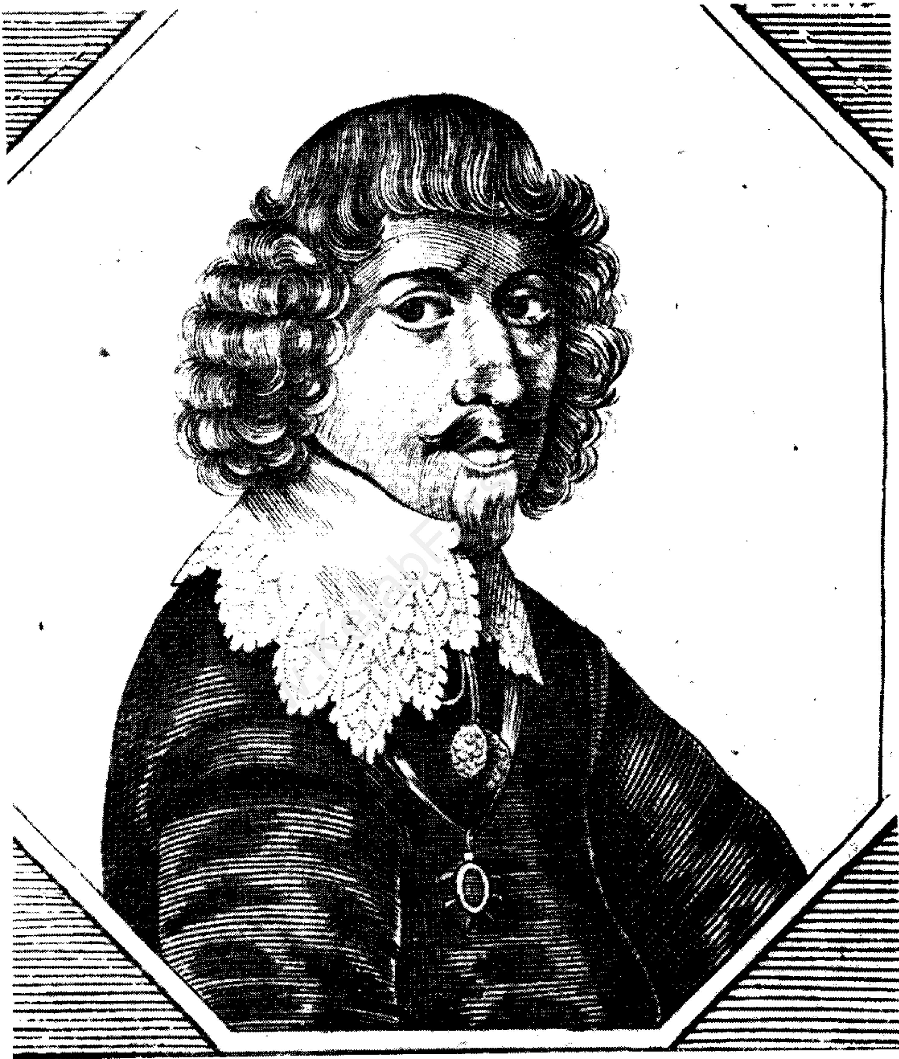
تصویر دیگری از آدام اولناریوس در جوانی و به هنگام سفر در ایران