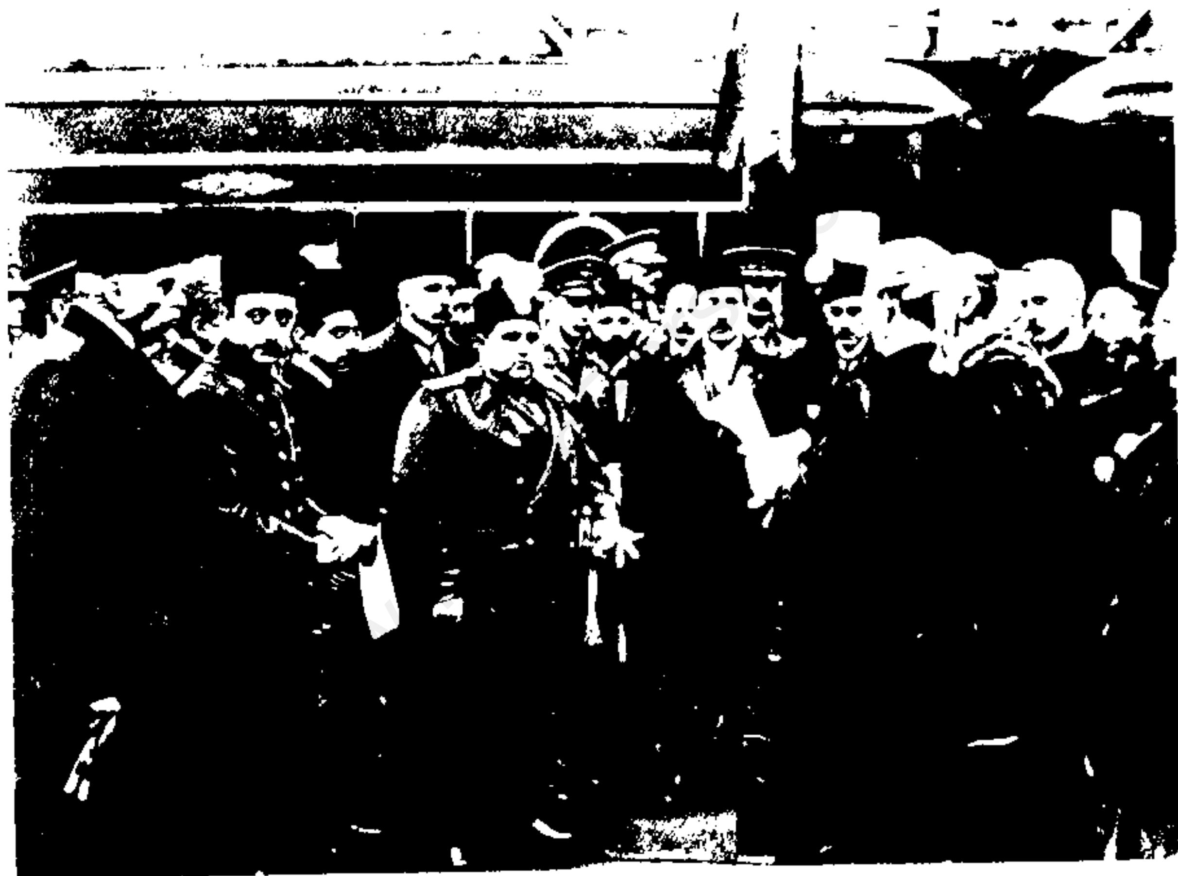
احمدشاه در انگلستان ۱۹۱۹ میلادی