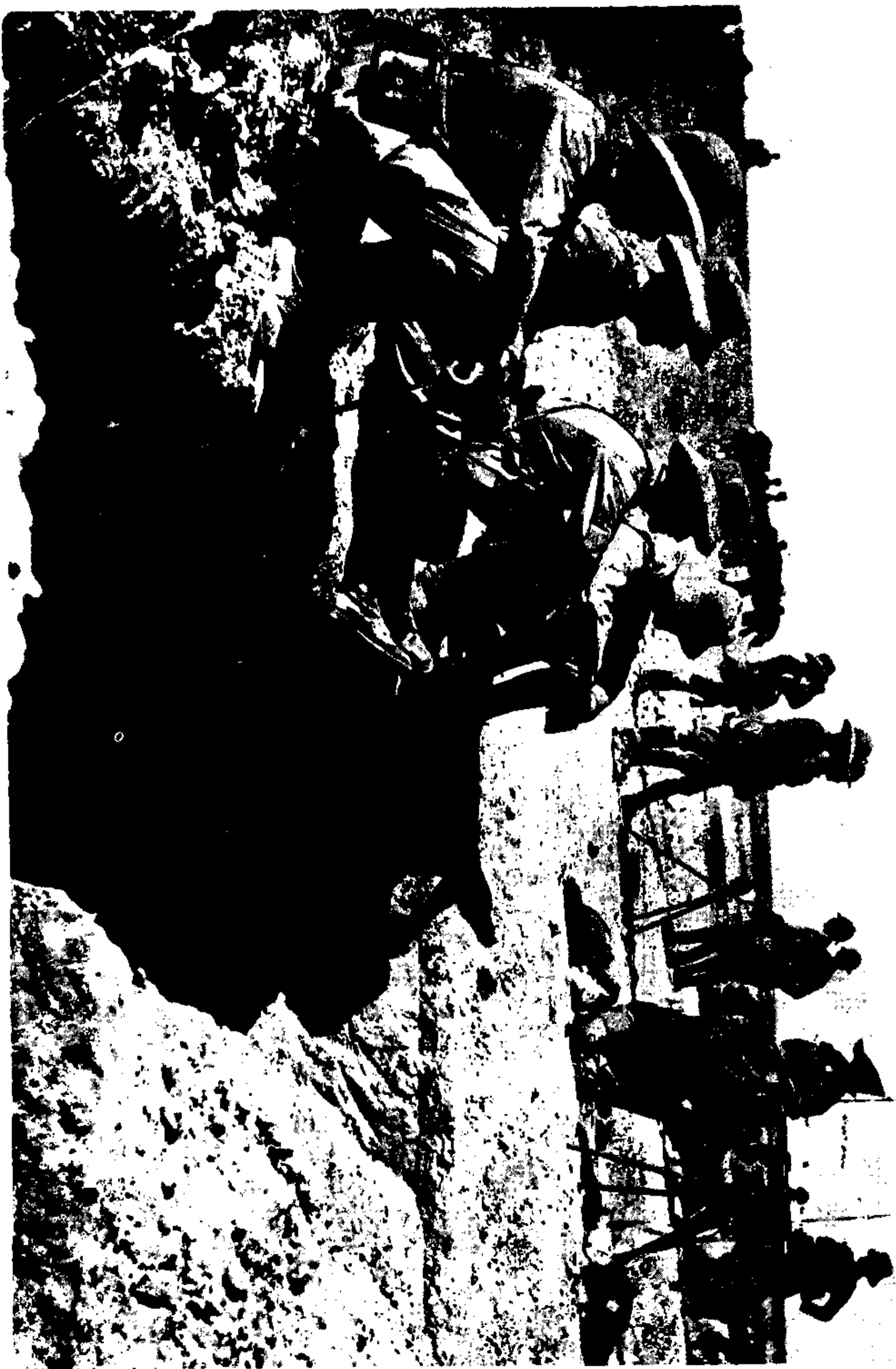
نیروهای انگلیسی در بین النهرین (عراق)