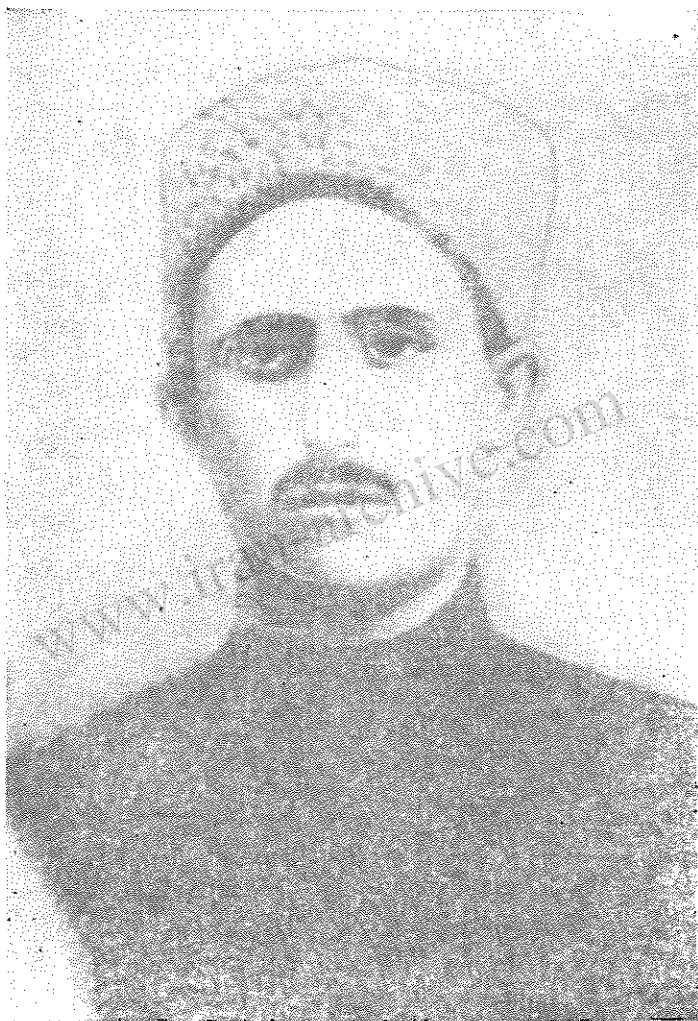
میر جعفر جوادزاده پیشه‌وری مؤسس مطبوعات کمونیستی ایران