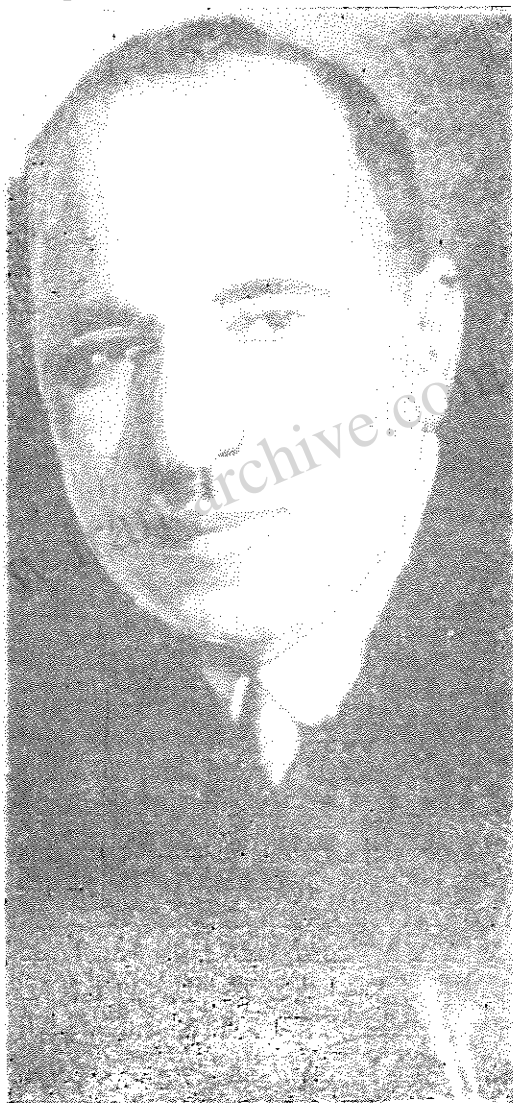
آ. سلطانزاده نویسنده برجسته مارکسیستی