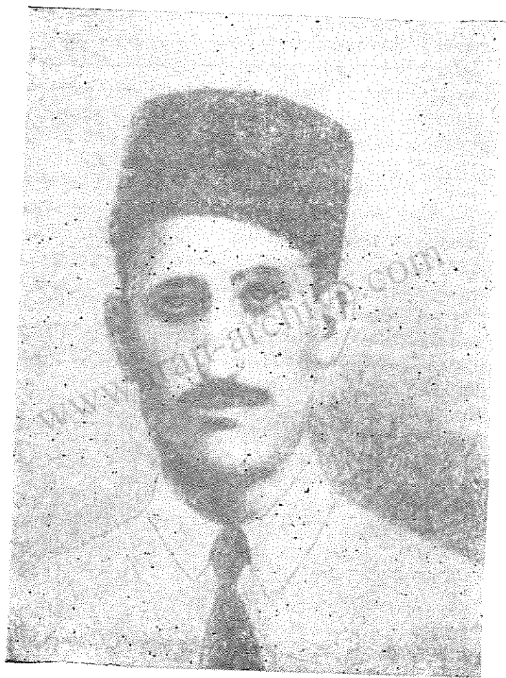
کامران آقازاده یکی از سازمان دهندگان مطبوعات کمونیستی ایران