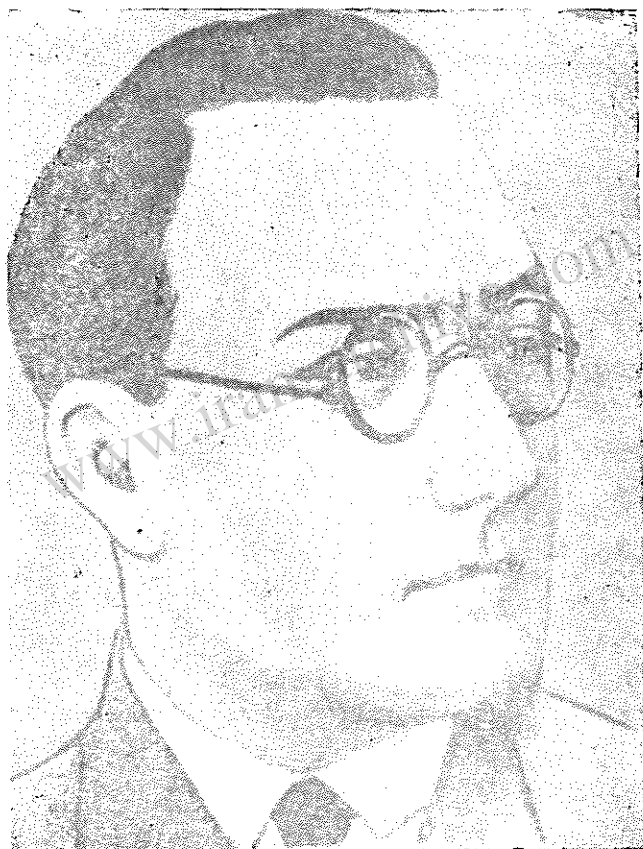
دکتر تقی ارانی رهبر زحمتمکشان ایران