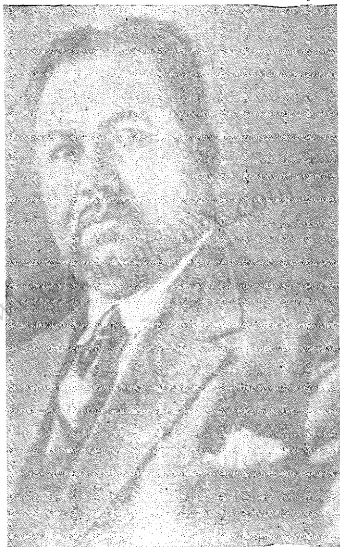
فرخی یزدی شاعر و روزنامه‌نگار انقلابی