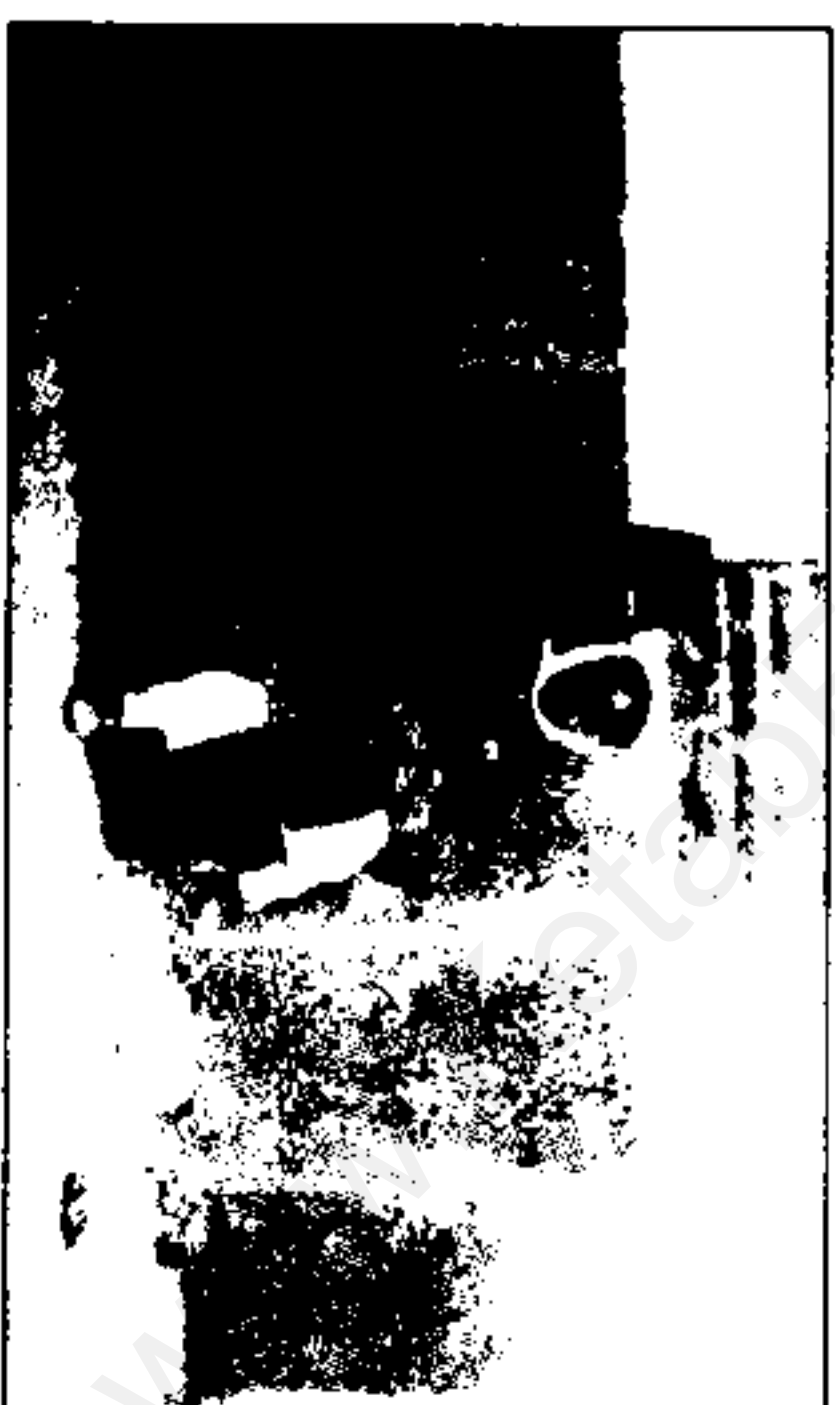
تصویر بالا: دار و دسته امین اقدسی پیش از نایبنا شدن او تصویر پایین: عزیز السلطان در آغوش ناصرالدین شاه (حدود ۱۳۰۳ هـ.ق)