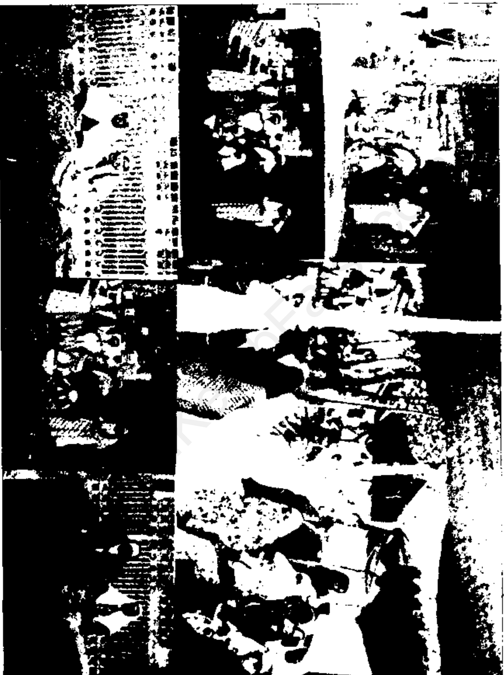
تصاویری که شاه در سال ۱۲۹۵ ه. ق. محض امتحان دوربینهای عکاسی خریداری شده از پاریس، در بناوران از اهل حرم برداشته است.