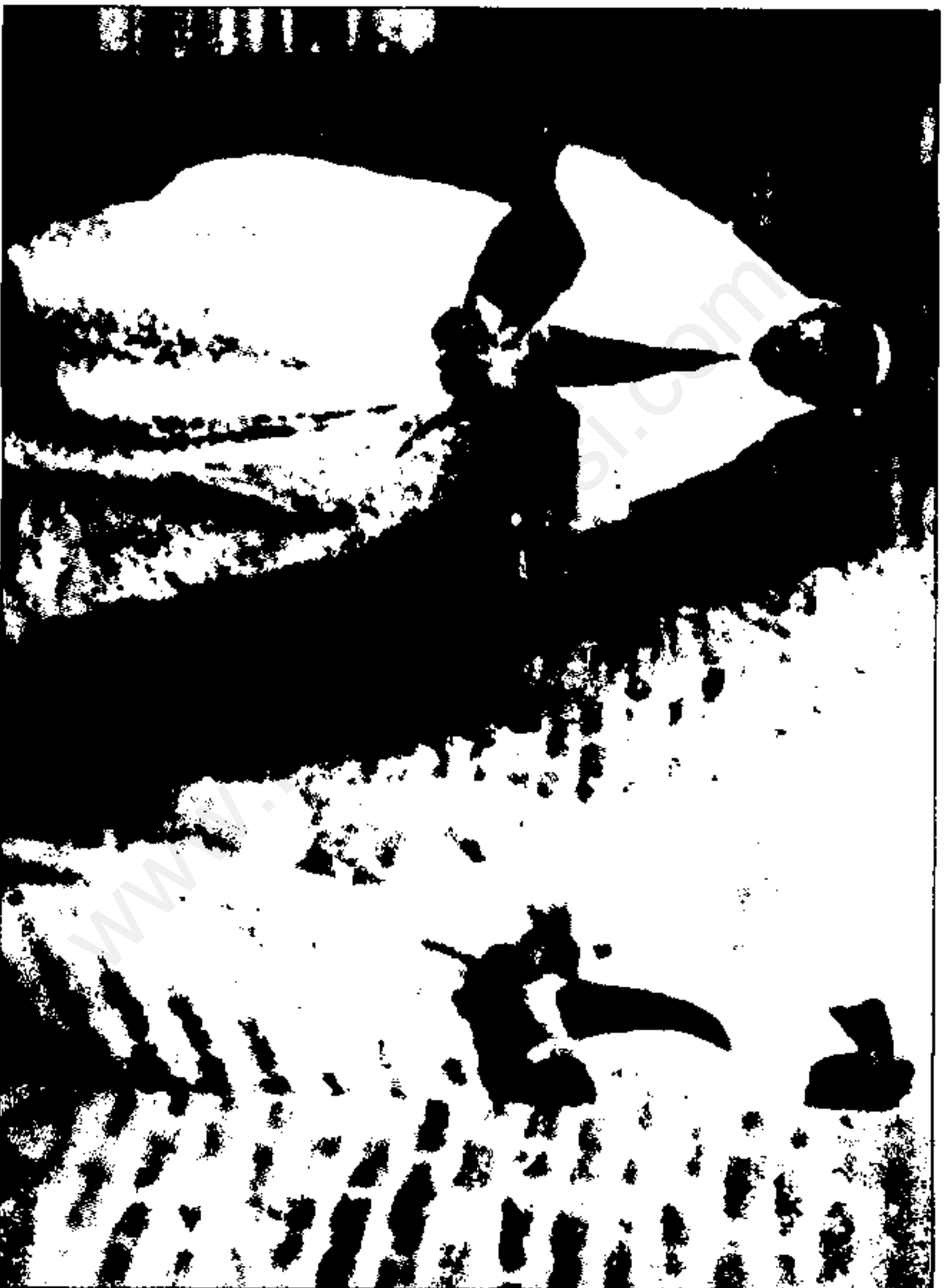
یکی از زنان ناصرالدین شاه (نام او را نمی دانیم)