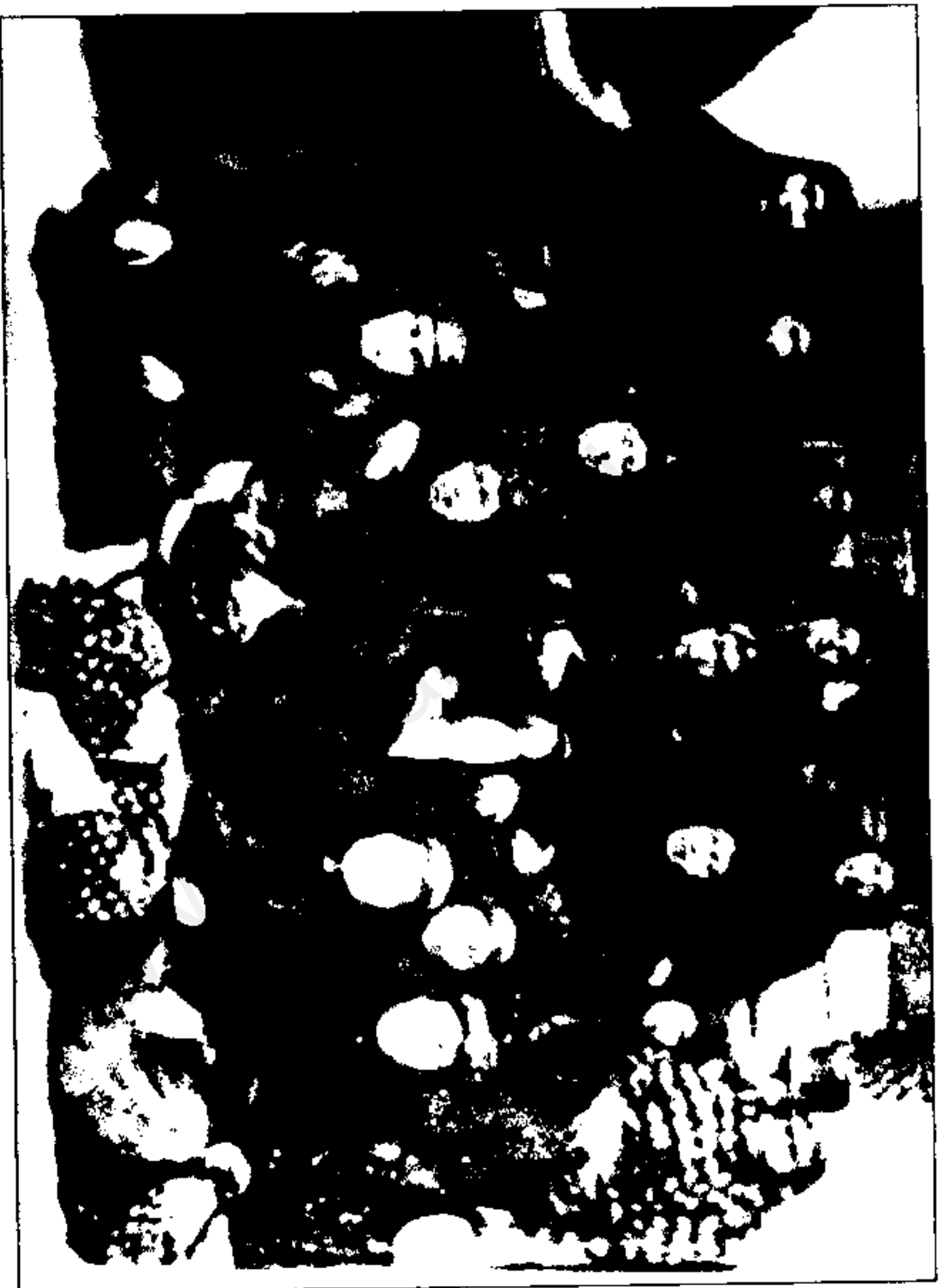
اینس الدوله در وسط عدهای از اصل حرم