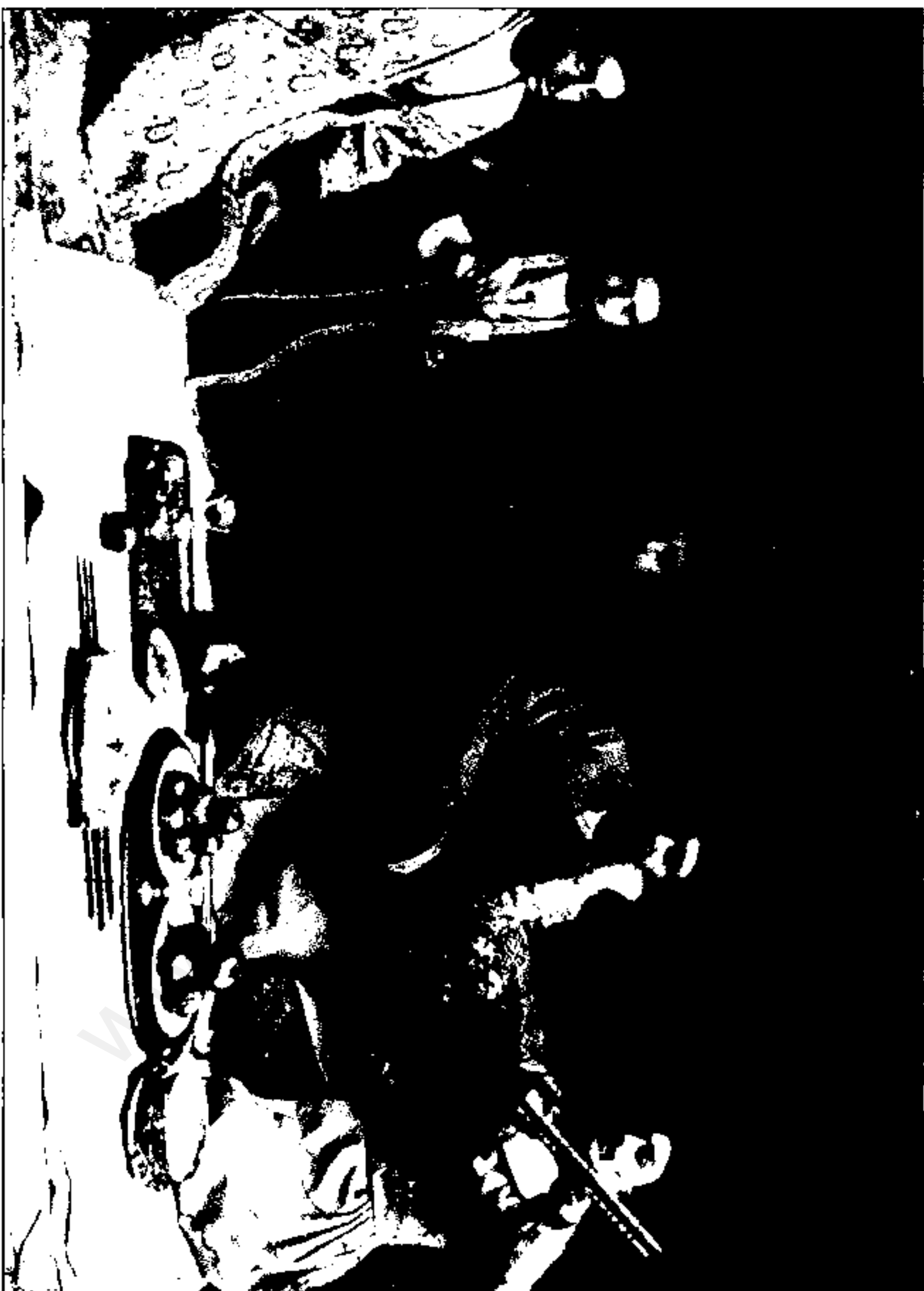
بک جیات ارکستز (دسته مطرب) آن زمان با تار و تنبک و دایره (دایره)