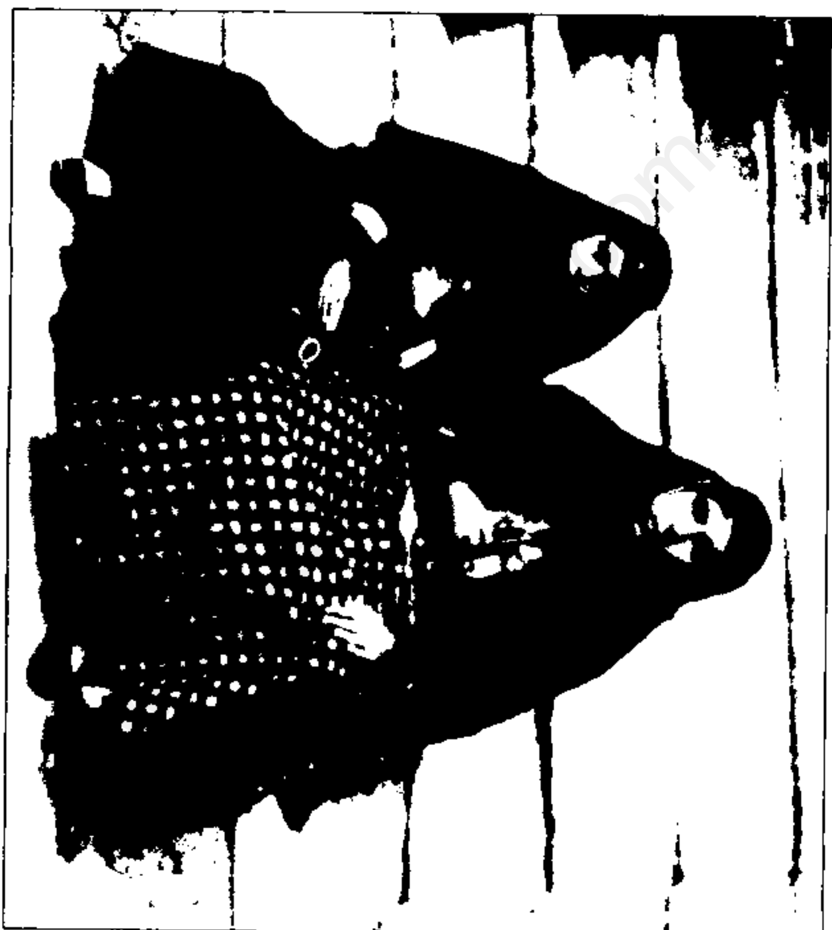
یکی از تازه واردان با خواهرش