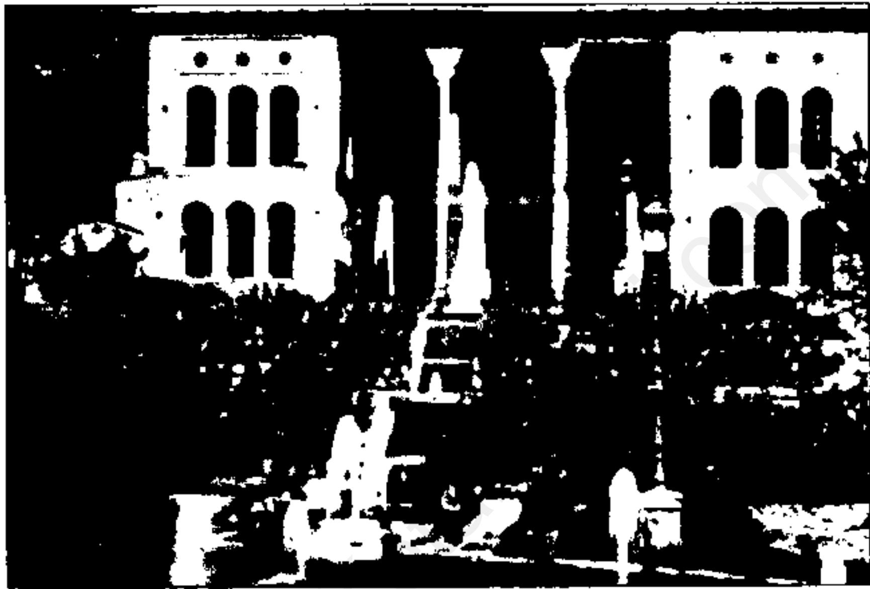
قصر سلطنتی شہرستانک - پناہگاہ ناصرالدین شاہ و حرم او در سالہای وبایی و مرگامرگی ناشی از بیماری های همه گیر. شیرازی کوچیکہ یکی از زنان مورد علاقتہ شاہ جلوی حوض آب ایستادہ است.