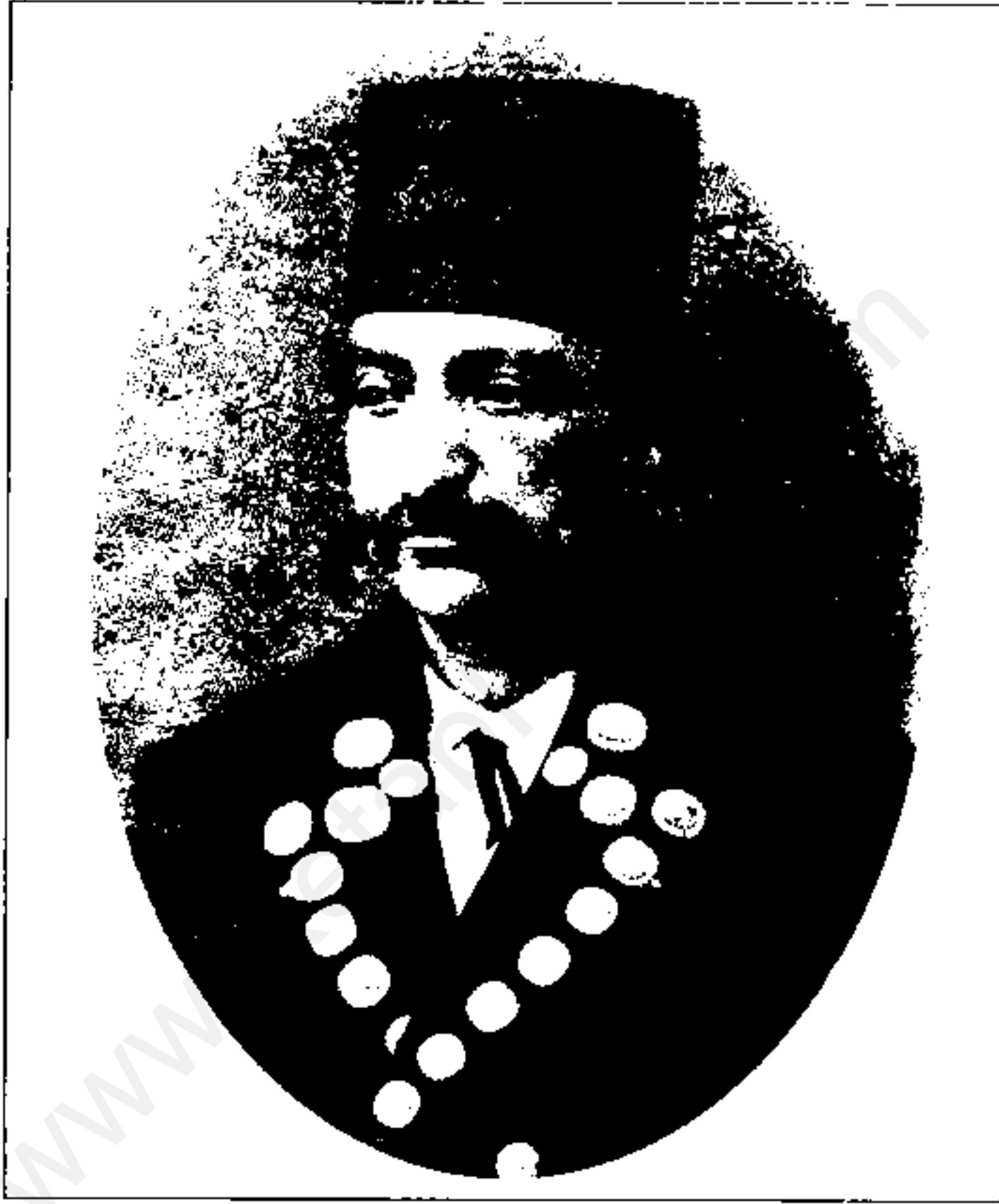
ناصر الدين شاه