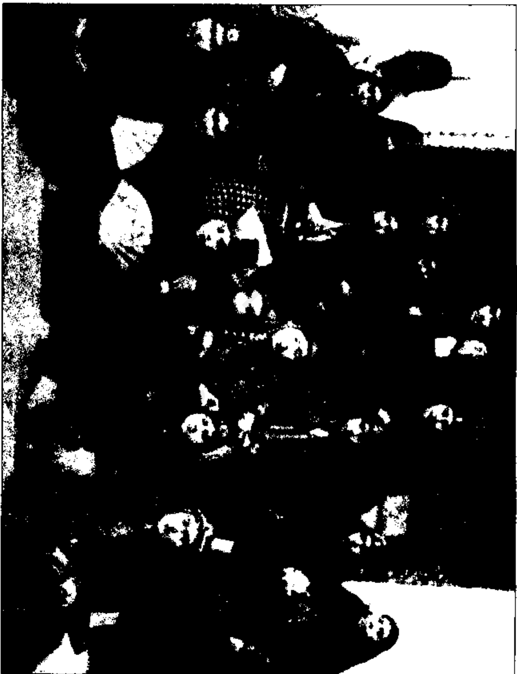
دختر خاله خانم