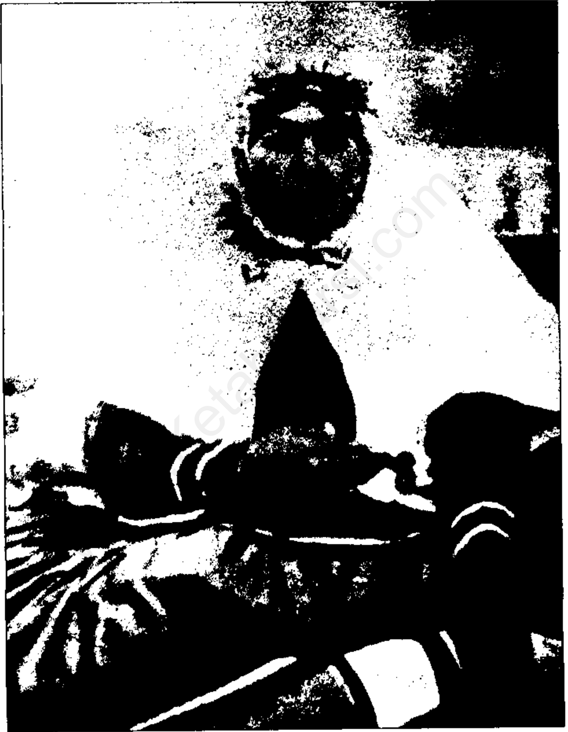
ابتدای کار انیس الدوله