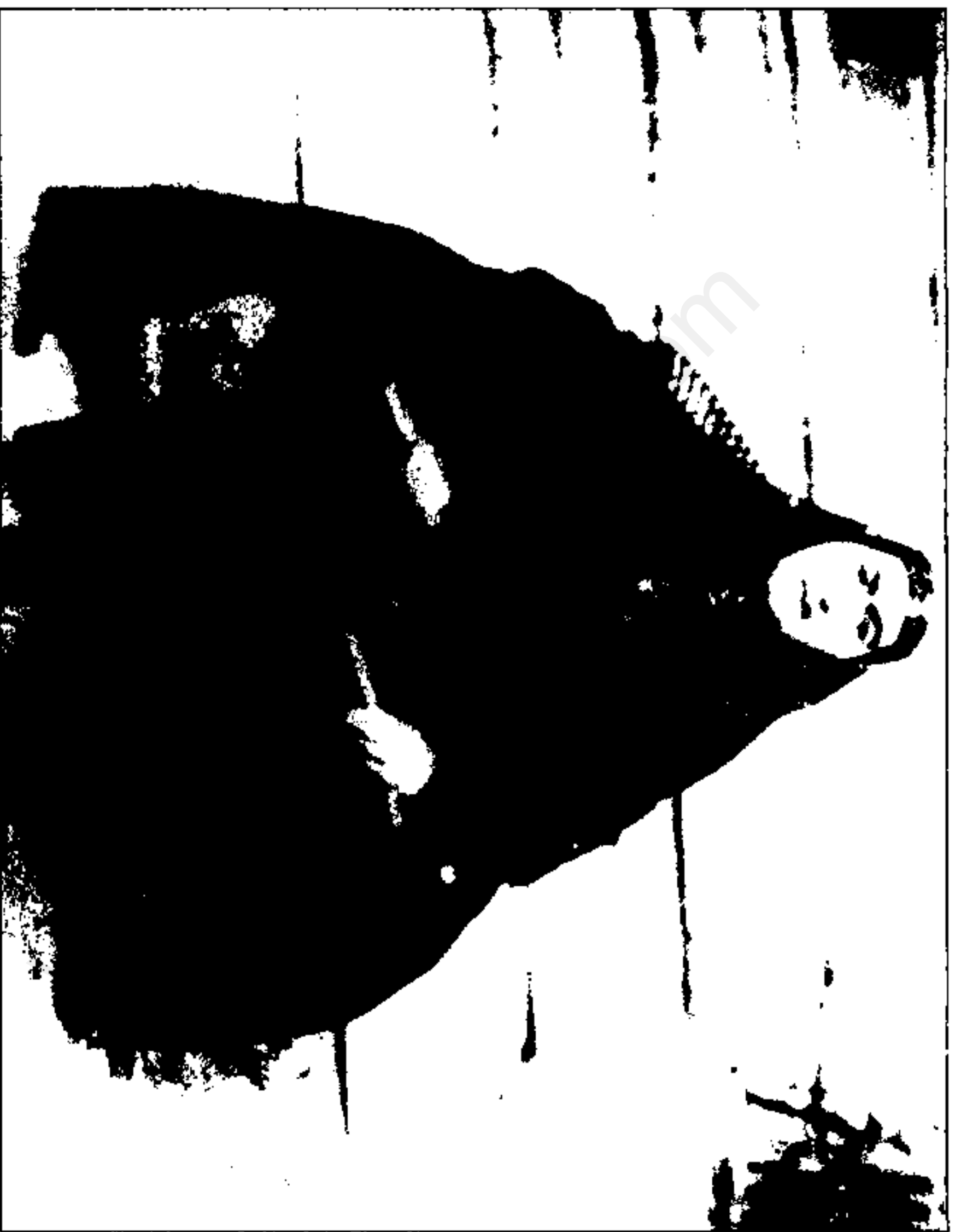
انيس الدوله در سالهاي مياني سلطنت ناصر الدين شاه