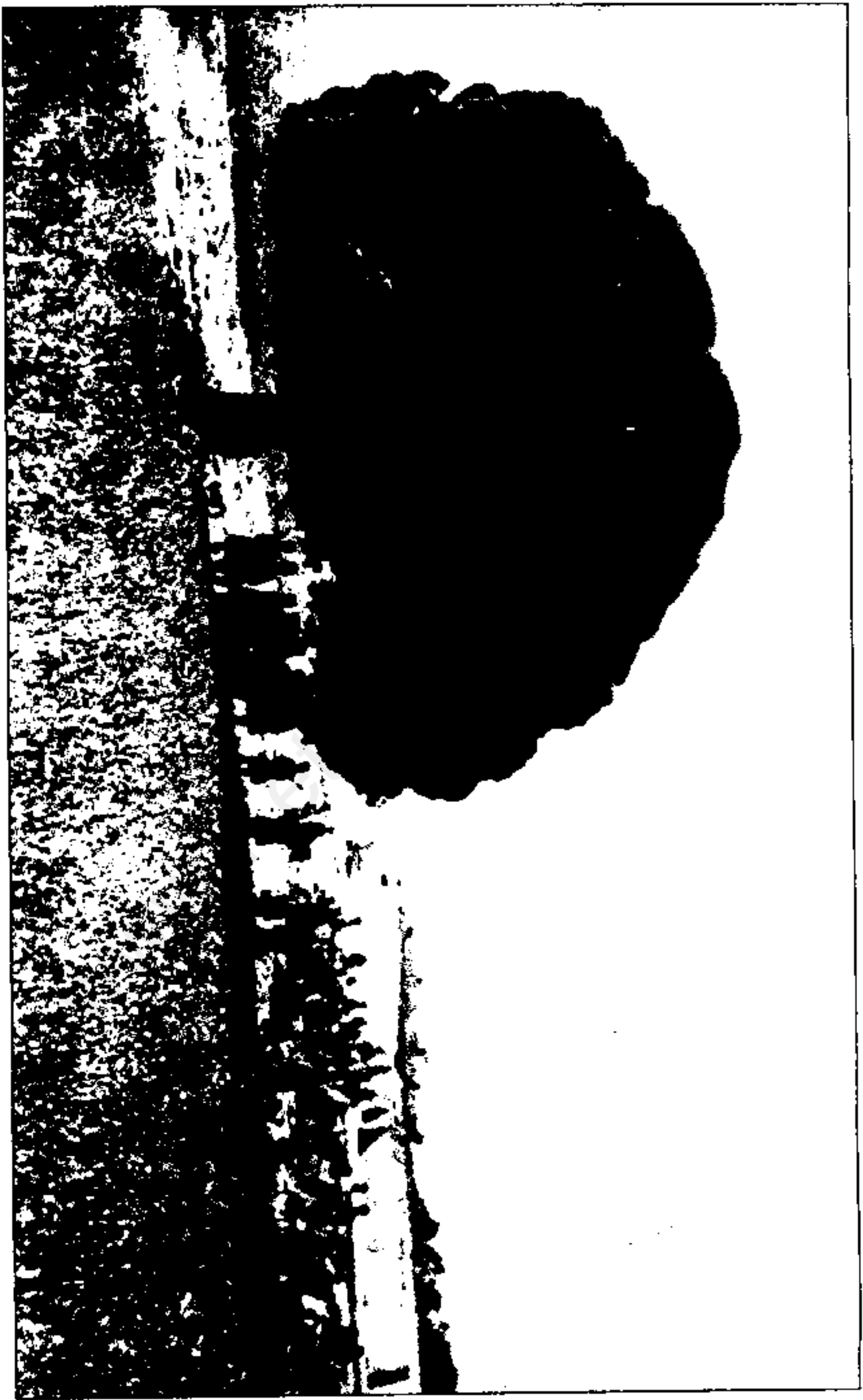
شاه در حال سفر