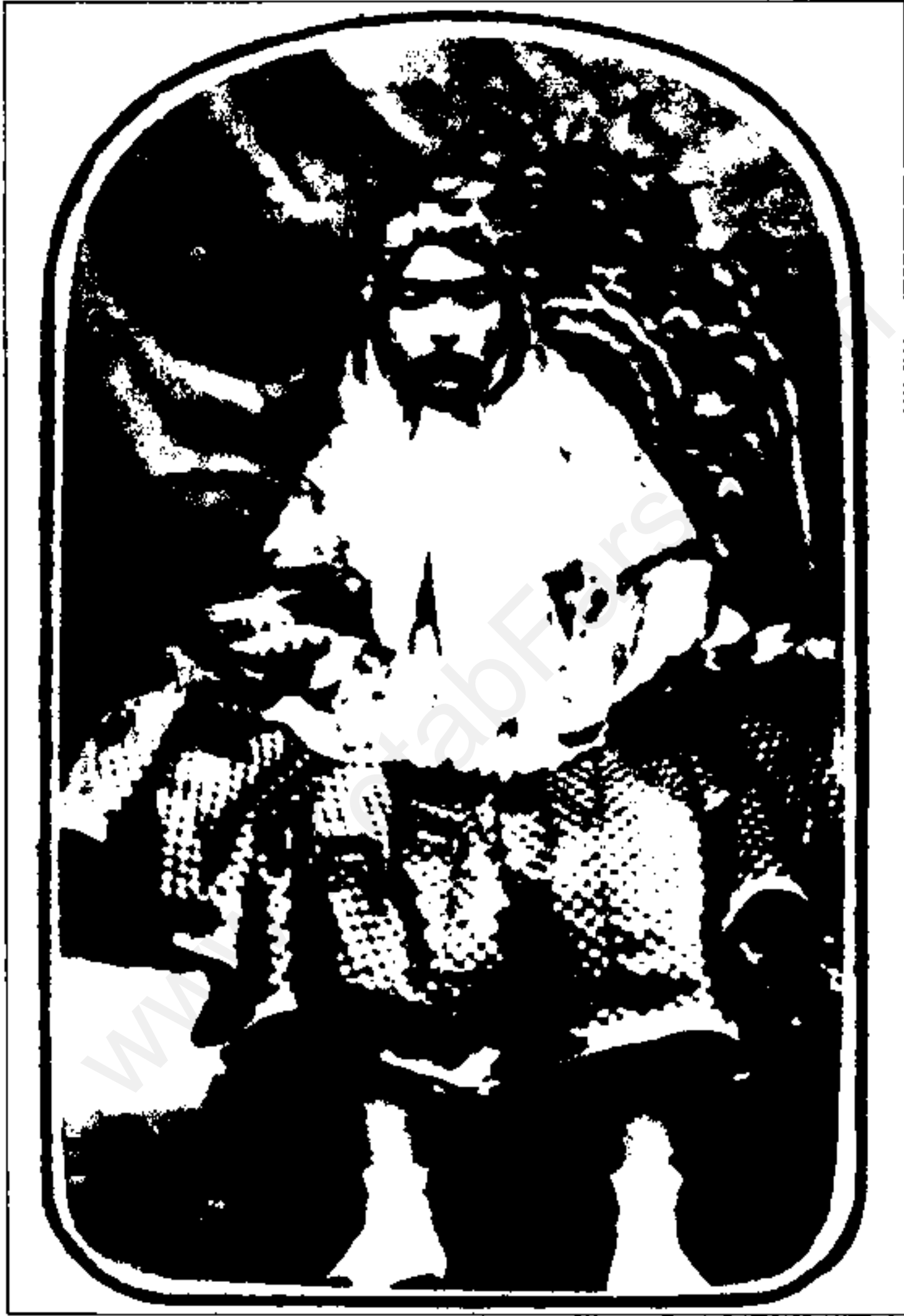
احتمالاً امين اقدس