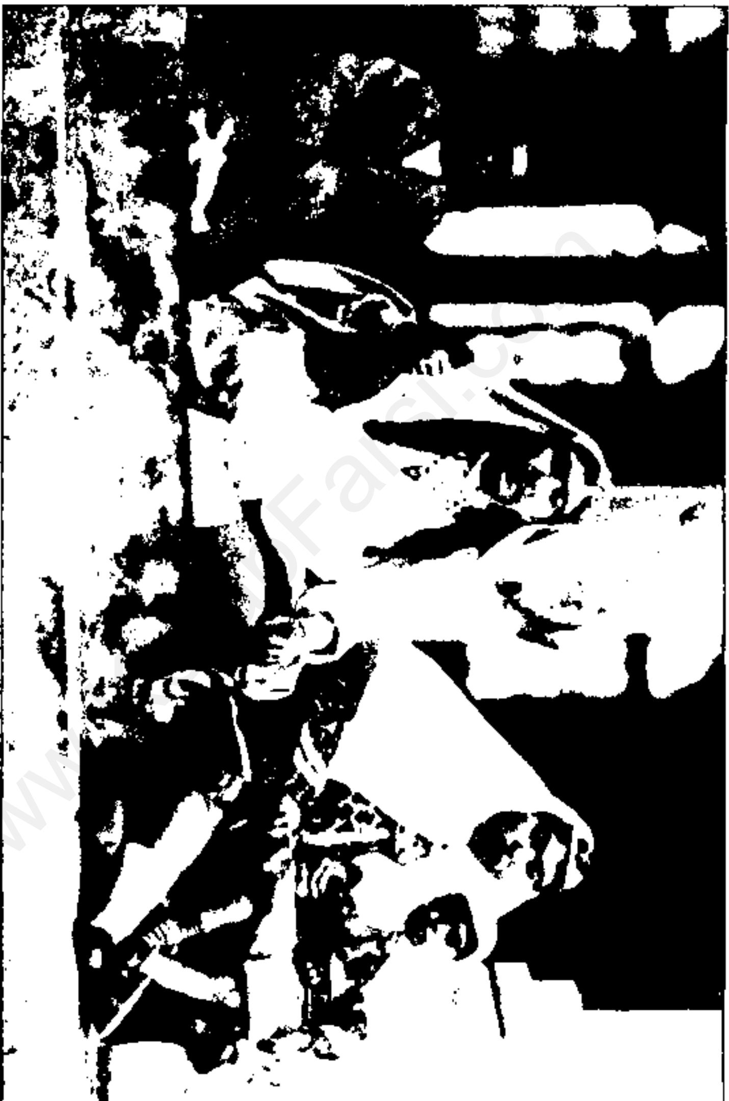
یکی از زنان سالخورده شاه - احتمالاً شکوه السلطنه مادر مظفرالدین میرزا