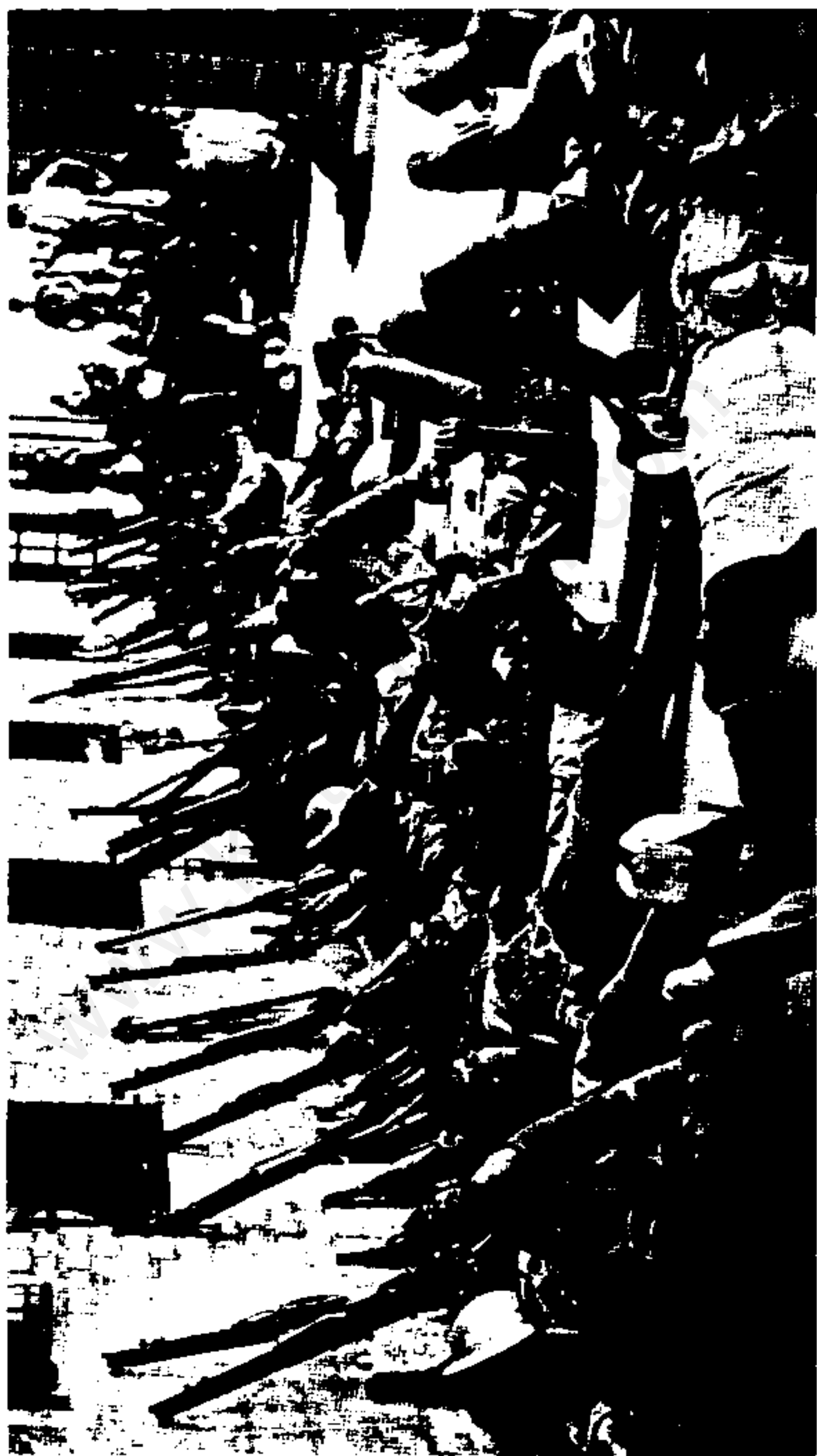
نیروهای متفکرین در ایران