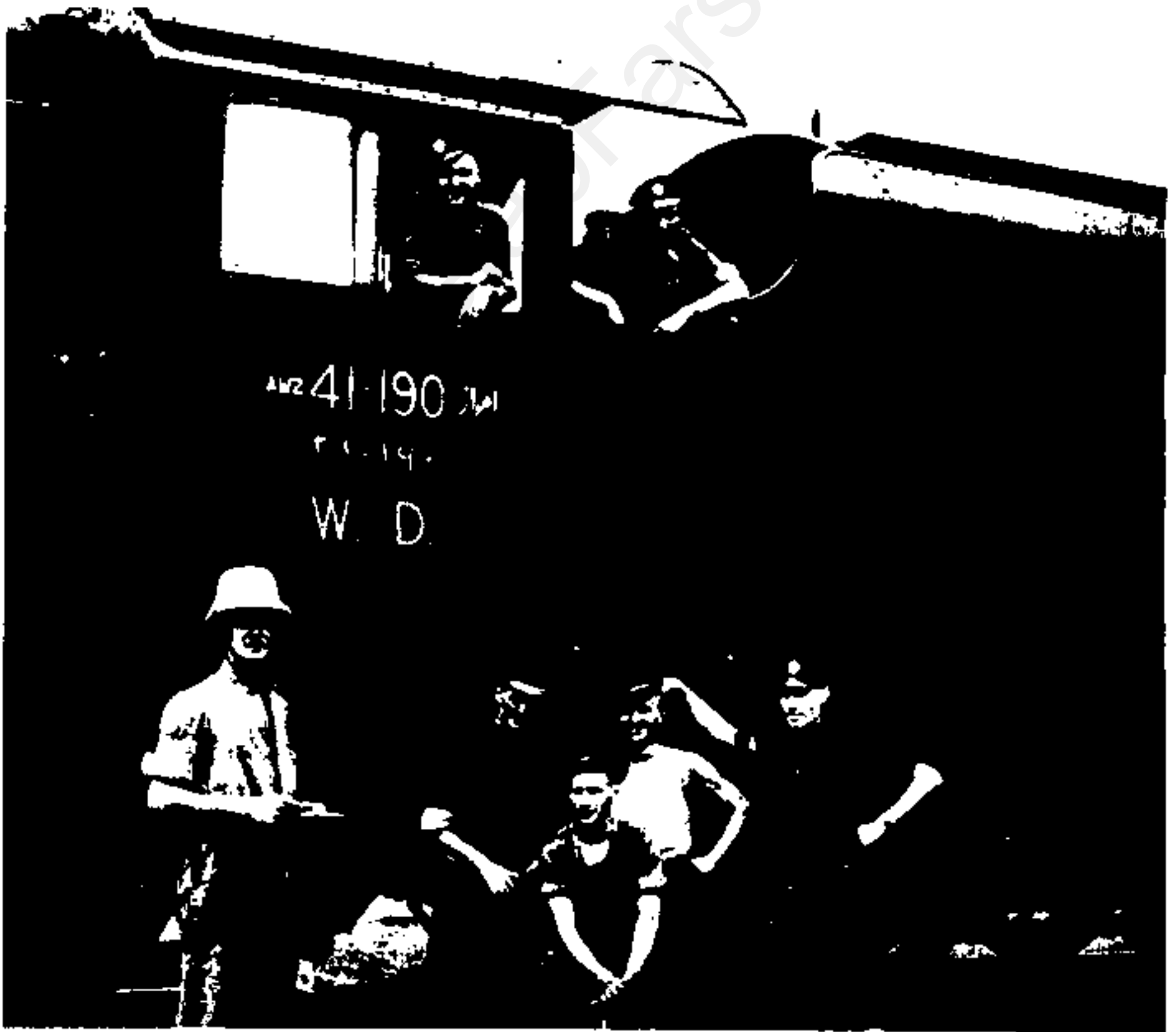
راه آهن ایران در روزهای پس از شهریور ۱۳۲۰