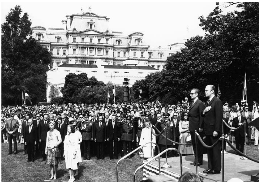
جرالد فورد رئیس جمهور آمریکا در حال خوش آمدگویی به محمدرضا پهلوی در محوطه کاخ سفید [ ۱۰۲-۱۱ع ]

شاه با اشتیاق فراوان شخصاً و با لباس سرفرماندهی نیروی دریایی ایران در مانورهای خلیج فارس و دریای عمان شرکت می‌کرد. ۱۵۸ وی در یک مصاحبه در سال ۱۳۵۴ش / ۱۹۷۵م اعلام کرد «نیروهای ما، در خلیج فارس اکنون ده برابر شده و بیست برابر نیرویی است که قبلاً بریتانیا در خلیج فارس داشت.» ۱۵۹ فرمانده نیروی هوایی فرانسه در دیدار خود از ایران، نیروی دریایی دولت شاهنشاهی را در ردیف بزرگ‌ترین ناوگانهای دریایی دانست. بدین ترتیب بودجه نیروی دریایی که در سالهای ۳۴۲-۴۷ش، ۳۴۳-۶۸م تنها ۵/۵ میلیون دلار بود در سالهای ۳۴۷-۵۲ش، ۳۴۸-۷۳ به ۵۵ میلیون دلار و بین سالهای ۳۵۲-۵۷، ۳۵۳-۷۸ به میزان ۱/۲۰۰ میلیون دلار افزایش یافت. ۱۶۰