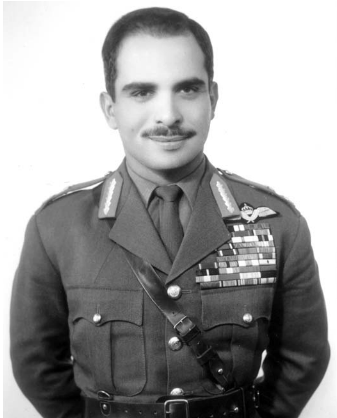
ملک حسین پادشاه اردن [ ۱۹۹۲-۱۱ع ]

تحمّل کنیم. کاملاً طبیعی است که چشمان خود را نسبت به هر جنبش جدایی طلب در کشور شما، خدای نکرده، نخواهیم بست. ۲۱۲