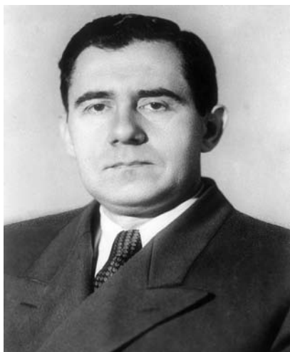
آندره گرومیووزیر امور خارجه شوروی [ ۴۳۵۹-۴ ]