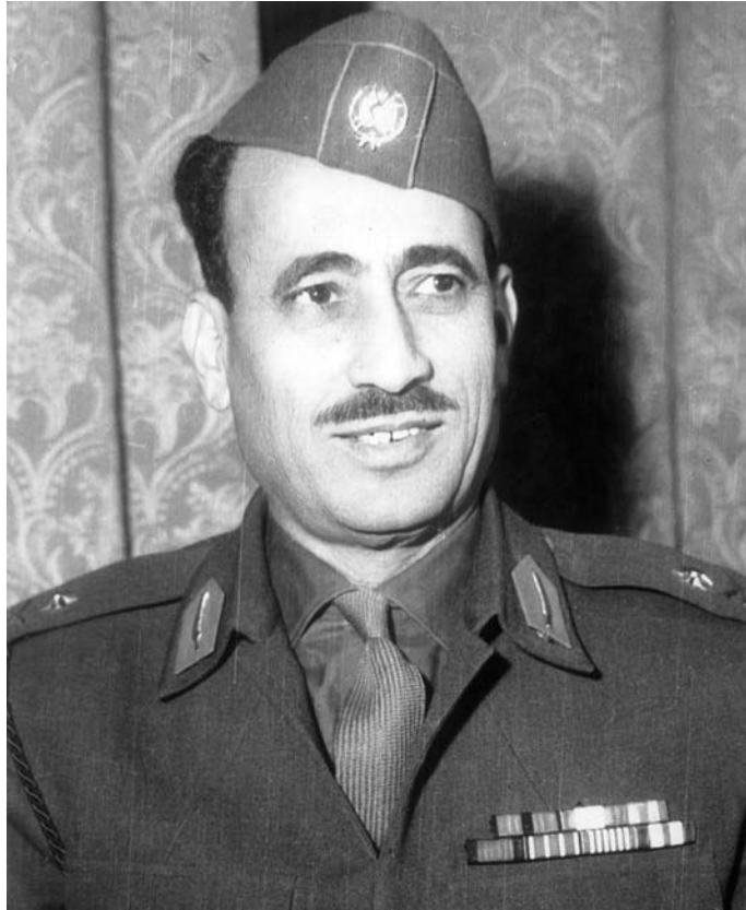
عبدالسلام عارف رئیس جمهور عراق [ ۲۶۳۷-۴۰ع ]

به دو میلیارد دلار تجهیزات نظامی خریداری نمود. مسکو تا سال ۱۹۷۱م ۵۰ فروند جنگنده میگ ۲۱، ۵۰ تا ۶۰ فروند هواپیمای پیشرفته سوخوی ۷، ۹۹ ۱۰۰ تا ۱۵۰ دستگاه، انواع تانک که بعدها به ۶۰۰ دستگاه افزایش یافت و بیش از ۳۰۰ خودروی نظامی و انواع توپ و موشک را در اختیار دولت بغداد گذارد. ۱۰۰