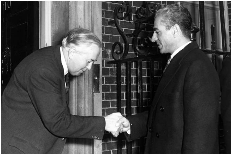
ملاقات محمدرضا پهلوی با هارولد ویلسون نخست‌وزیر انگلستان [ ۶۸۷-۱۲۱پ ]