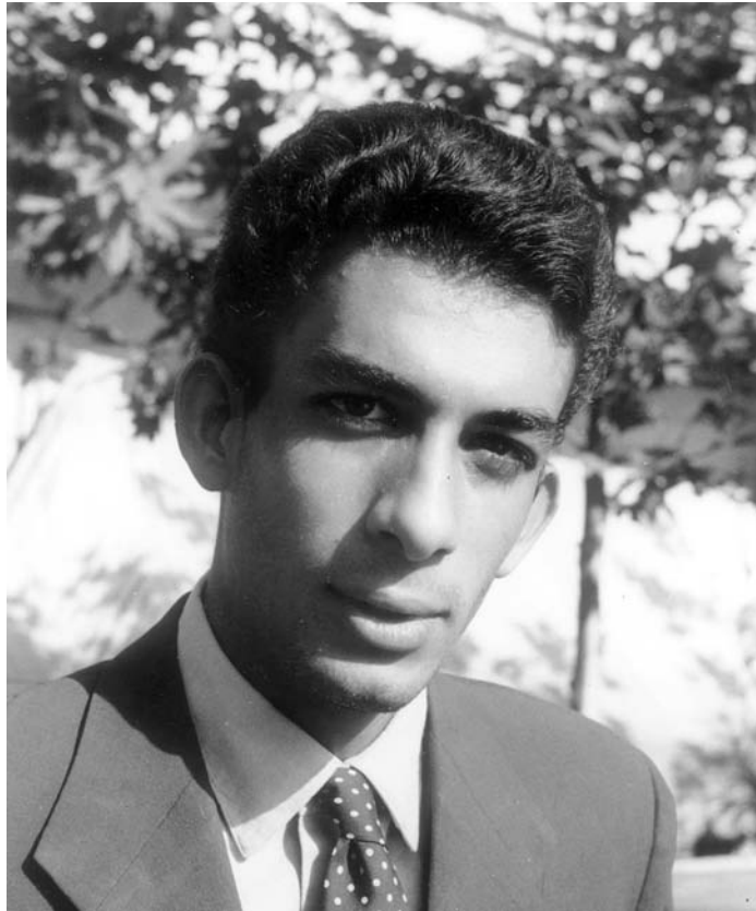
شهریار شفیق [ ۶۱۴۵-۶۵ ]

خریداری کرد. شاه هنگام سفر به لندن در تیر ۱۳۵۱ ش در پاسخ به سوال خبرنگاران در مورد خریدهای نظامی خود از انگلستان، گفت: «ما سراغ بهترینها می‌رویم، مثلاً چیفتن. ما دو نوع موشک از نوع تایگرکت و سی‌کت را از انگلستان خریدیم و اکنون موشکهای رایپر هدف ماست». ۱۸۳ فردریک مولی وزیر دفاع انگلستان در سفر خود به ایران در فروردین ۱۳۵۷ اعلام نمود که با همکاری لندن انواع موشکها و تانکهای پیشرفته در ایران ساخته خواهد شد. ۱۸۴ رادیو B.B.C نیز در اردیبهشت ۱۳۵۷ از مساعدت انگلستان برای تأسیس یک مجتمع بزرگ اسلحه‌سازی در اصفهان خبر داد. ۱۸۵