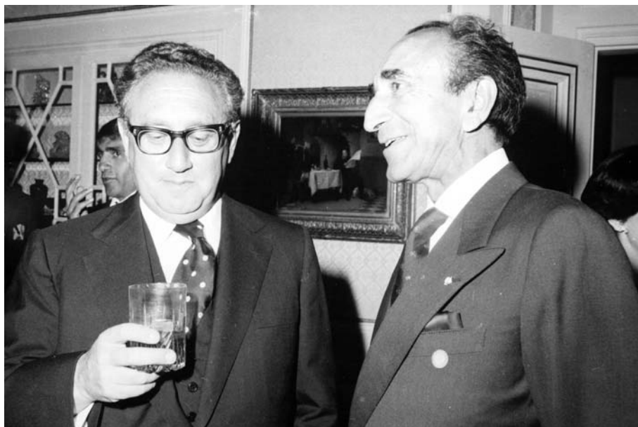
اسدالله علم و هنری کیسینجر وزیر امور خارجه آمریکا [ ۲۴۲۷-۱۱ ]