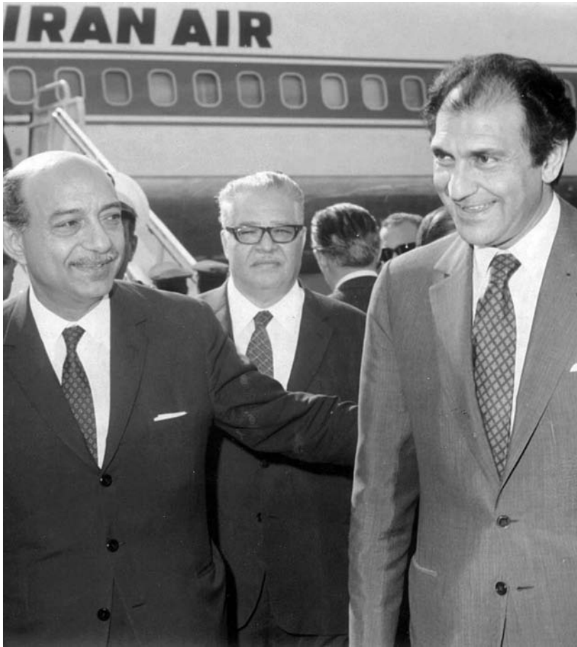
اردشیر زاهدی سفیر ایران در واشنگتن [ ۵۲۵۶-۶۴ ]

حمایت نظامی مستقیم شوروی بودند. دولت پهلوی در برابر عملکرد و تبلیغات جمال عبدالناصر، که شاه را نسبت به آرمانهای اعراب خیانتکار می دانست و سعی در گسترش فعالیت‌های خود در منطقه خلیج فارس داشت، جبهه‌گیری کرد. شاه در مصاحبه‌ای با روزنامه واشنگتن پست در ۷ تیرماه ۱۳۴۵ش / ۲۸ ژوئن ۱۹۶۶م گفت: «ایران در خلیج فارس باید آماده دفاع باشد چرا که جمال عبدالناصر می‌خواهد پس از تخلیه انگلستان از عدن نیروهای خود را به طرف شبه جزیره عربستان و شیخ‌نشینهای خلیج فارس بکشاند» ۸۴ همچنین در گفت‌وگویی با خبرگزاری آلمان در ۲۱ اردیبهشت ۱۳۴۶ش / ۱۱ آوریل ۱۹۶۷م تأکید کرد که «ایران حضور ناصر را در خلیج فارس تحمل