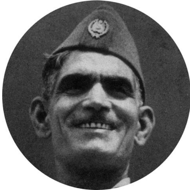
عبدالکریم قاسم رئیس جمهور عراق [ ۳۴۹۵-۴ ]

گسترش همکاری در جهت تقویت دفاعی یکدیگر ادامه خواهند داد. در ماه سپتامبر ۱۹۷۲ و در پایان دیدار احمد حسن البکر رئیس جمهوری عراق از شوروی اعلامیه مشترک دو کشور انتشار یافت. این اعلامیه حاکی از توافق در زمینه اقدامات ملموس به منظور تقویت بیشتر جنبه دفاعی عراق و افزایش آمادگی جنگی نیروهای مسلح آن بود. ۱۰۱