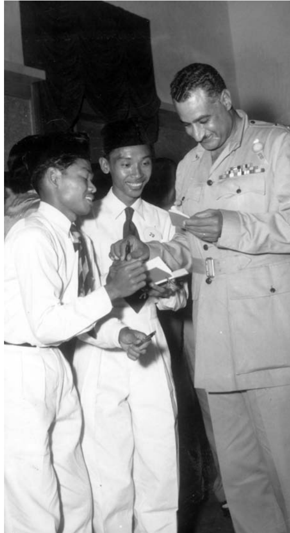
جمال عبدالناصر رئیس جمهور مصر [۱۹۵۴-۷۴ع]