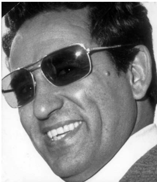
امیر حسین ربیعی فرمانده نیروی هوایی [ ۶۰۸۶-۶۵ ]

عمل می نمودند، دارای توانمندی زیادی بودند؛ چنانکه مرکز آموزش هوانیروز در اصفهان در زمینی به مساحت سه میلیون مترمربع به همراه ۲۵ دستگاه ساختمان فرعی تأسیس شد و فقط پارکینگ هلی کوپتری آن بیش از ۷۰/۰۰۰ مترمربع وسعت داشت. ۱۴۶ نیروی دریایی در سیاست خارجی و نظامی ایران نقش بسیار مهمی ایفا می کرد. براساس نظریات دولت شاهنشاهی، محدوده فعالیت امنیتی ایران از خلیج فارس فراتر بود و بخشهایی از آبهای دریای عمان و اقیانوس هند را نیز شامل می شد.