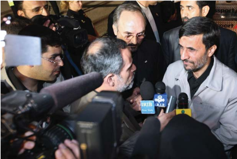
لحظه ورود به فرودگاه کنندی