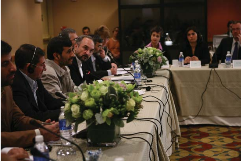
دیدار بامدیران رسانه‌های امریکا