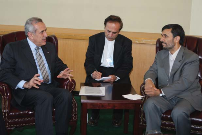
دیدار با رئیس جمهور لبنان