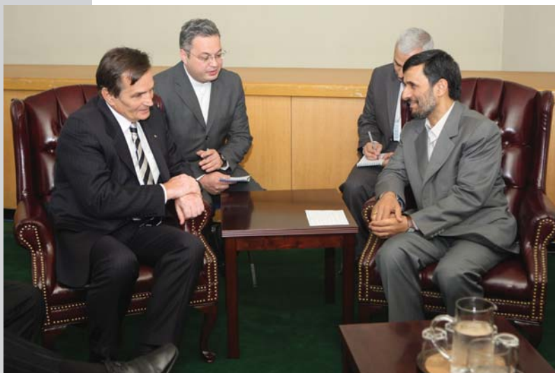
دیدار با رئیس جمهور یوسنی