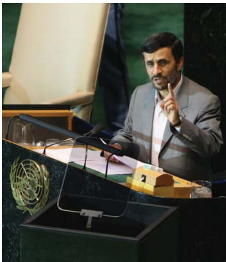
سخنرانی در سازمان ملل