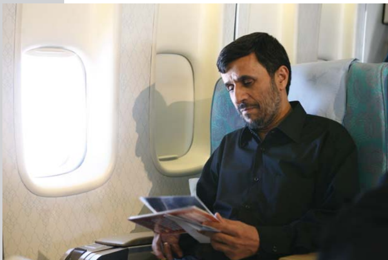
رئیس جمهور در هواپیما