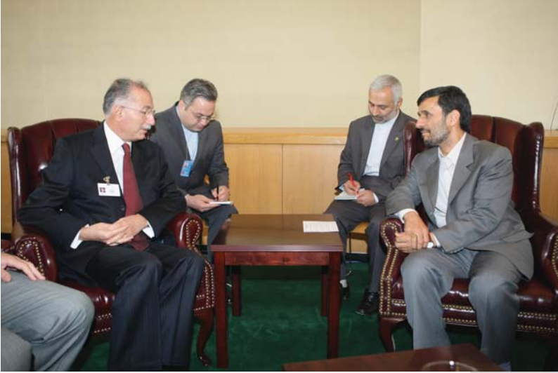
دیدار با دبیرکل سازمان کنفرانس اسلامی