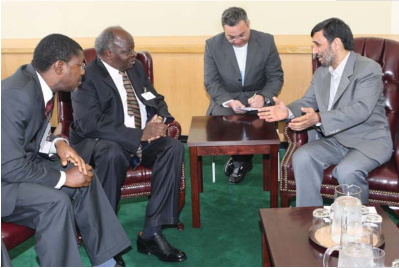
دیدار با رئیس جمهور کنیا