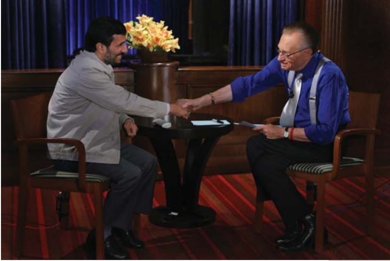
گفتگو با شبکه CNN