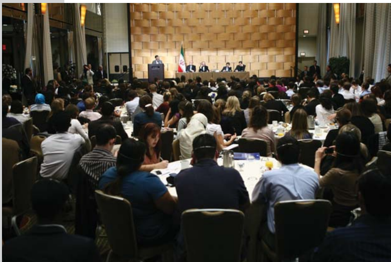
دیدار با دانشجویان دانشگاههای امریکا