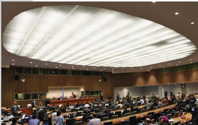
کنفرانس خبری در سازمان ملل