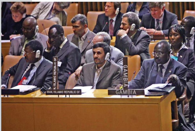
اجلاس توسعه آفریقا