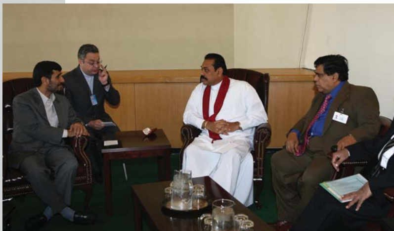
دیدار با رئیس جمهور سریلانکا