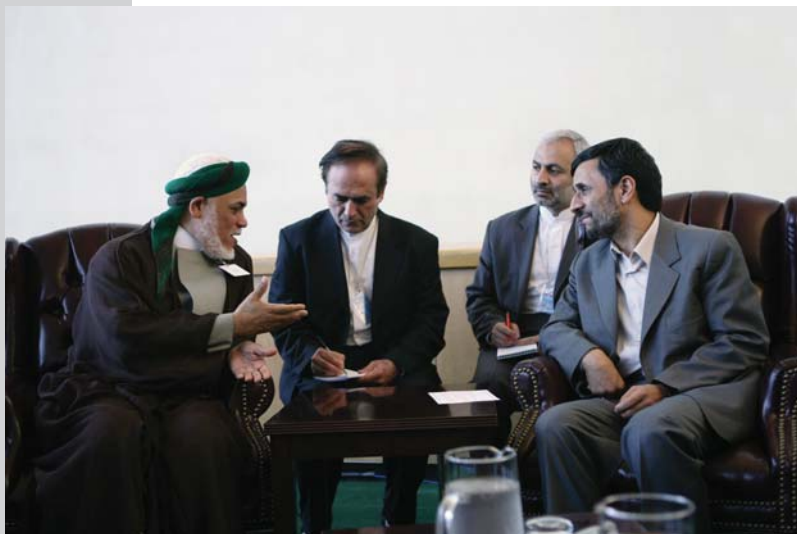
دیدار با رئیس جمهور کومور