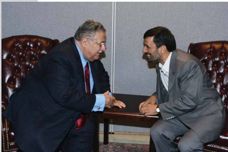
دیدار با رئیس جمهور عراق