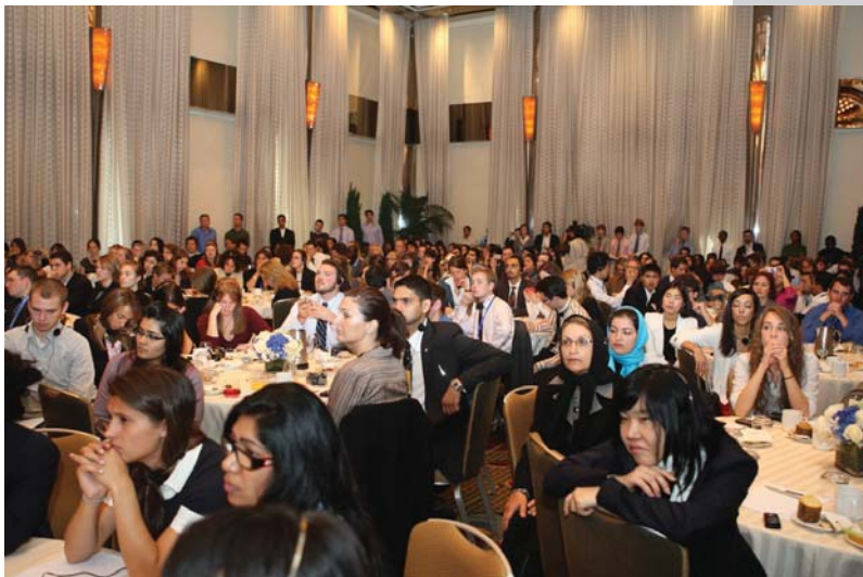
دیدار با دانشجویان دانشگاههای امریکا