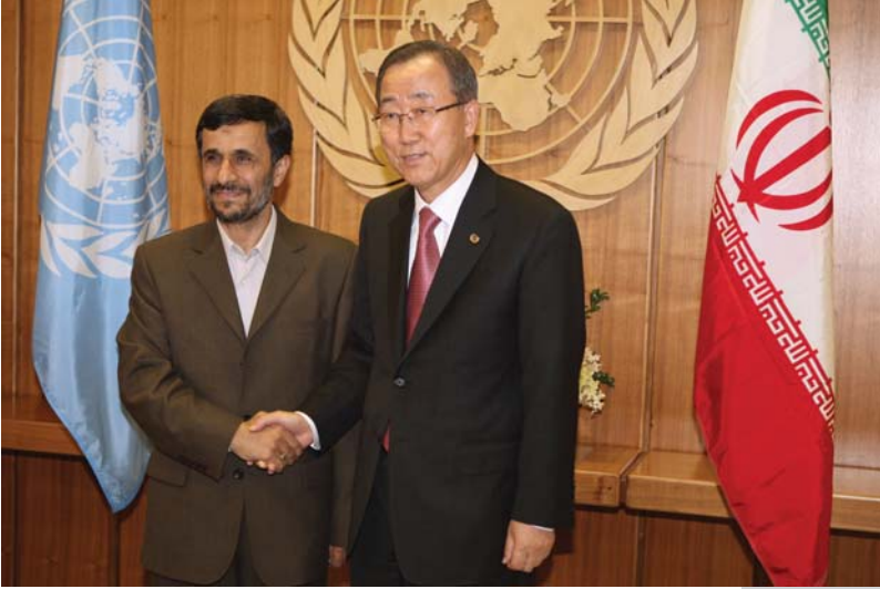
دیدار با بان کی مون ( دبیرکل سازمان ملل )