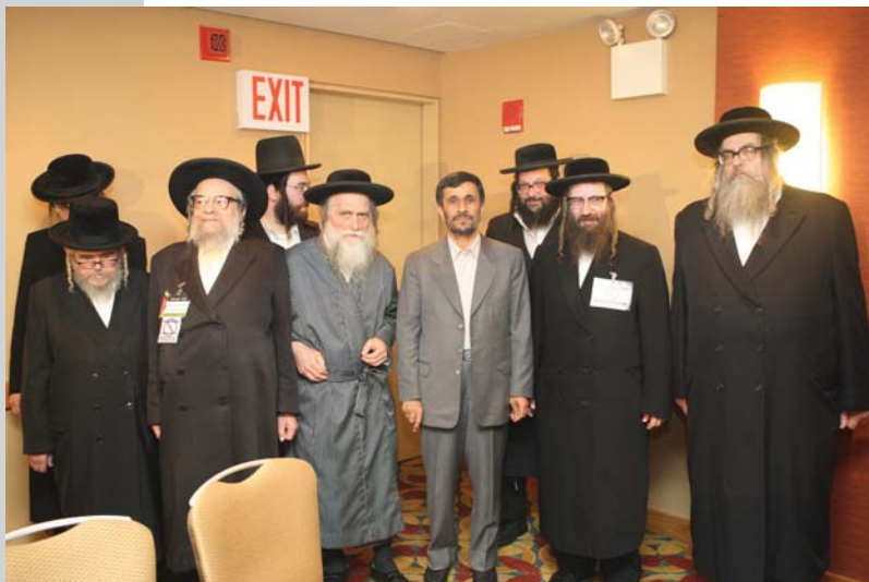
دیدار با خاخامهای ضد صهیونیسم