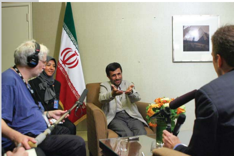
گفتگو با رادیو NPR