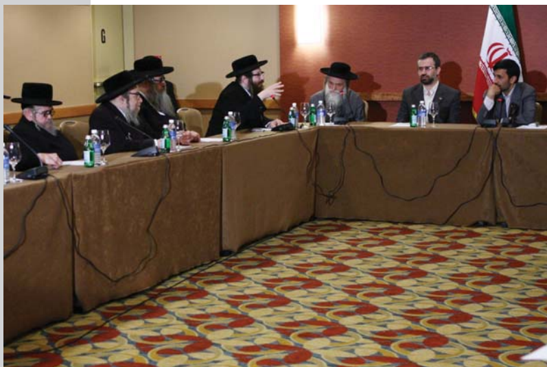
دیدار با یهودیان مخالف صهیونیسم