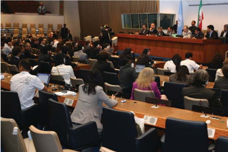
کنفرانس خبری در سازمان ملل