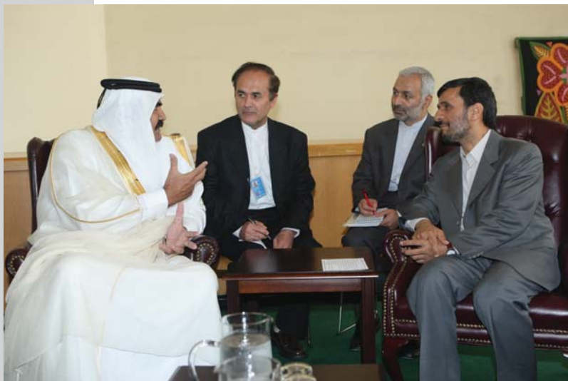
دیدار با امیر قطر