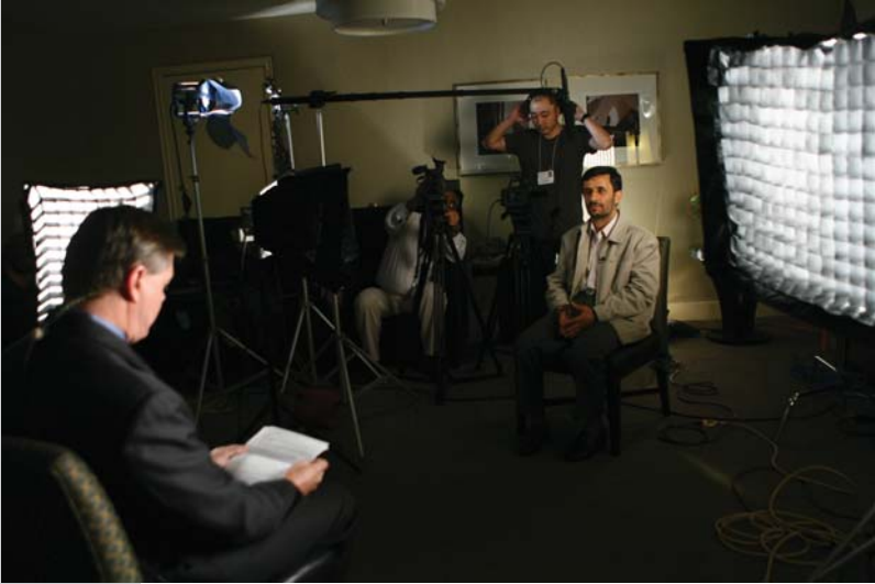
گفتگو با شبکه CBS