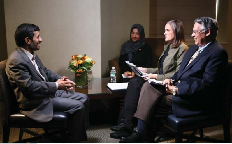
گفتگو با شبکه پسیفیکا (برنامه دموکراسی اکنون)