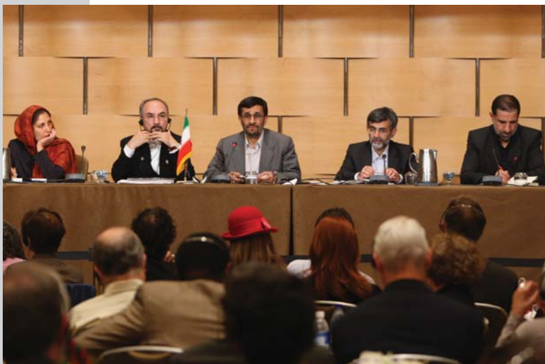
دیدار با گروههای طرفدار صلح