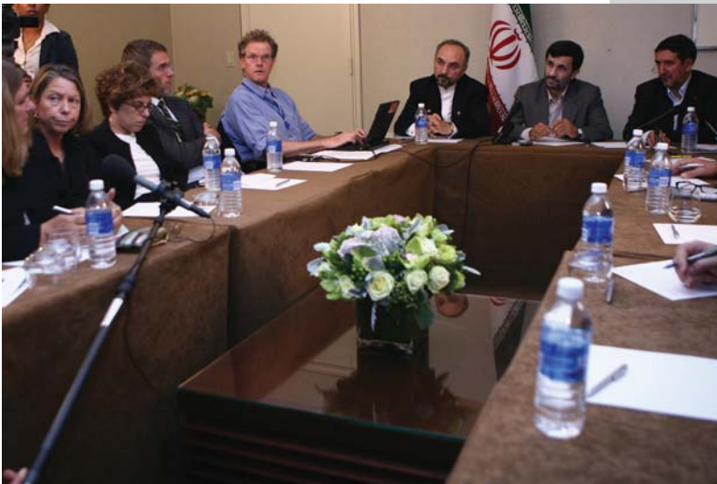
گفتگو با نیویورک تایمز