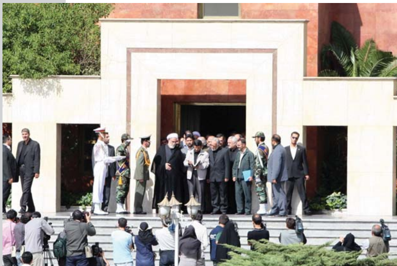
مراسم بدرقه رئیس جمهور از سوی رئیس محترم دفتر مقام معظم رهبری و دیگر مقامات کشوری