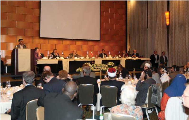
دیدار با نمایندگان ادیان الهی