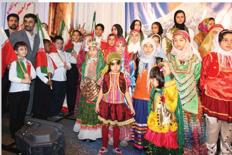
گروه سرود/ دیدار رئیس جمهور با ایرانیان