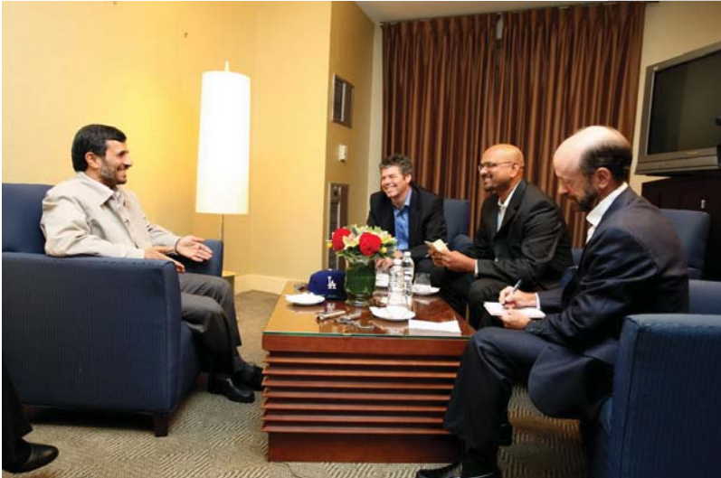
گفتگو با لس آنجلس تایمز