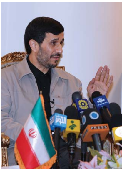
رئیس جمهور در بازگشت (گفتگو با خبرنگاران)