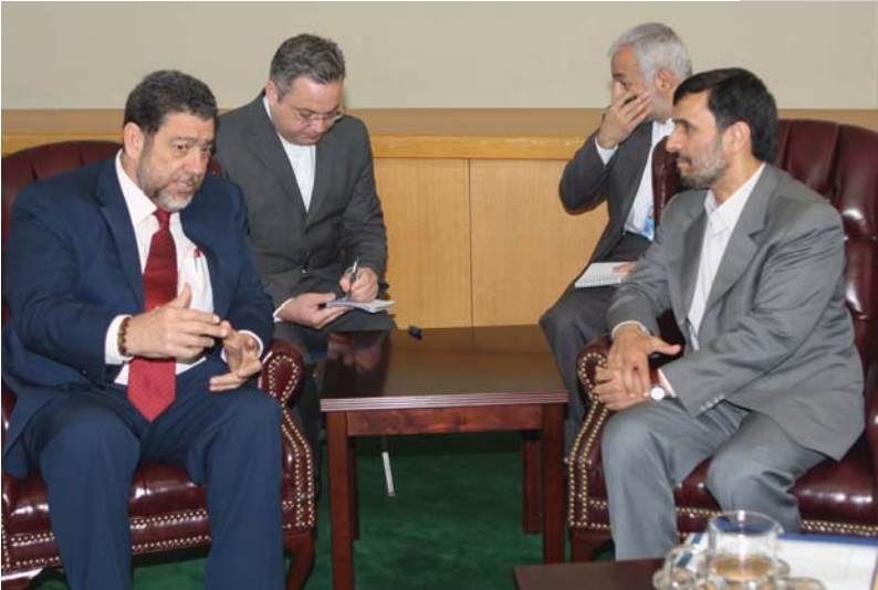
دیدار با رئیس جمهور وینسنت گرنادیس