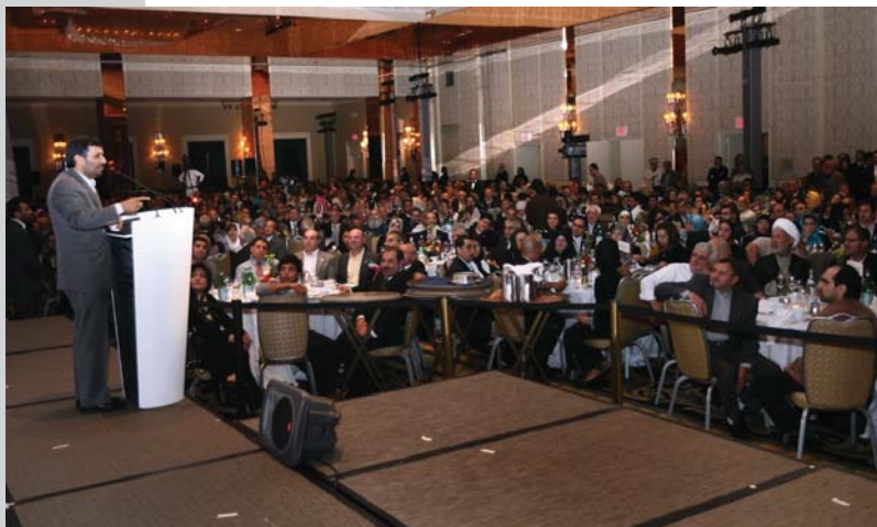
دیدار با ایرانیان