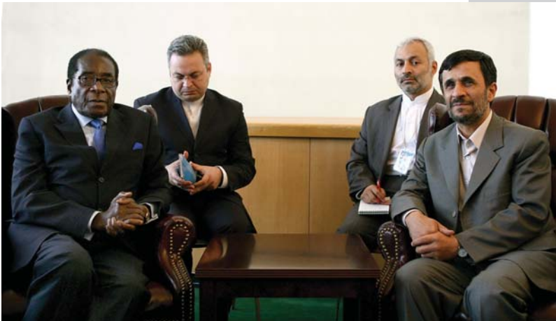
دیدار با رئیس جمهور زیمبابوه