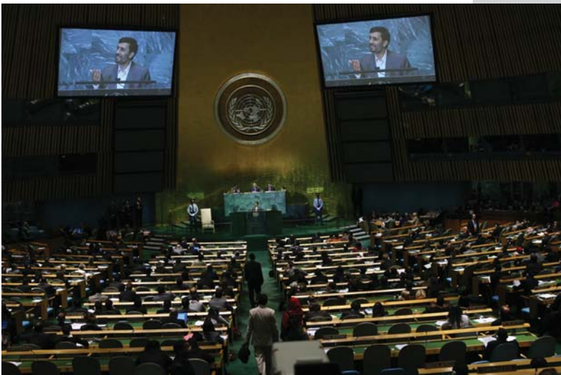
سخنرانی در سازمان ملل