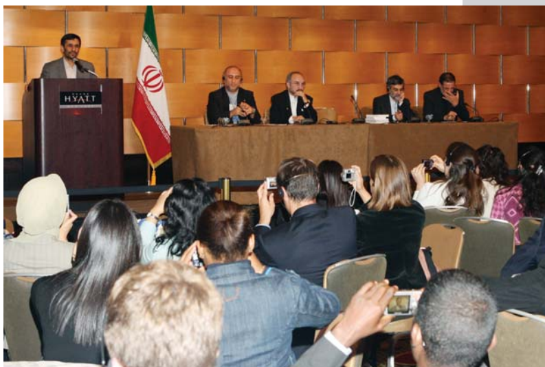
دیدار با دانشجویان دانشگاههای امریکا