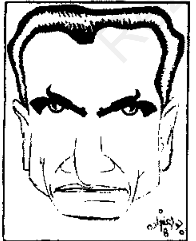
در آن زمان مسائل انبارگر امریکا و دولت امریکا با تمام مسائل شاه با سرگورما وتضیقات پتری هرکوبچینی ریحالی پشی طی ایران امریکا و تسویل مییود. آیا برنگونی رژیم استبداد شاه را نایبدهای نقل کردند.