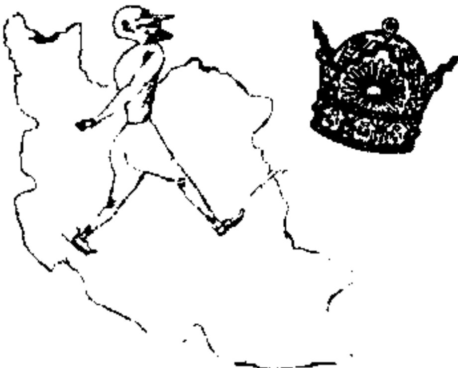
و نفسی بدرا

مخبرین آدم جیبی شد از سپهر خود مصروف نماند و نفسی بهت آنچنان بارور شد بود که با وقوع این زلزله حتی در ارکان آن وزرد میزدند - هستی از شکافه نفسی که پستان و روع این زلزله بین خلاصاتی و افری صورت گرفته بود حیا نوشنوازه ضبط شناسیت طرح ریواست افری - اظہیرت شاه - طه افری - مادانی من برای خدا وقت خبر خوب دارم ، و بگزم شاه - پپا این خبر ، منی افری - زلزله اوصسد ، طبیی باحد یگان شد ، شاه با دعوت این که بزمه بخارم ، افری - چرا بزمه بخارم مادانی - گفتن اخبار برده که جو مدعنا و جو کورسنا