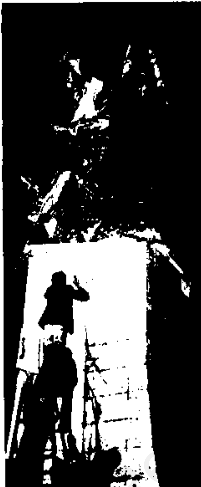
۲۸ مرداد تکرار نمیشود - کوه لای ۲۸ مرداد ۱۳۳۲ سر آغاز مهرانی است که امروز انقلاب مردم در کل ایران مآلین به آن است. به نشانه این روزی، دیروز صبح ۲۸ مرداد در میدان مشرف مردم که پلاکین کفیه شده، مردم هنگام پلکان کشیدن این مجسمه فریاد میزدند: ۲۸ مرداد تکرار نمیشود.