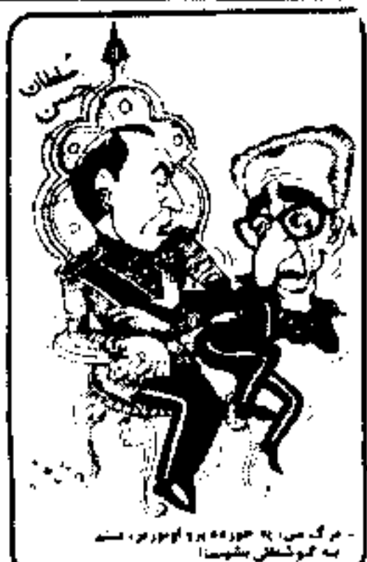
برگ ص: ۱۰۰ خورده در ۱۰۰ روز - است به گوشه‌های بنشیند

کنگره ملی افریقای جنوبی حمایت کامل خود را از انقلاب ایران که مهم تصمیمات در جواران خلق های شده دیده شده است - آمریکا گرامی و زنده بوسی و جمهوری و بوسه مبارزه مردم افریقای جنوبی علیه اباراید و فاشیسم و از طریق قطع بنسبات دیپلماتیک و تجاری با رژیم صلی و سنگر حاکم بر کشور داشته است اعلام می‌دارد - از مردم پیشرو - دمکرات و ضد آمریکالیست برادر جهان جهانگشیم خوشبختی بکفر خاد و برای خلی کردن برانه های آمریکالیسم بین‌المللی تحت نظارت