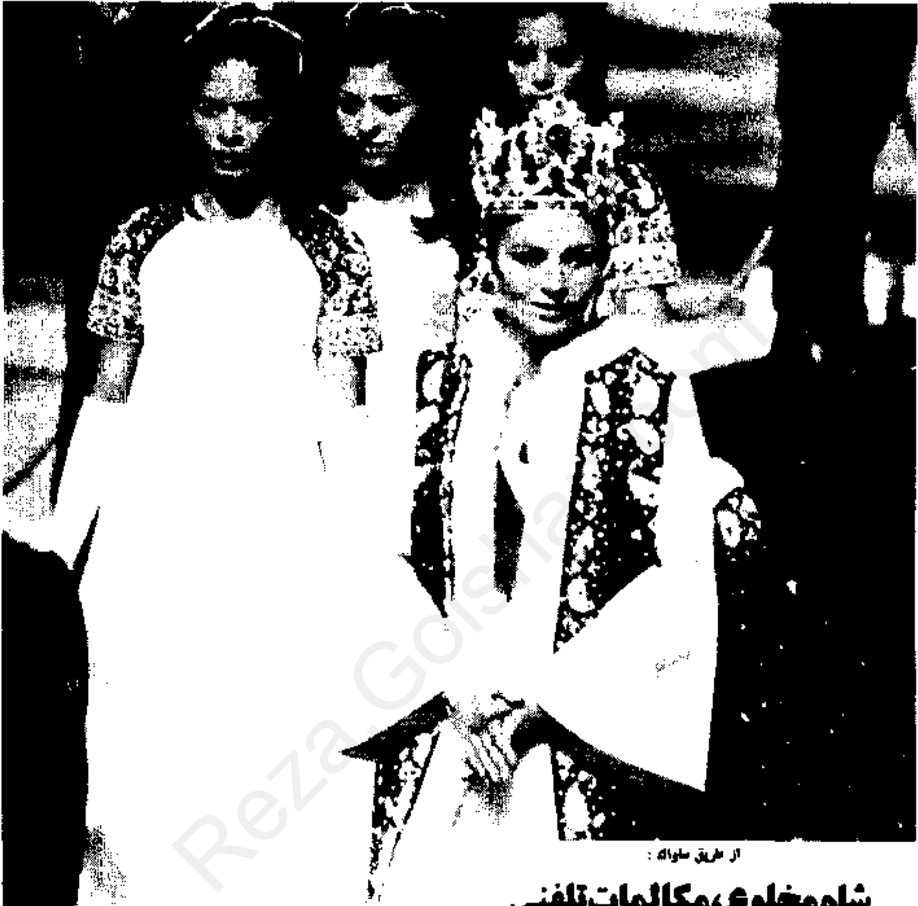
از طریق ساوانه :