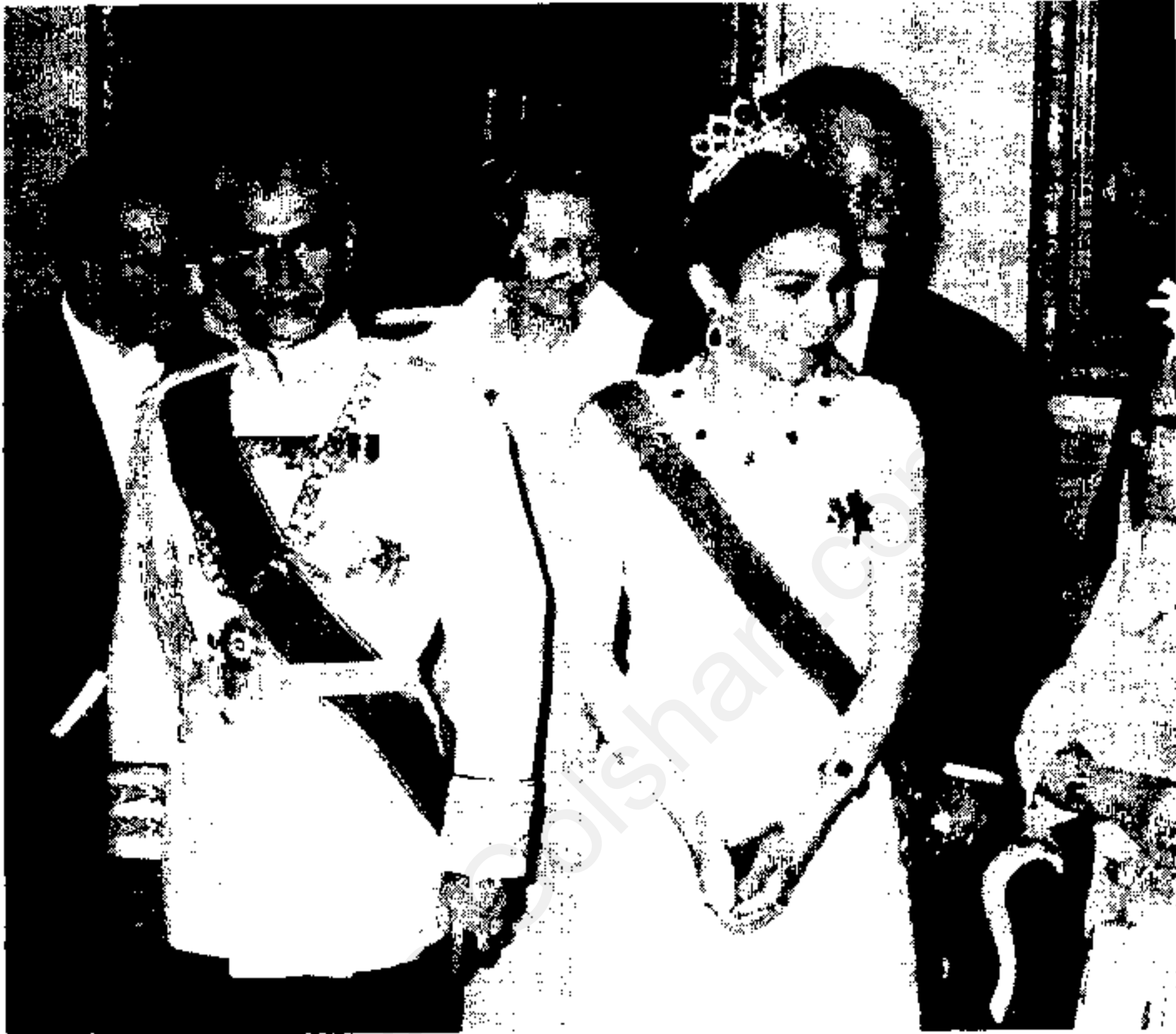
برای اظهار نظر امام خمینی