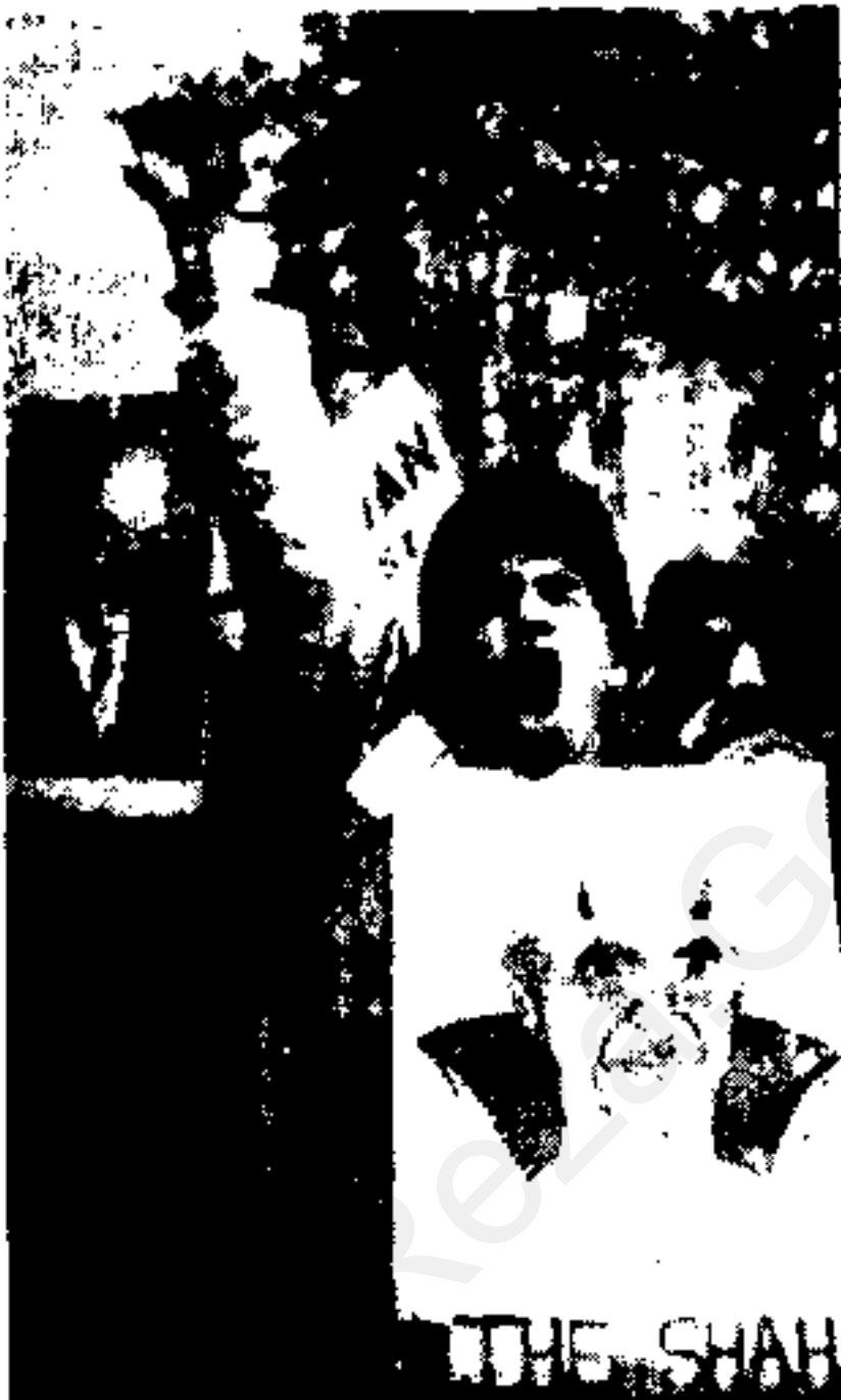
تعداد روزی شاه مخلوع به آمریکا نظهرات دانشجویان در نظهرات نظهرات کوریا، چهل بسزی شد شاه مخلوع هر روز شاه مخلوع به نظهرات مرگ بر شاه، شهر نیویورک در فراتر از این، تنس کوتخای از نظهرات علیه شاه مخلوع (بکس از رادیو فونوی کوهان)