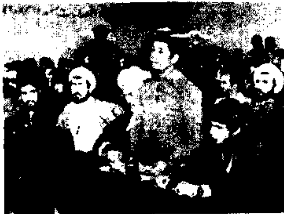
در جریان رسیدگی به پرونده سر باز محکوم به اعدام به قیم ارسال شد

پرونده سر باز محکوم به اعدام به قیم ارسال شد