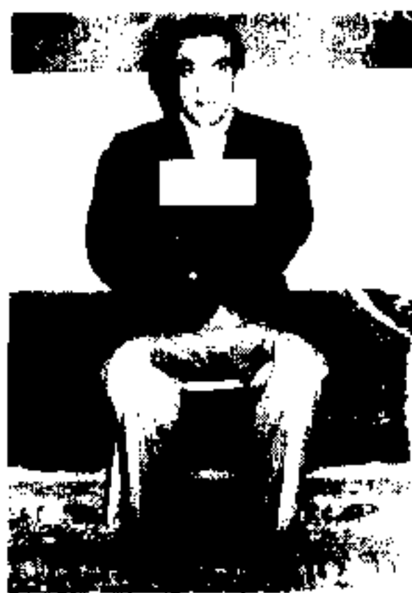
سپهبد عبدالله خواجه نوری