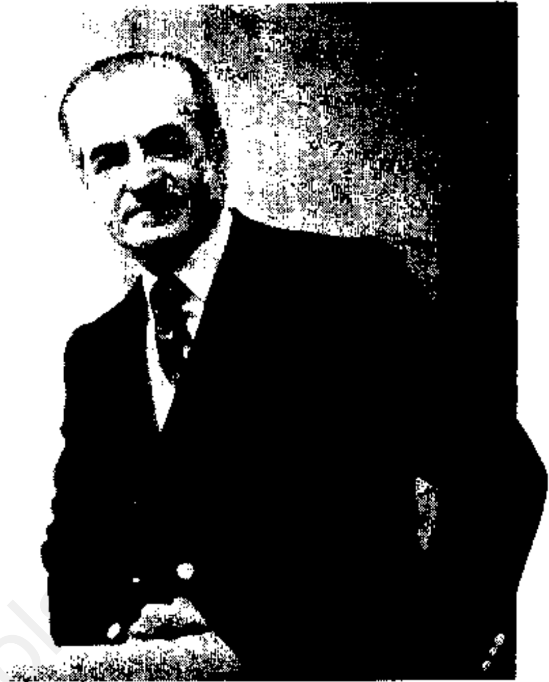
متر اطلاع رسمی وزارت خارجه در تهران امروز

پاناما مستظرا سال مذاکره ایران به منظور محاکمه برای استرداد شاه مخلوع است