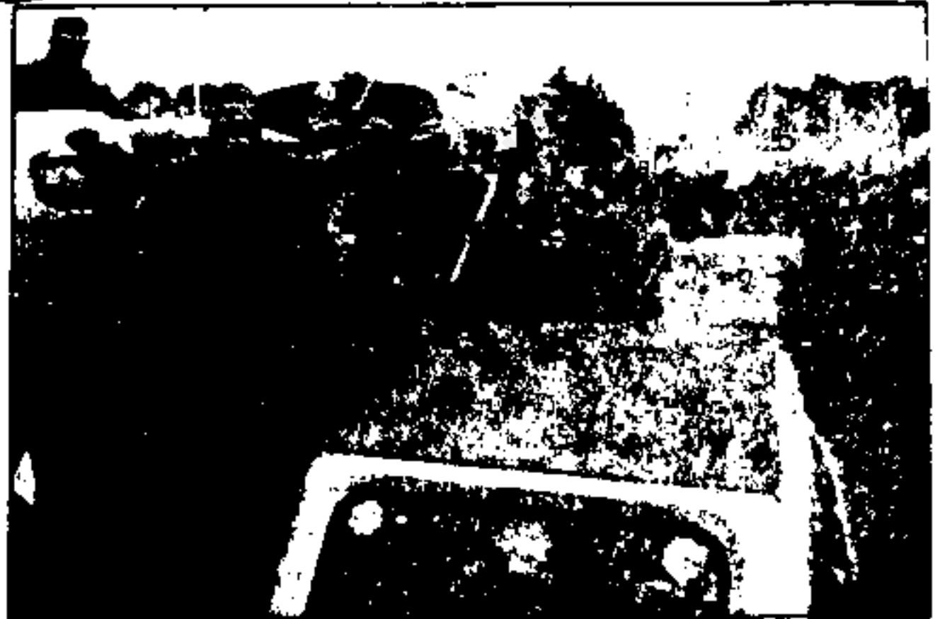
سرانجام بر شاه مردم - صفت عظیم مردم در میدان چهارستان در حالیکه سران را بر شاهنشاهی خود نشانند حرکت می کنند. در نگاهها شادی است و بر دنیا ایستاد.