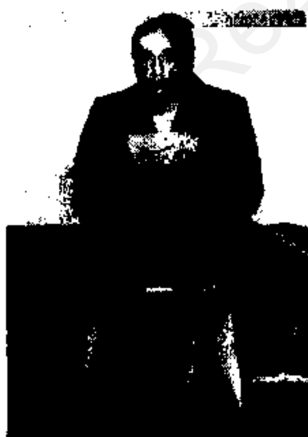
ارتشبد نعمت‌الله نصیری

فرهاد سهپیدی سفیر ایران در مراکش دیروز شش ساعت با شاه دیدار کرد.