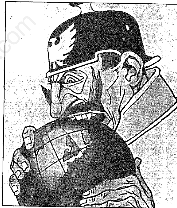
قیصر در حال بلعیدن جهان (از تبلیغات انگلیسی مابعد جنگ جهانی اول علیه آلمانی ها.)