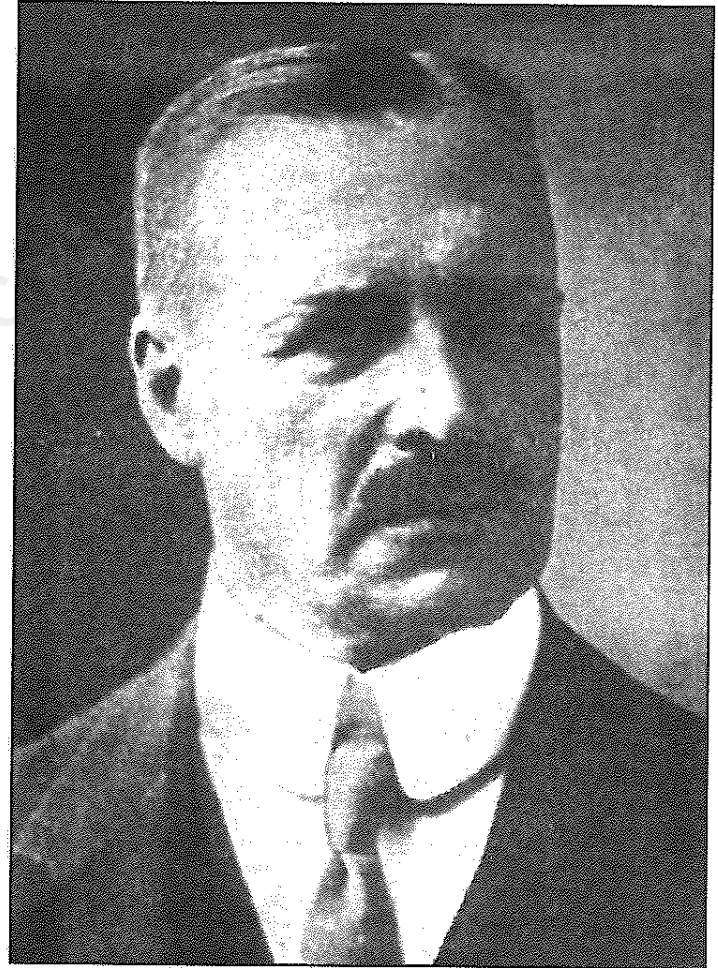
وانگنهایم ، سفیر آلمان در قسطنطنیه ، که در سال ۱۹۱۵ م در همان جادر گذشت و در کناره بسفر مدفون است .