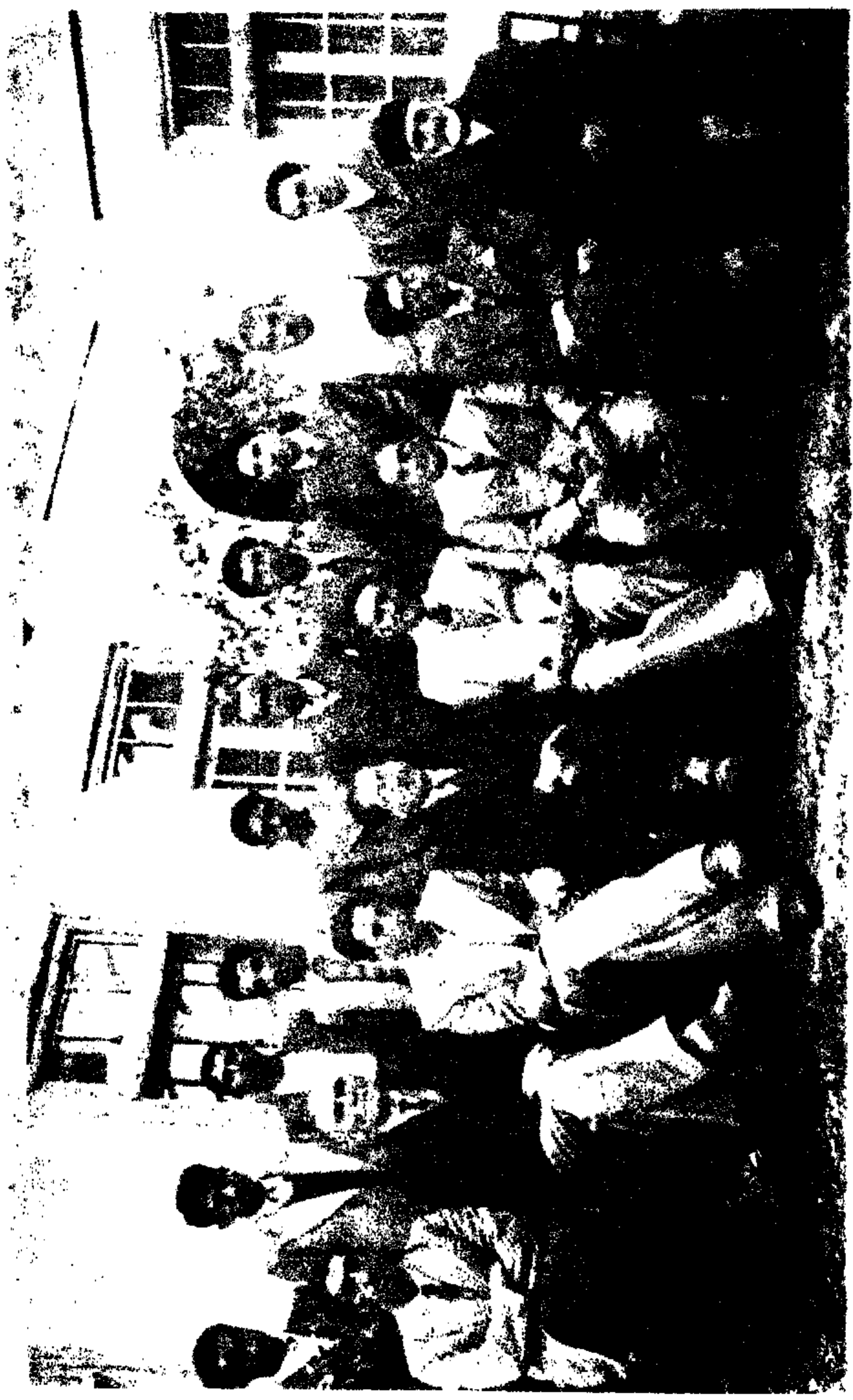
این عکس اولین دسته از اساتیدان و مشمولین دوره اول پوهنځی ادبیات پوهنتون کابل را بشما نشان میدهد.