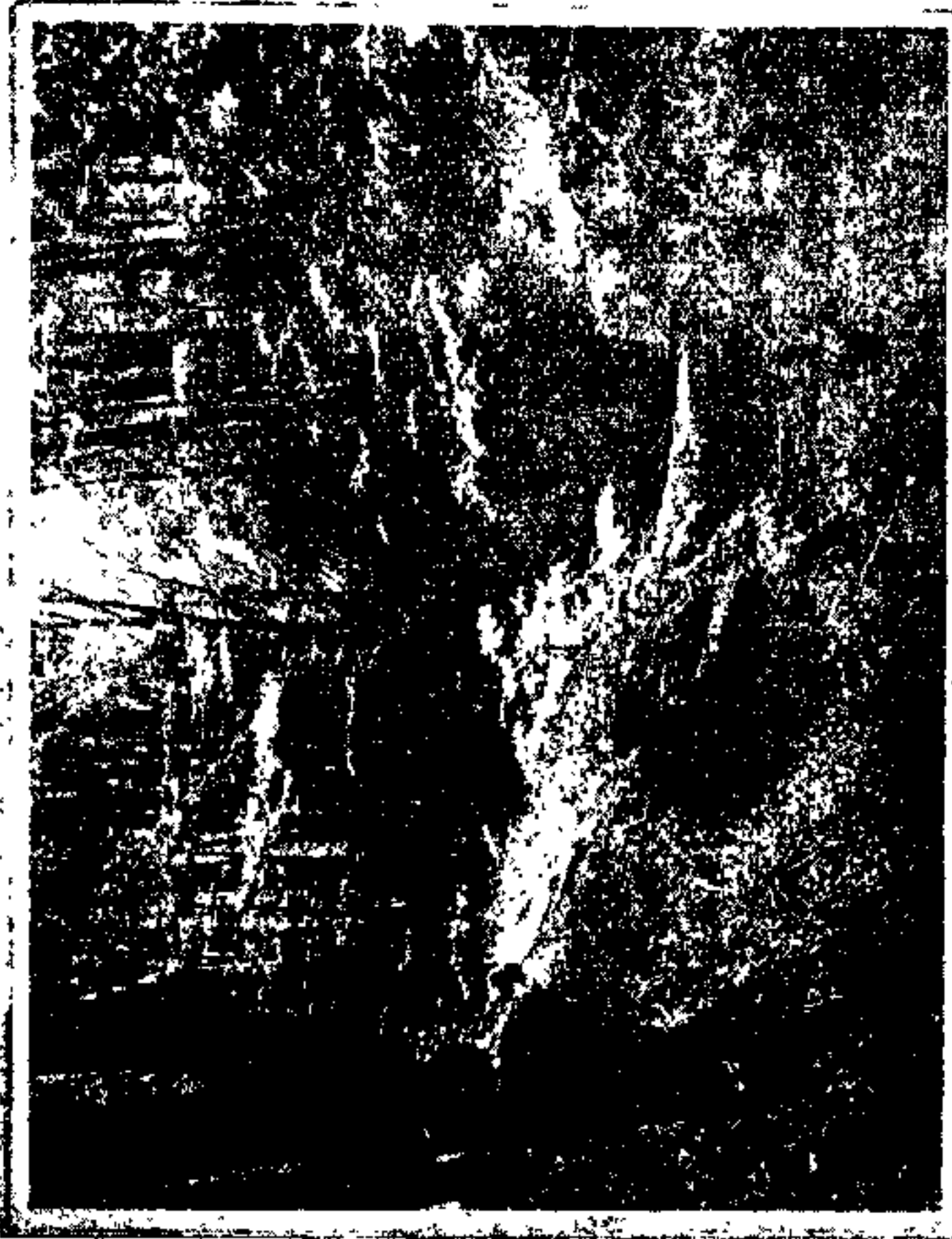
رشت ایران بان قسمت از جنگل Perse - Récht une partie de la Forêts