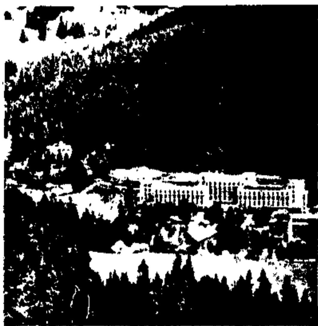
آسایشگاه شهر « کریویتزا »

به حال وقفه باقی ماند. از زمان بازگشت استقلال کامل شهرهای مزبور مجدداً در راه ترقی افتاده بزودی نه تنها آوازه شهرت آنها در سراسر کشور لهستان پیچید بلکه در خارج از آن نیز طرف توجه قرار گرفت. بهمین مناسبت بر شماره مسافریین و جهانگردان که برای استفاده و استحمام از آبهای معدنی آمدند افزوده