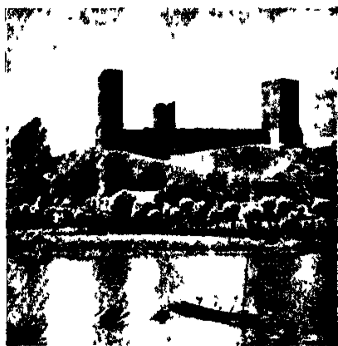
« حاج فدوی » « سبک »

و مسافرین این شهر در هر سال از صد هزار نفر تجاوز مینماید در حالیکه جمعیت خود آن از بیست هزار نفر تجاوز نمی‌کند این شهر در ناحیه تاترا (Tatra) در رشته‌کوه‌های کاریات در ارتفاع ۸۵۰ متر از سطح دریا قرار گرفته است را کویانه دارای لطیف‌ترین و مفرح‌ترین هواهاست که مخصوص برای مسلولین بسیار مفید میباشد آسایشگاه‌های چندی برای این کار در این شهر تخصص داده شده که با وجود پزشکان ماهر متخصص هر ساله شماره زیاد از مسلولین تحت درمان قرار گرفته معالجه میشوند