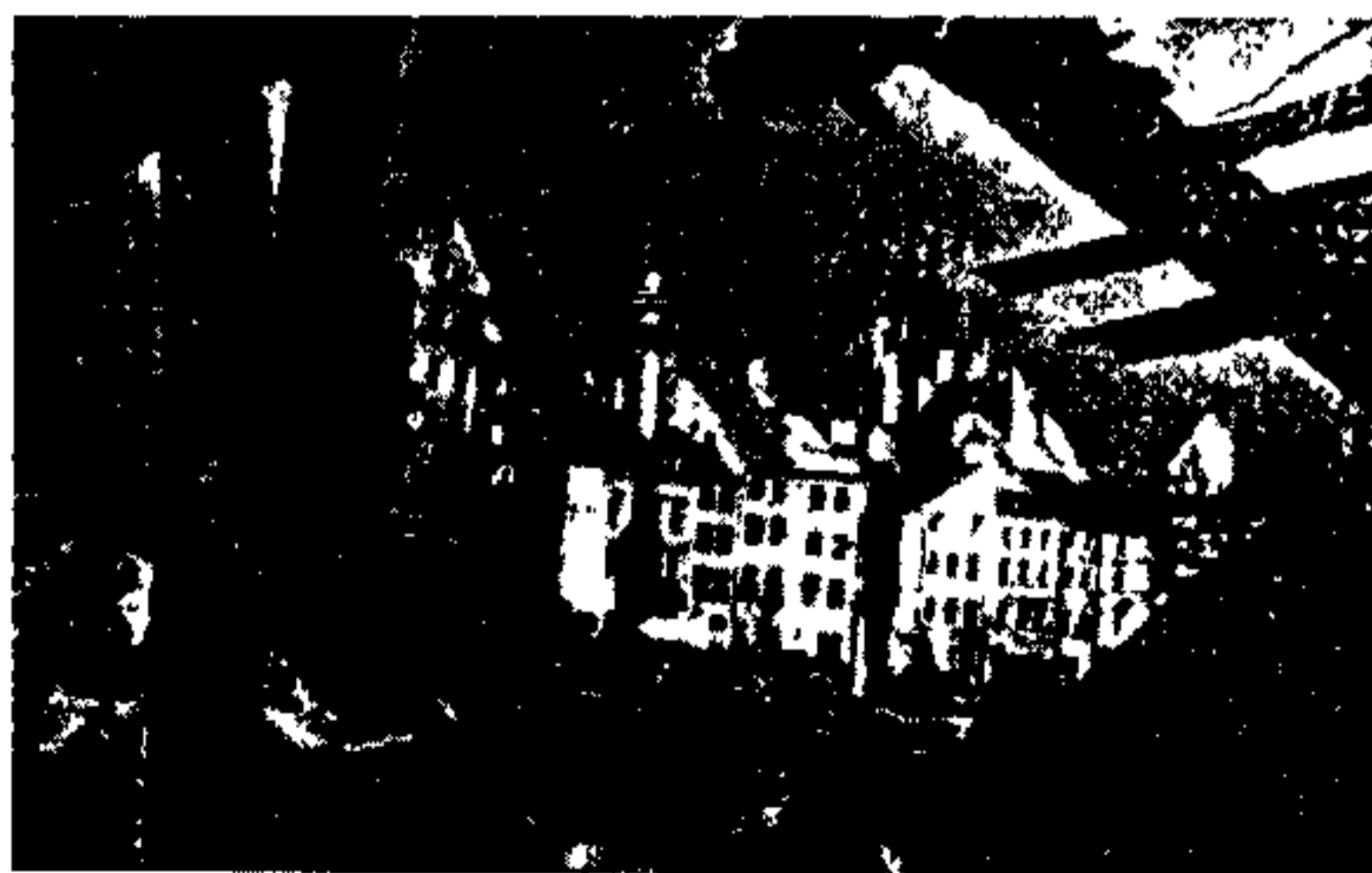
دور پادشاهی ورشو که بدست آلمانیها سوزانیده شد *

بنابر این ما در اینجا نقطه بنقطه بتمام مراحل پایداری لهستانیها بر علیه آلمانیها اشاره نمودیم. پس از شکست ابتدائی در سپتامبر ۱۹۳۹ ملت لهستان هرگز استعمار آلمانیها را قبول نکرد و هرگز از حق آزادی خود صرفنظر ننمود. از آن زمان تا بحال هرگاه حمله ای بر علیه آلمانیها شروع میشد لهستانیها در اولین صفوف سربازان قرار میگرفتند. با ذکر فداکاریها و دلاوریهای ارتشهای لهستان در فرانسه روسیه انگلستان نروژ و ایتالیا نباید در وحله اول کمک جسورانه ملت لهستان را در سراسر خاک اشغال شده لهستان فراموش کنیم. این ملت هرگز با فرمانفرمایی آلمانیها موافقت نکرد و تا کنون جزئی ترین کمکی هم با آلمانیها ننموده است. این ملت که در زیر فرمانروائی بیگانه زندگانی دشواری دارد و از ظلم و استبداد آلمانیها بدش ار تمام کشورهای اشغال شده اروپائی رنج میبرد. بخاطر آزادی فداکاریهای زیادی نموده است و تشکیل نیروی پنهانی میهن پرستان لهستان نیز نمونه ای از این فداکاریها میباشد و نیروی اخلاقی ملت نیز این نکته را ثابت میکند که ملت لهستان همواره زنده خواهد ماند و آزادی مقدس خود را دوباره بدست خواهد آورد.