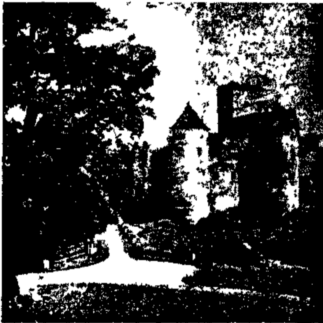
کاخ قدیمی « بیدریتسا »

سولتس (Solec) در مرکز . دارای آبهای سولفوروزو کلوروره سودیک .