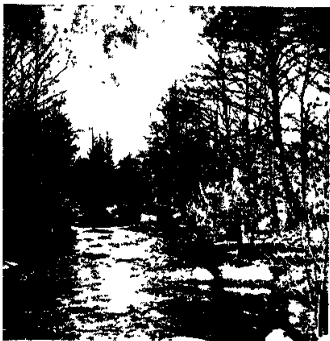
لهستان خاوری - و باتلاقیهای یوازی

زمانیکه جهانگرد بیگانه قدم در خاک لهستان بگذارد قبل از هر چیز يك نکته توجه او را جلب مینماید و آن عبارت از این است که : لهستان با اینکه در خاور اروپا قرار گرفته است معذک زندگی و تمدن آن کاملاً باختر زمینی و هم آهنگ ملل باختری اروپا میباشد . تمدن لاتینی اساس تمدن و عادات و اخلاق ملی لهستانیها قرار گرفته و این ملت با وجود حفظ خصائص و خصائل ملی گذشته خویش تمدن لاتین را پذیرفته و آنرا بتمام شئون زندگانی خود آمیخته است .