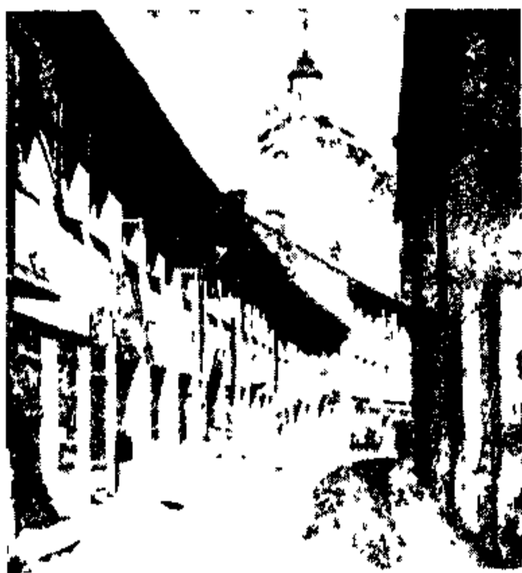
یکی از کوچه های قدیمی ویلنو

و صنعتی که با بیشتر از مراکز اقتصادی اروپا در ارتباط بود بشمار میرفت . لووو (Lwow) یکی از قدیم ترین و تاریخی ترین شهرهای لهستان است در عین حال قلعه مستحکم و سد سدید مرزهای جنوب خاوری بشمار میرفته است . این شهر بسیاری از تهاجم های اقوامی را که از این سمت کشور را مورد تهدید و خطر قرار داده بودند جلوگیری نموده است همین قلعه مستحکم است که در مقابل هجوم اقوامی مانند هنگریها و قزاقها و تاتارها و مللی مانند عثمانی ها و روسها و سوئدیها در سنین مختلفه پایداری کرده مانع از پیشرفت آنان شده است .