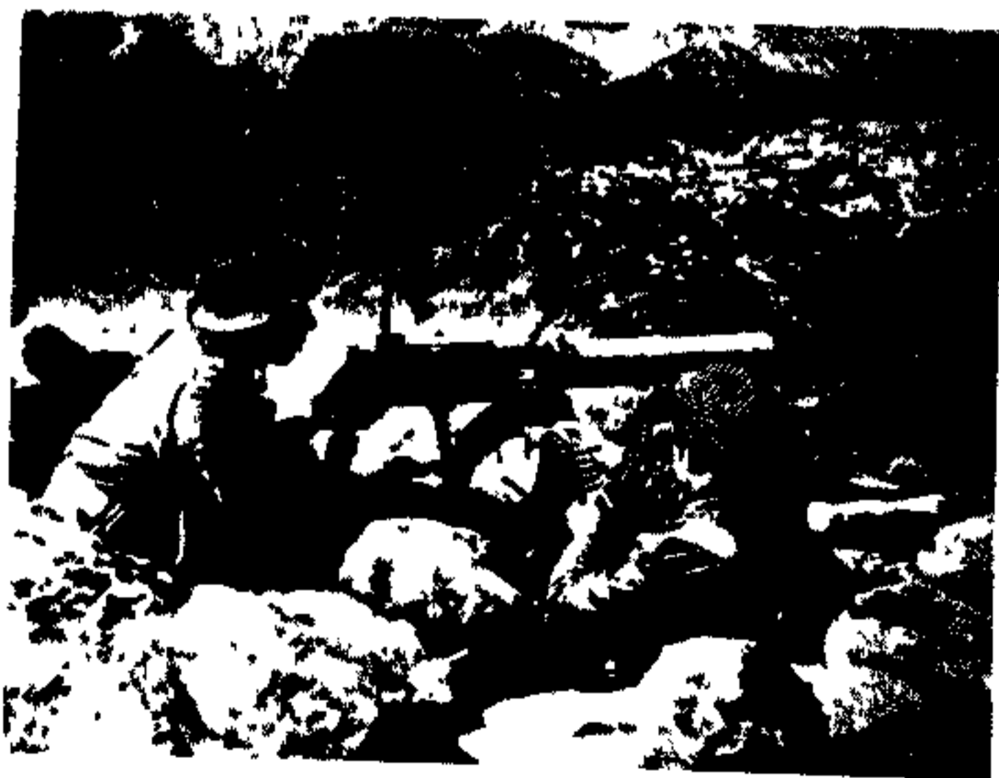
بیروهای لهستانی در میدان

بیروی دریائی لهستان سر امتحان خوبی داد گروهی رباتی از ناوهای لهستان توانستند خط محاصره دشمن را بشکافند و بیروی دریائی انگلیس یعنی همان بیروئی که تا امروز با آن همکاری مینماید ملحق شود مخصوصاً زیر دریائی اورژل (Orzel) یا عقاب یکماه تمام در آبهای مین گزاری شده دشمن مشغول عملیات بود اگر لهستانها واقعا فرصتی پیدا میکردند که بیروهای خود را دوباره جمع آوری کنند یقیناً جنگ لهستان پیش از آن مدتی که طول کشید ادامه میداد. بدبختانه وضعیتی ایجاد شد که بیروهای لهستان محصور شدند ترک محاصره کنند زیرا در روز ۱۷ سپتامبر سپاهیان شوروی از سمت حاور با گهاب در لهستان روی آوردند. آنها ناپایداری کوچکی مواجه شدند زیرا تمام سربازان لهستانی در حاک لهستان مشغول پیکار بر علیه مهاجمین آلمانی بودند. همجناس گمان نمرد که دولت شوروی لهستان بظن داشته باشد زیرا این دو دولت پیمان عدم تعرضی امضاء شده بود.