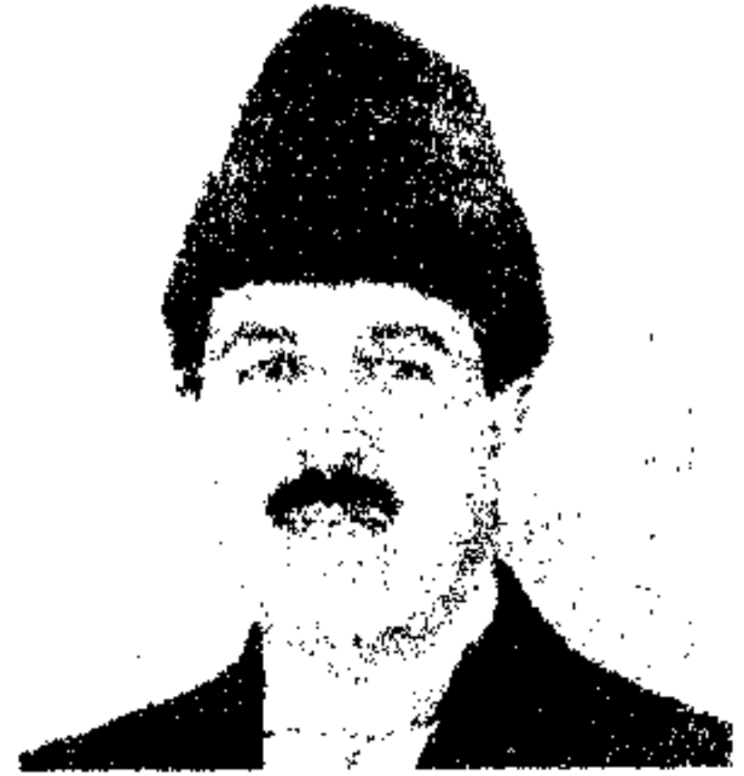
ع، ص حبیب اللہ خان طرزی معین سوم وزارت خارجه