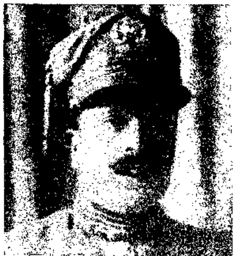
ع، ش محمد افضل خان و کيل رئيس ارکان حريه