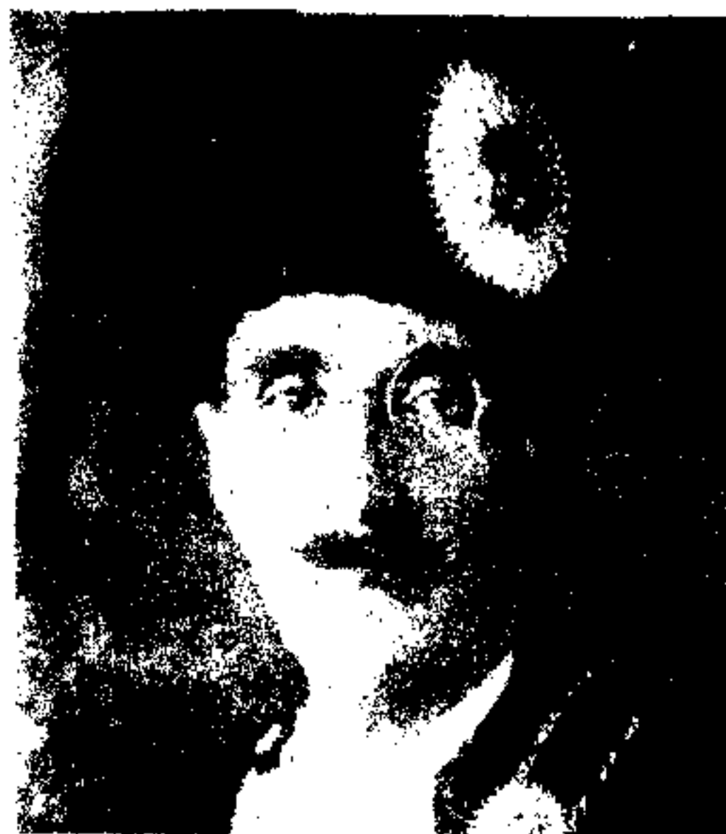
ع،ج،ا:۱ سردار شاه وليخان وزير مختار اعليحضرت در پاریس مهمه از جانبازیهای رشیدانه و عزم خلل تا پذیر شان وطن از تهلکات مدهشه نجات یافته است و این ذات عالی در دل هر فرد ملت جای مخصوصی داشته و محبوبیت فوق لاده دارند .

والا حضرت شاه وليخان یکی از فرزندان رشید و بااخلاق و دانای این آب و خاک است که در مواقع