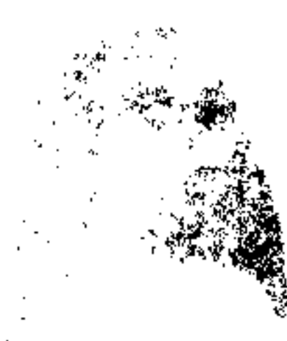
ع، ص عبدالرشید خان معین اول وزارت داخله

ع، ج ۱، ۱ نشان محمد گل خان وزیر داخله که ذات عالی یکی از تعلیمیافته‌های مکاتب عسکری افغانستان و در دوره گذشته مصدر خدمات مهمه عسکری و سیاسی در داخل و خارج مملکت برای وطن خود شده مخصوصاً درین دوره درخشنده خدمات ذیقیمتی را نسبت به فرو نشاندن آتش شورش جمعیت ذات همایونی و دیگر خدمات را از قبیل ریاستهای تنظیمه در قندهاره مشرقی، شمالی، و باقی ولایات ابراز نموده اند.