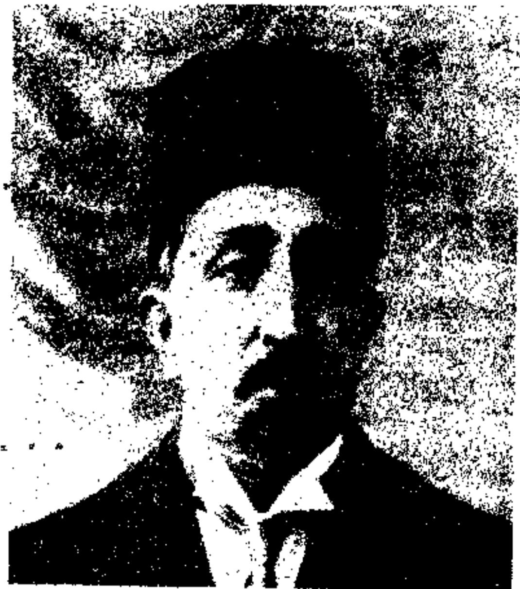
جناب والا حضرت سردار محمد هاشم خان صدر اعظم

والا حضرت موصوف در سال ( ۱۲۶۳ هجری شمسی ) تولد شده و بعد از فراغت تحصیل در سال ۱۲۸۲ به منصب سر سراوسی و در سال ۱۲۹۶ بقوماندانی عمومی قوای هرات برتبه نائب سالاری و در ۱۲۹۸ به منصب نائب سالاری و حاکم اعلای سمت معرفی و در ۱۳۰۰ یوکالت وزارت حربیه و در ۱۳۰۲ به سفارت ماسکو بالنوبه مقرر گردیده و وظایف خود را با جدیت ایفا نموده اند ، در انقلاب سال ۱۳۰۸ ریاست قوای ملی را در سمت مشرق افغانستان اداره کرده و از بدو بطوس شاهانه به سمت صدر اعظم ، کابینه را تشکیل نموده و الی حال مصروف خدمات افغانستان میشند ، ترقیات موجوده و امنیت مملکت و اداره کاع دوایر بفکر عالی و زحمت شیاروزی شان صورت گرفته است .