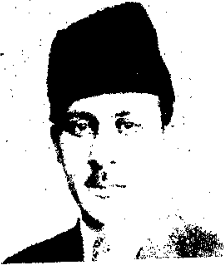
ع، ح آذی غلام محی خان معین اول وزارت خارجہ

ع، ح جناب فیض محمد خان وزیر خارجہ کہ یکی از فارغ التحصیلان مکاتب مملکت و در ادوار گذشته بوزارت معارف سفارت و نمایندگی های خارجی برای مملکت خود مصدر بسی خدمات برہمہ عرفانی و سیاسی شدہ و در عصر حاضر نیز با تہام جدیدیت و مساعی متصدع امور وزارت خارجہ میباشند .