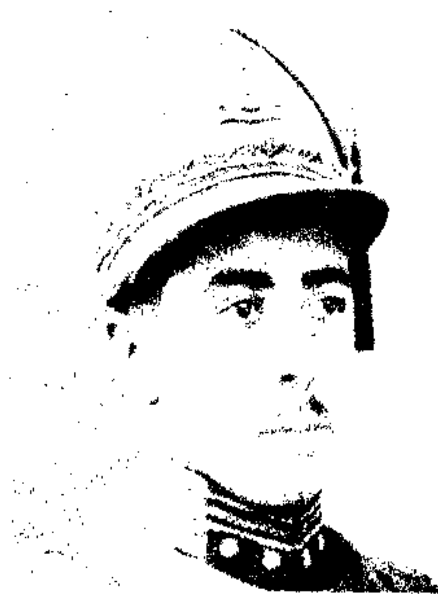
ع . ش . سردار اسدالله خان فرقه مشر قوماندان فرقه شاهي

عاليقدر شجاعت مآب شهزاده اسدالله خان قوماندان فرقه شاهي مركز ، فرزند اعليحضرت شهيد امير حبيب الله خان و همشيره زاده اعليحضرت محمد نادر شاه غازي تولد در سال ( ۱۳۲۸ قمری ) جناب شان از محصلين مكتب حبيبيه و مكتب عاليه لمانيه كابل بوده بعد فراغ تحصيلات مكاتب مذكوره بمقصد تحصيل فنون عسكري شامل تعليمگاه پياده عسكري مركز شده درين فن نيز موفقيت حاصل و بگرفتن شهادت نامه درجه اول كامياب گرديند در سال ۱۳۰۸ شمسي سرسروس ( يك قطعه از قشون خاصه ) حضور هيايوني مترد كردند و پس از اينكه مهارت و كفايت بسزا در اين ماموريت از خود ابراز نموده توانستند برتبه جليله نرغه مشري و قوماندان عمومي فرقه شاهي ارتقا يافت ، فعلاً بهمين ماموريت خود موظف ميباشند .