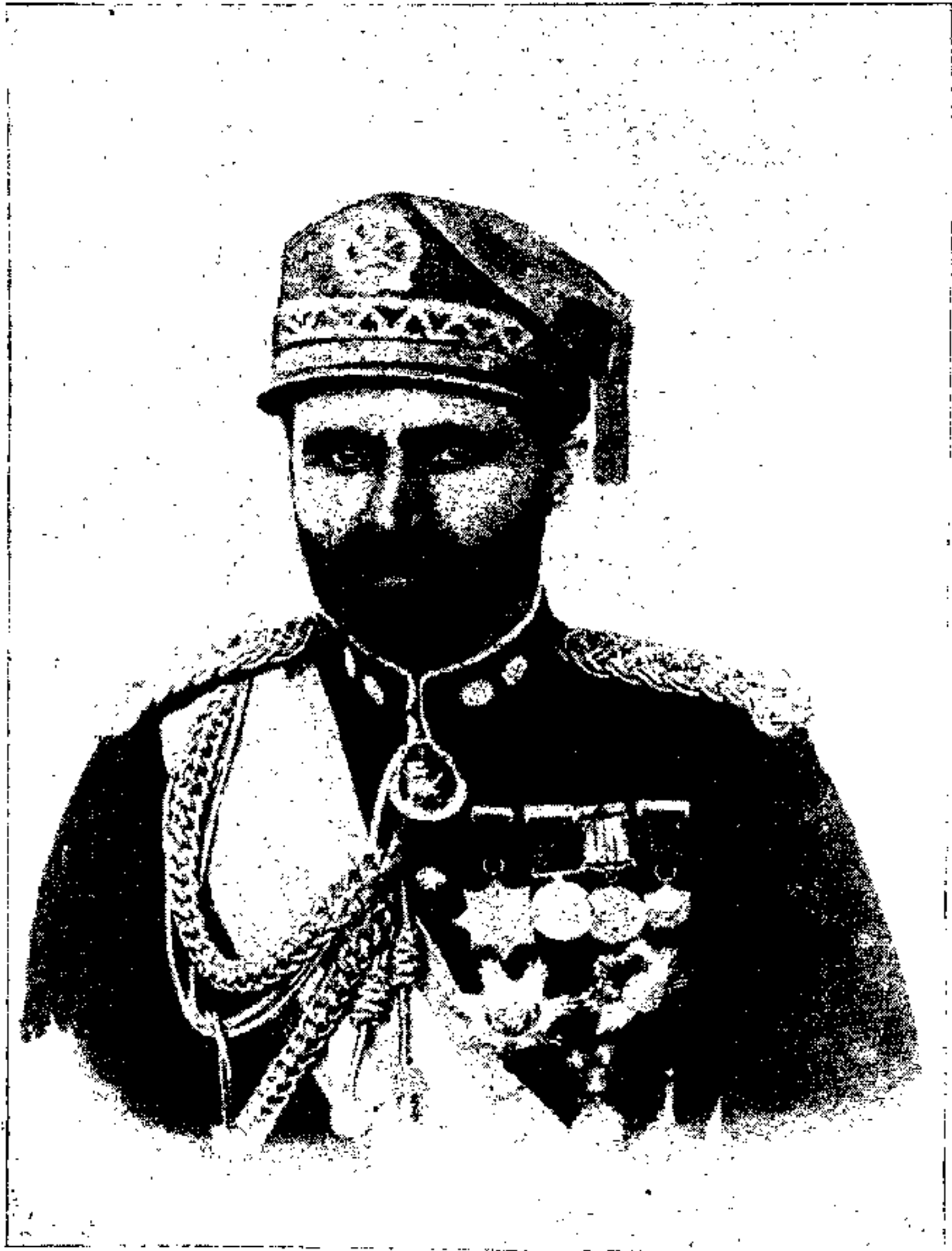
ع، ح، ش مرحوم عبدالوکیل خان نائب سالار که در راه امنیت وطن حیات عزیز خود شانرا در محاربه اشراار شمالی سال ۱۳۰۹ ایثار نموده و بتقدیر جان باری وفدا کاری شان منار یادگاری از طرف ذات هایون محمد نادرشاه غازی در سرك دارالامان بنام شان دوشرف بنا و تعمیر است