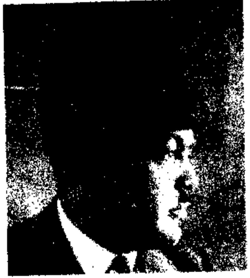
ع، ص محمد عثمان خان معین دوم وزارت خارجه