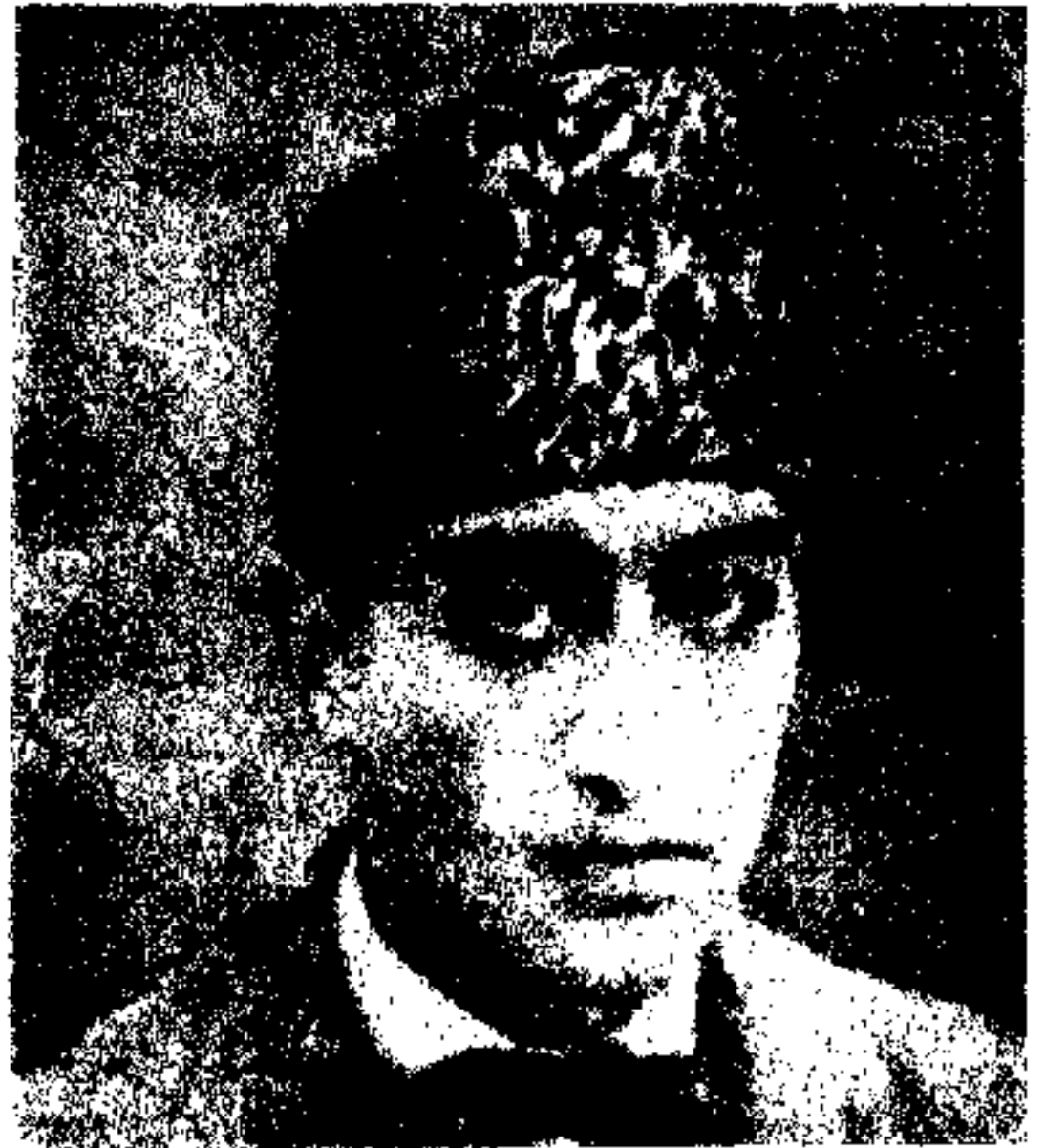
ع ، ج سردار محمد نعيم خان وزير مختار اهلحضرت در ايطاليا

عاليقدر جلا ثمآب سردار محمد نعيم خان فرزند والاحضرت سردار محمد عزيز خان سفير افغانى در برلن از طلاب فارغ التحصيل مكاتب حبيبيه و امانيه كابل بوده بعد تكميل در سال ۱۳۰۹ شامل وزارت خارجه شده بعد ابراز قابليت بمديريت عمومي سياسى آن وزارت نائل شده و در سال ۱۳۱۱ به وزارت مختارى دولت عليه افغانستان در روما تعيين و اعزام گرديده اند .