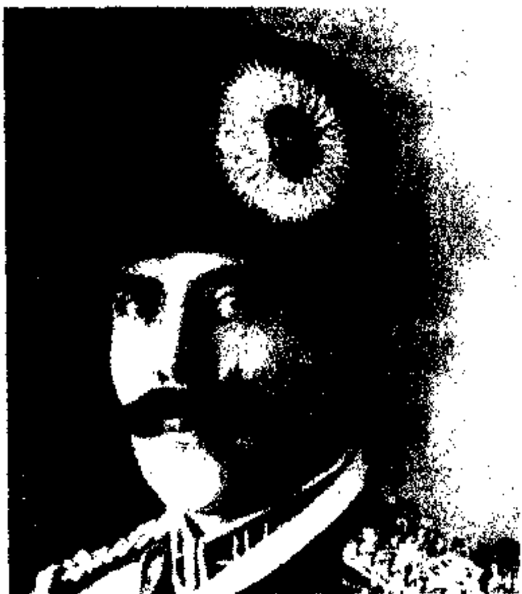
ع ج ، ا ، ا والاحضرت وزیر صاحب حربیه سپه سالار غازی .

عالیقدر جلالتمآب المراعلی نشان والاحضرت شاه محمودخان غازی سپه سالار و وزیر حرب افغانستان برادر کبیر اعلیحضرت محمد نادر شاه غازی متولد در سال ۱۲۶۵ هجری شمسی یکی از جنرال های معروف وطن در محاربه استقلال بوده و در حکومت سابقه مصدر خدمات مختلفی به مملکت گردیده اند از قبیل قوماندانی نظامی پدختان و حکومت اعلی سمت مشرقی و مستشاری و زارت داخله افغانستان ، آخراً در محاربه نجات وطن به مهیت قائد بزرگ افغانستان تاجدار موجوده ، خدمات مهمی کرده برتبه وزارت حلیله حربیه تایل و ازان به بعد که مستقیماً زمام اداره قشونی مملکت را بکف گرفتند ، چه در مورد تشکیلات و تنظیمات اردو های عسکری افغانستان چه در مسئله فرونشاندن آتش های شرارت و طغیان حوادث ناهنجار که مولودات انقلاب گذشته وطن بشمار بوده است از قبیل واقعه شرارت مرتبه دومین اشرار شمالی ، واقعه ابراهم بیگ شنی ، فتنه دری خیل های جدران که هر کدام این واقعات خیلی مدعش و سنگین بوده و فقط به کفایت و کار دانی این ذات شجاع و دوستدار صمیمی مملکت با نهایت جدیت و کفایت شعاری شان خاتمه یافته ، و وطن در اثر شمشیر ذات عالی شان مشمول این همه امنیت کامله گردیده است .