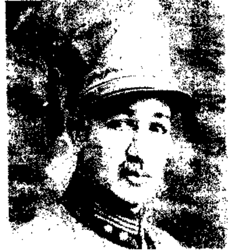
عاش احمد علیخان فرقه مشر رئیس اردو