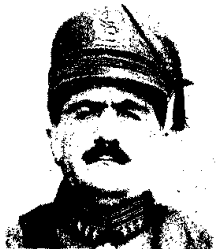
ع، ع، ش شير احمد خان نائب سالار رئيس نوآم وزارت حريه