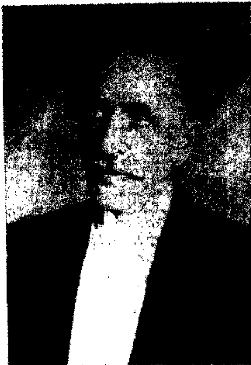
رئیس جمهور - اگناسی موسیکی IGNACI MOSCICKI

جمهوریتی است در یورپ ، دارای مساحت ۳۸۶,۰۰۰ مربع کیلومتر و ۳۱,۹۲۷,۷۷۳ نفوس، هفتاد فیصد سکنه آن پولندیها میباشد، بقیه مرکب اند از جرمن ها ، یوکرانی ها و یهودیها ، تشکیل اساسی عبارت است از دو مجلس یکی سنا که ۱۱۱ عضو دارد، دوم مجلس وکلا که دارای ۴۴۴ اعضا میباشد. رئیس جمهور برای موعده هفت سال انتخاب می شود، حکومت پولیند برای رفع جهالت و بی سوادی ملت کوشش انتهائی خود را بصرف میرساند ، تعلیم ابتدائی مجانی و جبری است ، وارسا مرکز آن ست. برای پیرها و مکین ها شناخانه های رایگان و جبهه غربا در تمام مملکت دارالساکنین است .