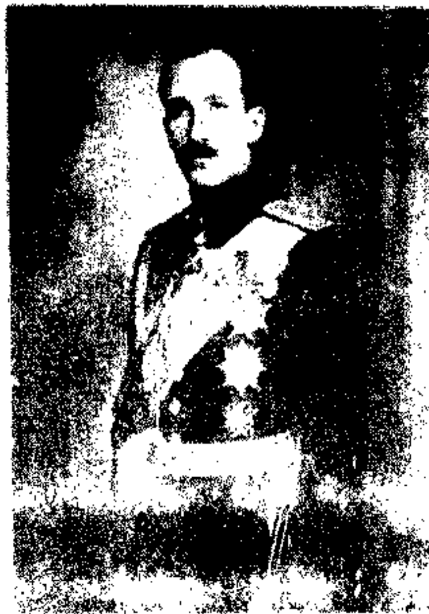
زار - بورس ثالث BORIS III

یکی از سلطنت های خرد یورپ است که دارای ۶ میلیون نفوس میباشد، مرکز آن صوفیه ۲۱۳۱۶۲ نفوس دارد ، دو نکت اعلی آن در زراعت مشغول میباشد صنایع در بلغاریا چندان ترقی نیافته است . صادرات آن عبا کوه ، جوار ، گندم ، چرم خام ، جو ، تیل خاک ، و عطر گلاب میباشد ، تعلیم ابتدائی مجانی و اجبری است . مرکز آن دارای یک یونیورسیتی است . اختیارات قانون وضع به یک اطاق واحد مربوط است . نام اطاق سوبرانی است که دارای ۲۲۷ عضو میباشد و اعضاء آن برای مدت چهار سال بقرار آرای عموم منتخب میشوند ، سن عضو لایق انتخاب از ۳۰ سال بزرگتر میباشد . بقرار معاهده ورسای ، بلغاریا از سواحل بحیره ایجیان مشمول مقدونیه محروم گردید . اما بقرار معاهده که با یونان در سنه ۱۹۲۴ نموده است برای بلغاریه اجازه داده شده که زیر سرانیت و نگرانی انجمن اقوام از راه بحیره ایجیان تجارت کرده میتواند .