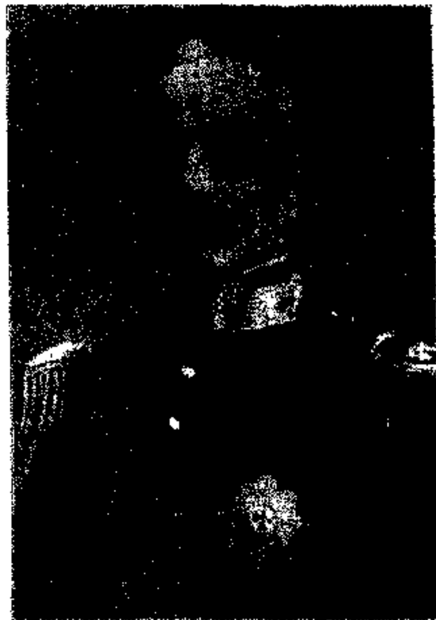
رئیس جمهور - ای . او . دی فراگوسا کارمونا A. O. DE FRAGOSA CARMONA

پید از انقلاب سنه ۱۹۱۰ جمهوری شده و شاه مانول دوم خلع گردید ، تشکیلات اساسی آن مرکب است از يك مجلس ملی دارای ۱۶۴ عضو که بکثرت رای عموم برای سه سال انتخاب میشود و اطاق عالی دارای ۷۱ عضو که مجالس بلایه آنها را منتخب می کنند ، نصف اعضای مجلس عالی بعد از هر سه سال تبدیل میشود. هر دو اطاق رئیس جمهور را برای موعده چهار سال انتخاب می نماید ، تعلیم ابتدائی و خدمت عسکری اجبری است .