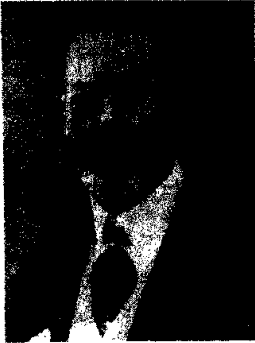
شاه و امپراتور - جارج خامس GEORGE V

عده دارالامراء ( ۷۴۳ ) نفر است ، زن حق شمولیت ندارد .