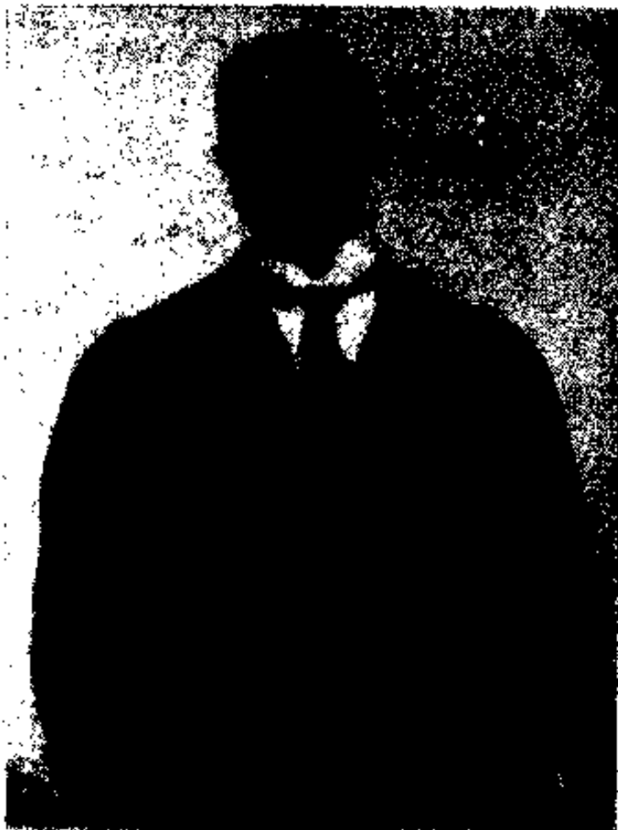
رئیس جمهور - تامس گاری گوماسارک THOMAS GARRIGUE NASARYK

جمهوریتی است در اروپای مرکزی و مرکب است از چهار علاقه سابق استریائی: پوهییا - موراویا