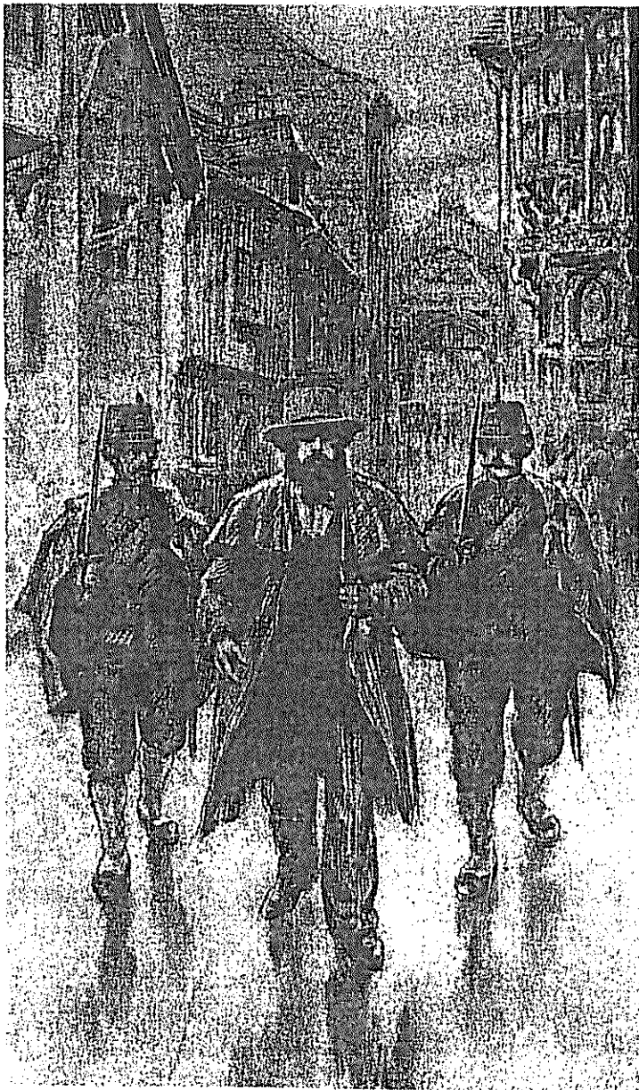
فوریه ۱۸۴۸، صحنه دستگیری کارل مارکس در بروکسل (بلژیک)، کمی بعد از انتشار «مانیفست کمونیست» در لندن.