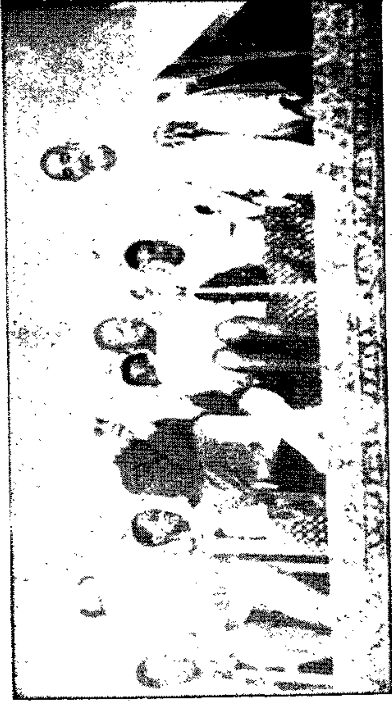
صف اول از راست بچپ : عبدالغفارخان . مهاتما گاندی . پانڈیت نہرو . د کتر صدیقی ( رجوع شروع ہوا )