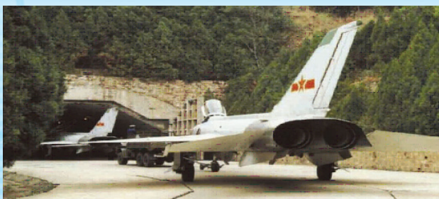
اختفای هواپیمای جنگی در داخل تونل

۲- اختفا: اختفا به معنای مخفی شدن فرد و پنهان کردن تأسیسات و تجهیزات از دید دشمن است به طوری که نیروی مقابل نتواند وجود کسی یا چیزی را در آن موقعیت تشخیص دهد.