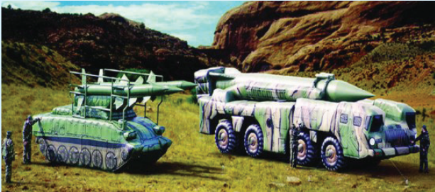
ماکت فریبنده ی موشک های اسکاد و سام ۶۰

فریب دشمن از گذشته های دور تاکنون یکی از مهم ترین اصول کشور داری بوده است، به نحوی که «سون تزو» از فرماندهان سال های قبل