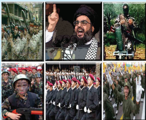
سید حسن نصراله و رزمندگان حزب ا... لبنان

پس از پایان جنگ روزنامه واشنگتن پست در تحلیلی چنین نوشت: «روحیه، سازمان یافتگی، تسلیحات پیش رفته و فلسفه ی شهادت، راز مقاومت و پیروزی حزب ا... لبنان بوده است.» اگر به این جمله یک بار دیگر دقت کنید، متوجه می شوید که از چهار عامل ذکر شده به عنوان عوامل پیروزی حزب ا... لبنان، تنها یک مورد آن استفاده از تسلیحات پیش رفته ی نظامی است و سه عامل دیگر آن در محدوده ی دفاع غیرعامل می باشد که حزب ا... لبنان توانسته است با بهره گیری از آن، ارتش تا بن دندان مسلح رژیم صهیونیستی و تمام حامیان آن ها را به زانو درآورد.