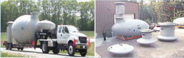
پناهگاه های دفنی سبک و قابل حمل و نقل

ب- آلمان: کشور آلمان با وجود آن که در شرایط حاضر از جانب هیچ کشور دیگری تهدید نمی شود، دارای پناهگاه هایی است که در