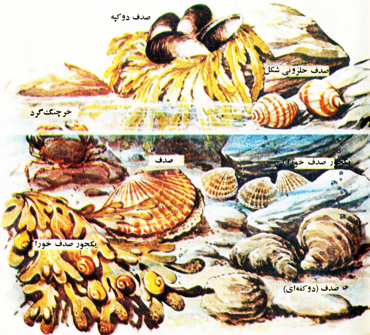
صدف (دو کفه ای)