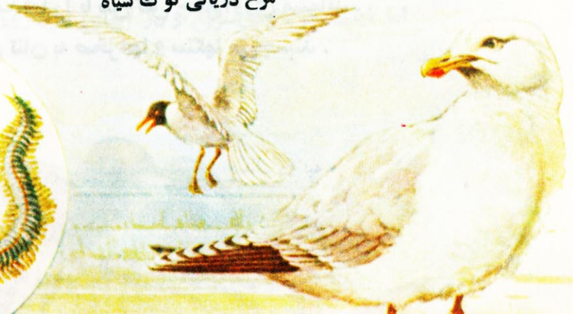
مرغ دریائی پرسیاه