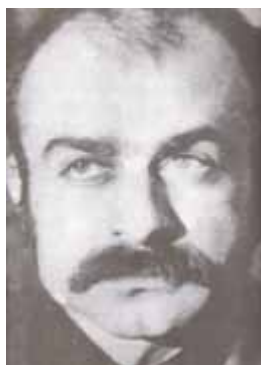
به نام نامی مردم