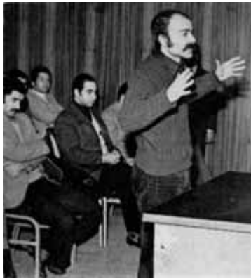
من برای جانم چانه نمی‌زنم

زندان‌های ایران پر است از جوانان و نوجوانانی که به اتهام اندیشیدن و فکر کردن و کتاب خواندن، توقیف و شکنجه و زندانی می‌شوند.