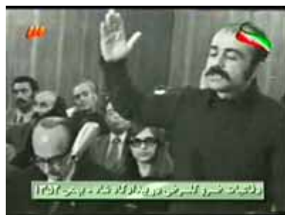
ای سرزمین من