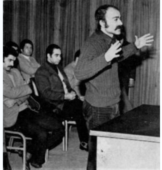
خسرو گلسرخی در دادگاه رژیم پهلوی

گلسرخی در دوران حکومت محمدرضا پهلوی به همراه کرامت‌الله دانشیان محاکمه و اعدام شد. محاکمه و سخنرانی افشاگرانه او در این محاکمه در همان زمان به طور ناقص از تلویزیون پخش شد و در ۲۹ بهمن ۱۳۵۷، در سالگرد اعدام او و تنها چند روز پس از وقوع انقلاب، به طور کامل پخش شد و شهرت بسیاری یافت. گلسرخی از آن پس از چهره های شناخته شده چپ بوده و بسیاری یادش را گرامی می دارند.