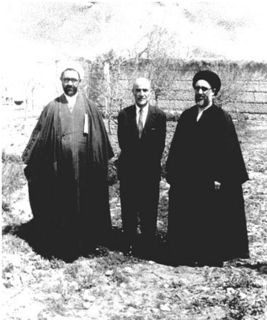
مراسم جشن عید فطر انجمن اسلامی دانشجویان دانشگاه تهران، در گلشهر کرج - سال ۱۳۳۷ (مرحوم آیت الله طالقانی، مرحوم مهندس بازرگان، شهید استاد مطهری)